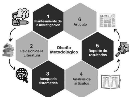
Figura 1. Proceso del diseño metodológico