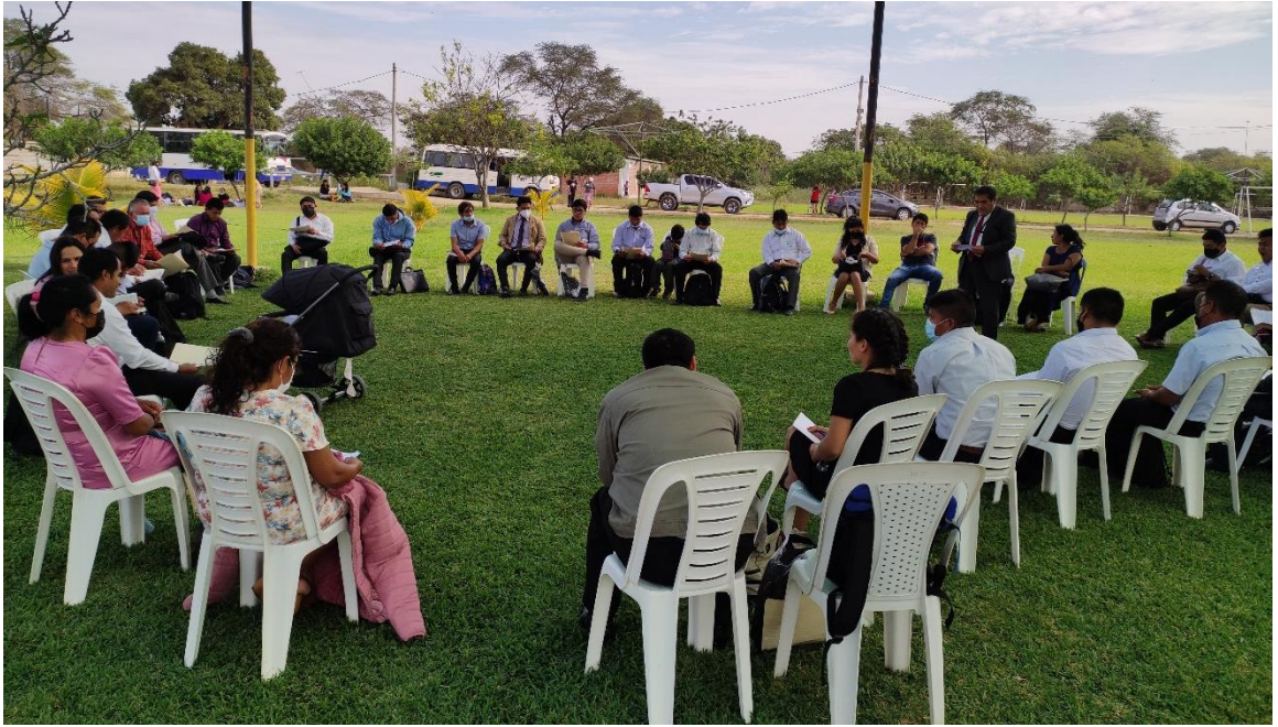
3. Figura 3. Evangelistas de todo el distrito misionero de Olmos