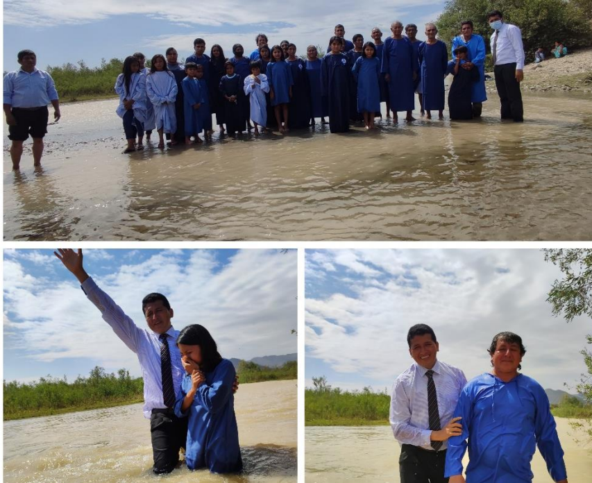
11. Figura 11. Bautismos en Zona de Motupe