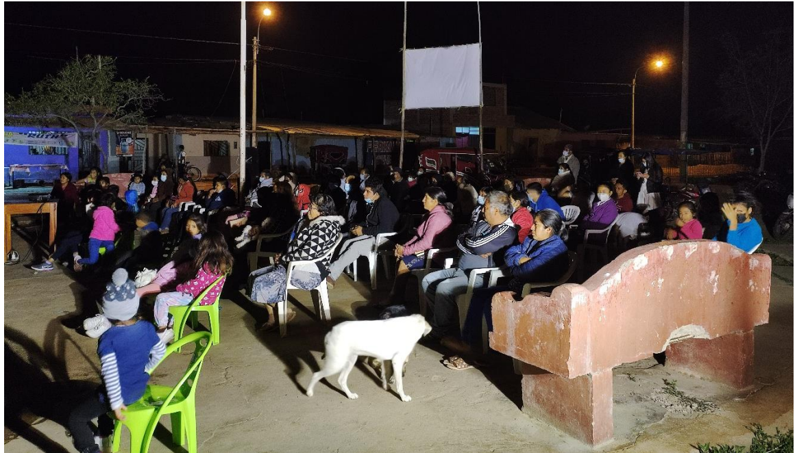
7. Figura 7. Mi esposa en campaña evangelística de la iglesia Nuevo amanecer