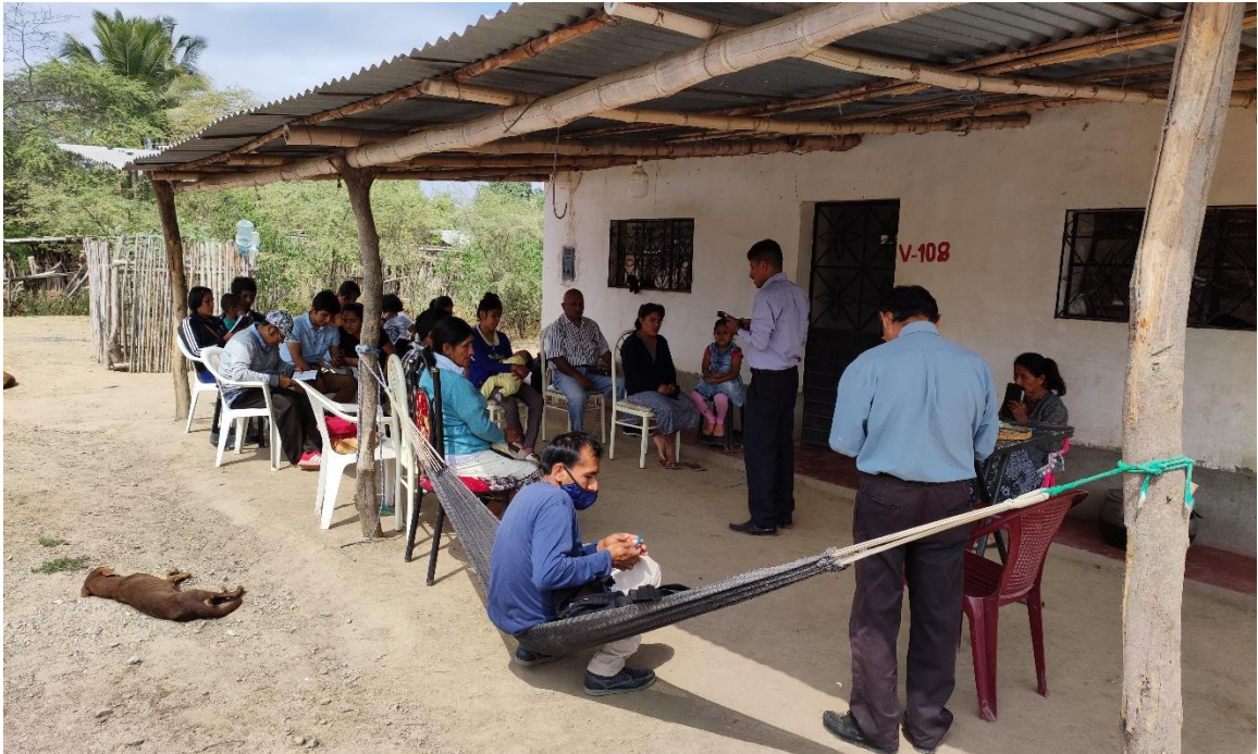
19. Figura 19. Nueva filial en el centro poblado el Puente – Zona Olmos