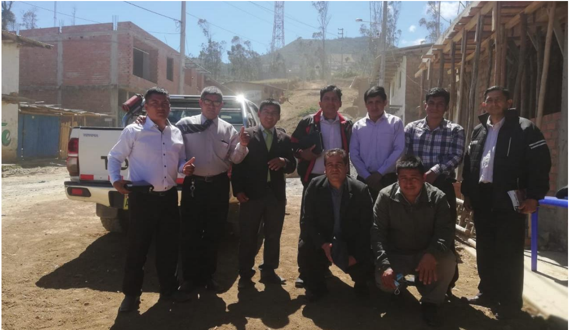
5. Figura 5. Evangelistas de la zona de Olmos