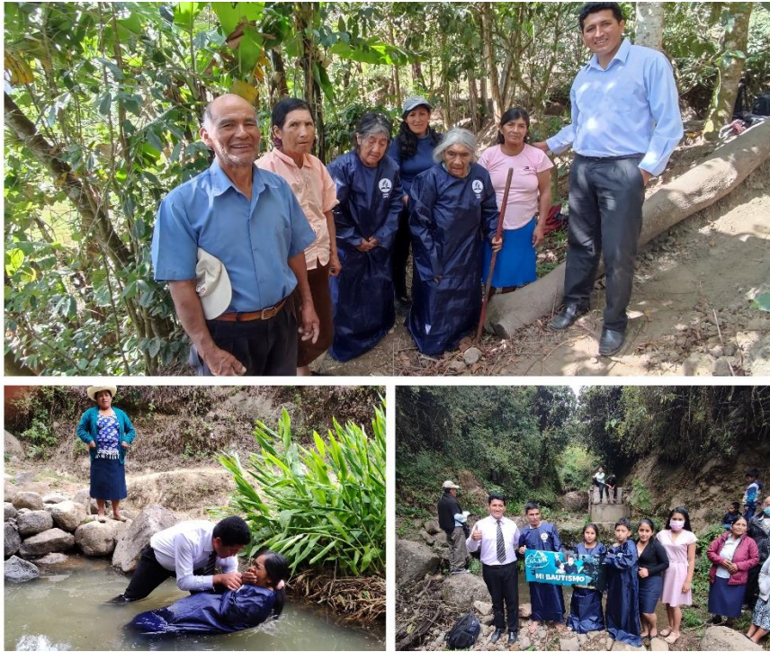
15. Figura 15. Bautismos de fin de año 2021 en Zona de Olmos