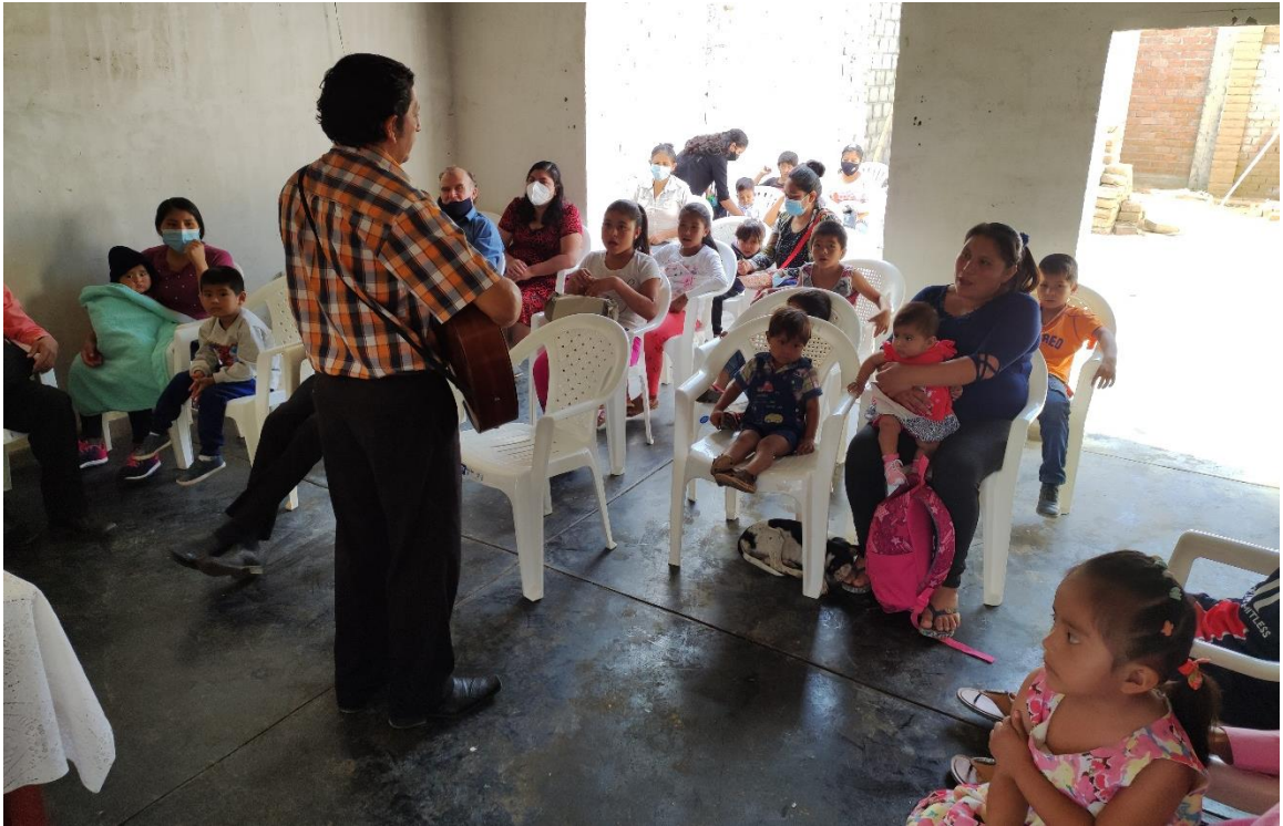
17. Figura 17. Nueva filial en el centro poblado la Desmotadora - Motupe