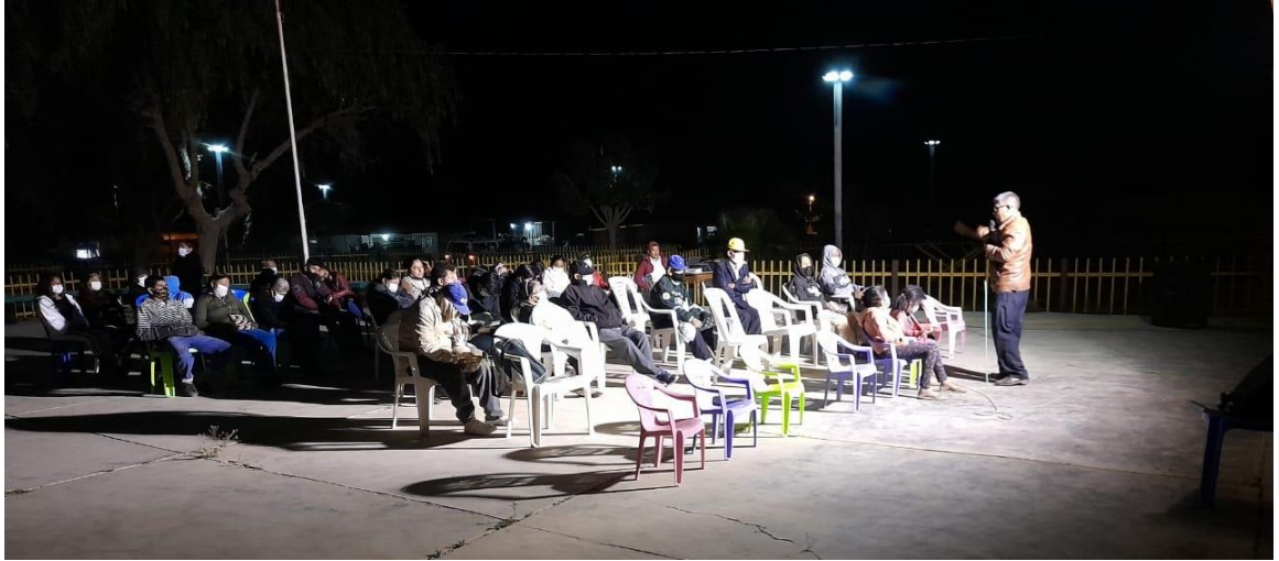
9. Figura 9. Finalizando campaña evangelística en zona de Olmos