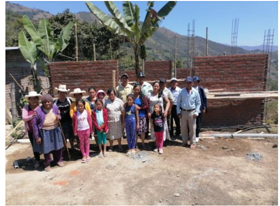
Foto #4 Plantío de iglesia (Filial) “Algarrobal”, Chulucanas, 2021