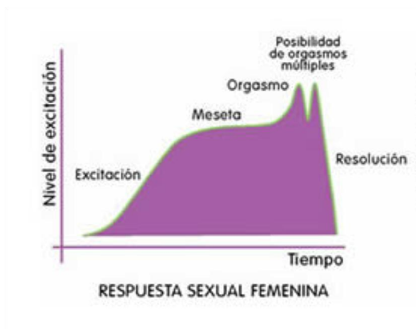
Ilustración 3: Ciclo de la Respuesta Sexual Femenina