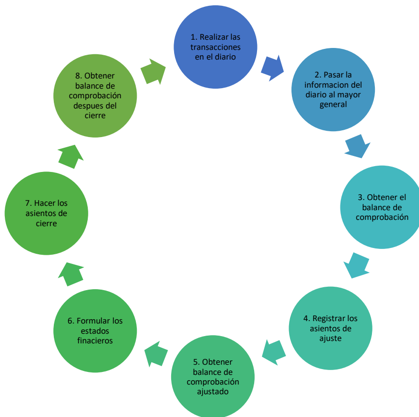
Figura 2: Pasos del proceso contable