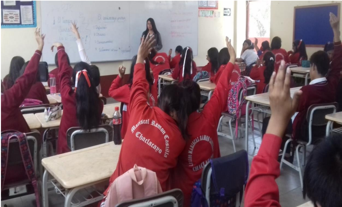
Estudiantes comprometidos en participar de la investigación.