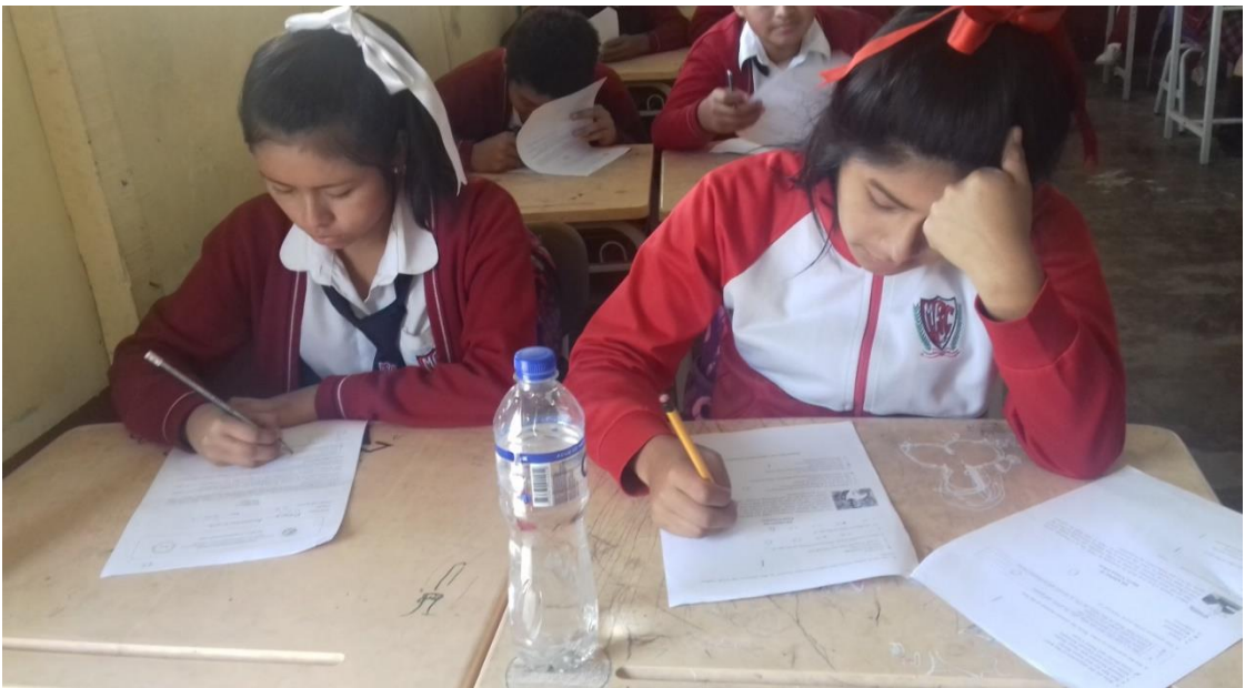
Estudiantes del 3º "C" resolviendo el test de comprensión de lectura en inglés.