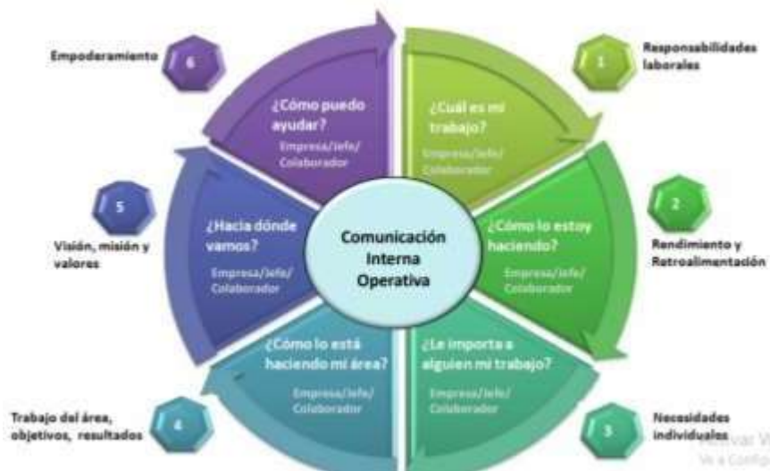
Figura 3. Comunicación interna operativa