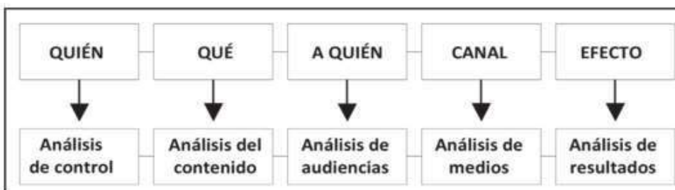
Figura 1. La comunicación. Cómo saber qué decir, a quién y en qué momento

Vizcaya et al. (2017) mencionan que la comunicación interna es un proceso planificado y se articula con los objetivos de la organización, contado con elementos que son clave para la comprensión del entorno y darle gran valor. Es decir, al conocer y aprender la mejor manera de usar las herramientas de comunicación, una persona puede obtener más fácilmente lo que quiere, ya sea dentro o fuera de una empresa, asimismo, el pensamiento y las acciones de la empresa, destacando las posiciones que asumen sus líderes y la conciencia de la función social.