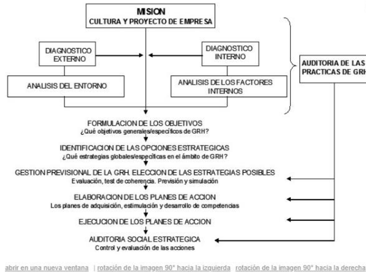
Figura 1 Gestión estratégica del talento humano

conocimiento, aplicación y también la adaptación de un trabajador al momento de optar por un puesto laboral. Además, señala que la capacidad se analizaba según la adquisición, estimulación y desarrollo de las practicas del trabajador, en la compañía, detallando la siguiente figura.