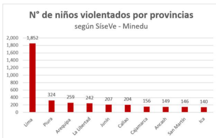
Figura 2. Reporte de niños violentados en el 2019 distribuido por departamentos, extraído de Diario Gestión (2019).

Considerando lo anterior y dentro del año 2019, la figura 2 indica que Lima presenta 1852 casos de niños víctimas de violencia escolar o Bullying, en contraste a los demás departamentos de Piura y Arequipa con 324 y 259 casos respectivamente, estos últimos ocupan el segundo y tercer lugar; a pesar de ello, se cree que hay más casos que no se reportan por lo que estas cifras pueden no reflejar el problema oculto en las escuelas del Perú (Diario Gestión, 2019).