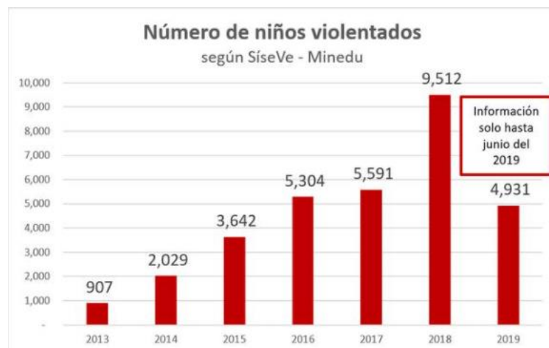
Figura 1. Reporte de niños violentados desde el 2013 hasta el 2019 por el Ministerio de Educación extraído de Diario Gestión (2019).

Considerando lo anterior y dentro del año 2019, la figura 2 indica que Lima presenta 1852 casos de niños víctimas de violencia escolar o Bullying, en contraste a los demás departamentos de Piura y Arequipa con 324 y 259 casos respectivamente, estos últimos ocupan el segundo y tercer lugar; a pesar de ello, se cree que hay más casos que no se reportan por lo que estas cifras pueden no reflejar el problema oculto en las escuelas del Perú (Diario Gestión, 2019).