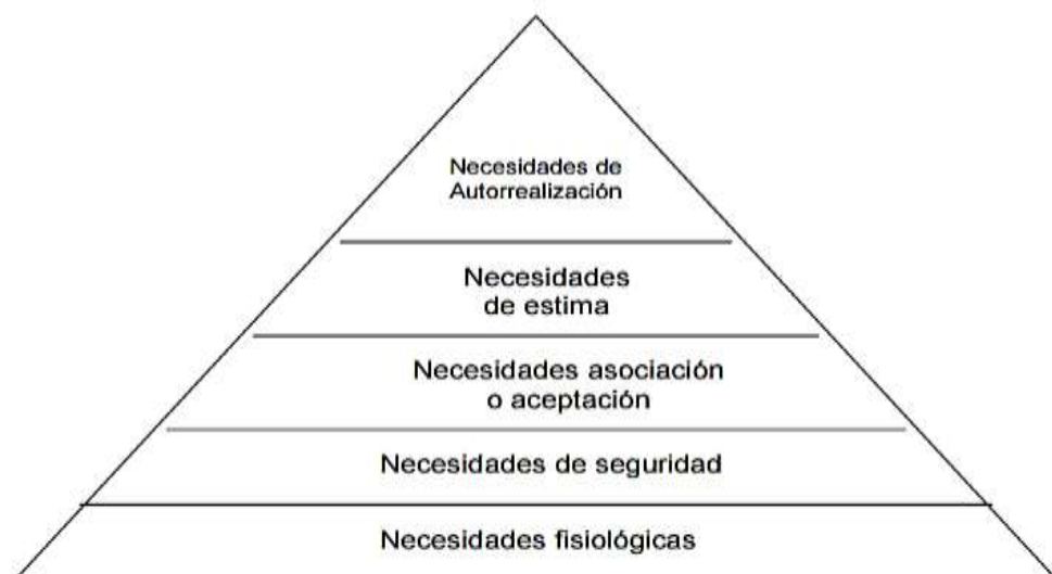
Ilustración 1: Jerarquía De Las Necesidades De Maslow