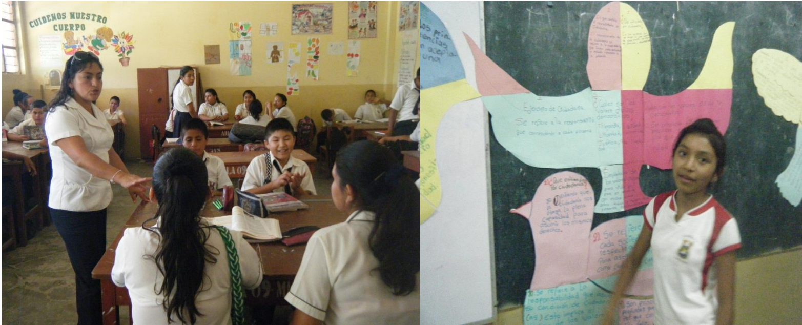
La docente trabajando con sus estudiantes