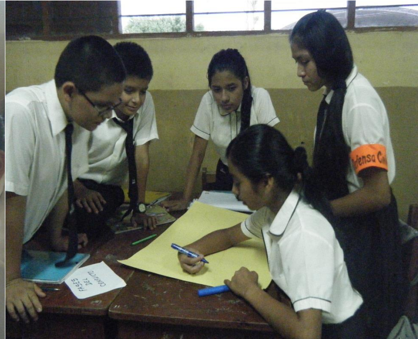
Estudiantes trabajando la estrategia en el aula