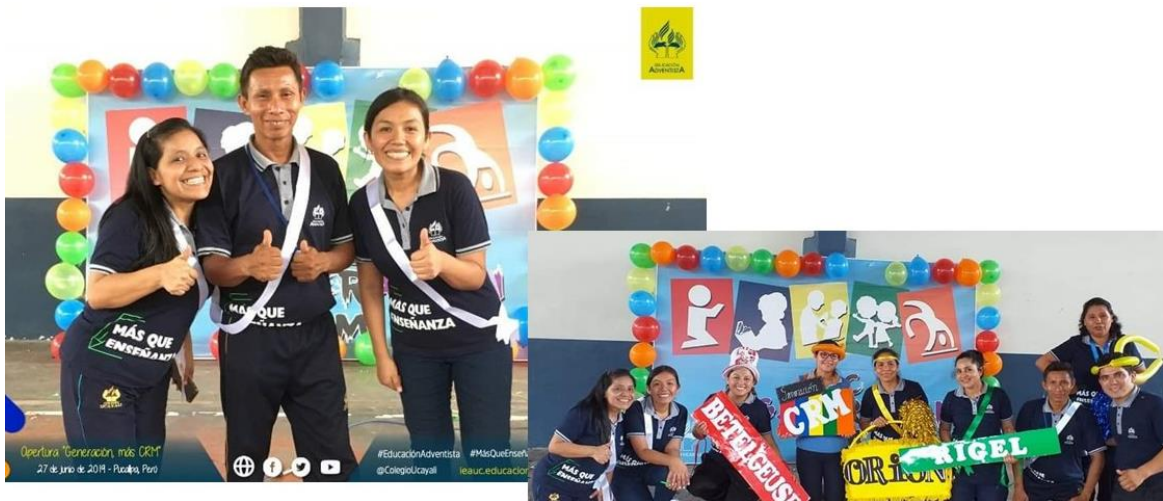
Figura B18. Evaluadora del proyecto GX colegio Ucayali, 2019.