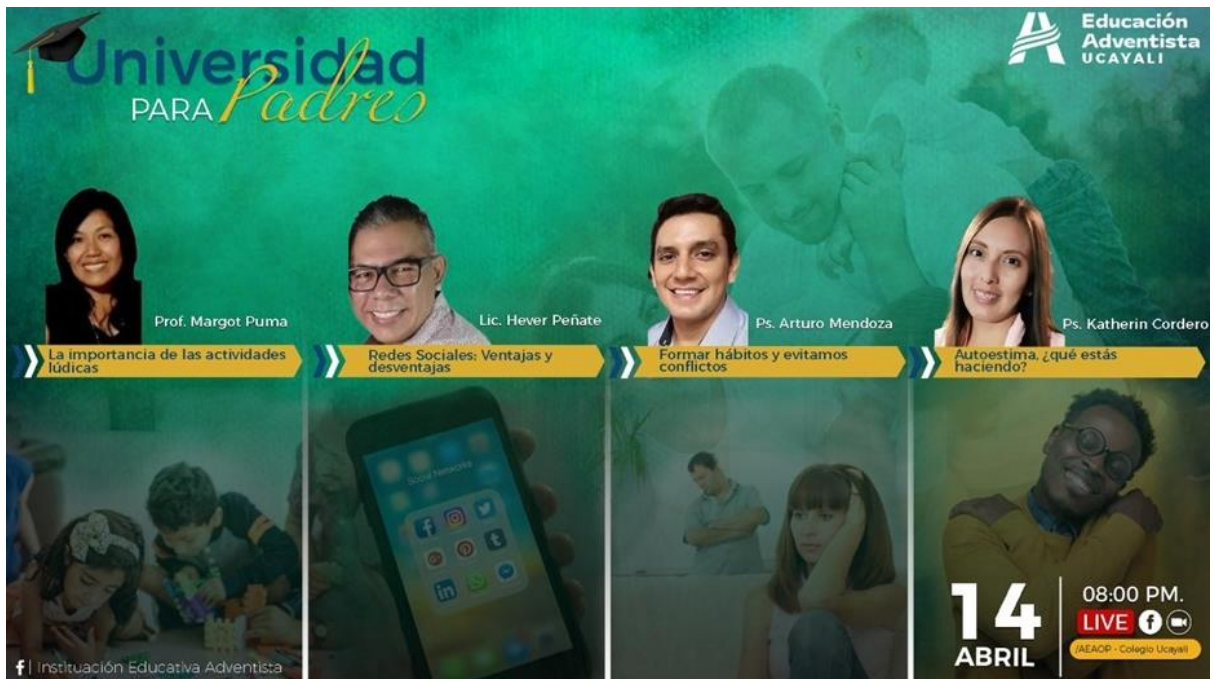
Figura B20. Importancia de las actividades lúdicas.