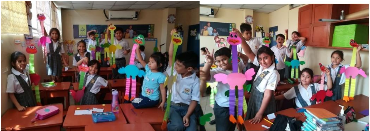
Figura B10. Exposición de trabajos.