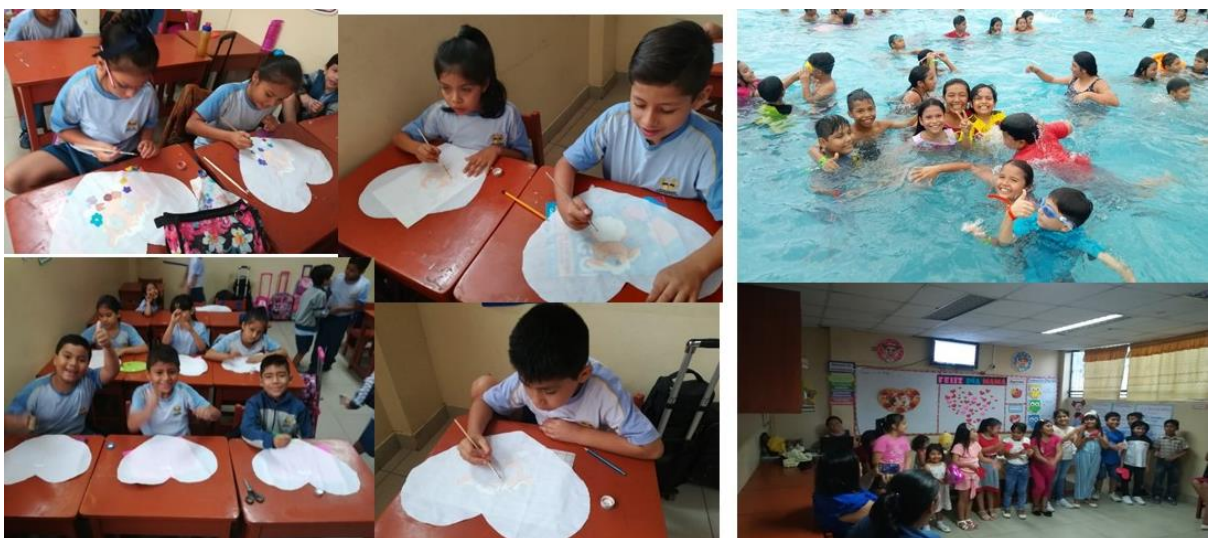
Figura B11. Actividades que fomentan la creatividad.