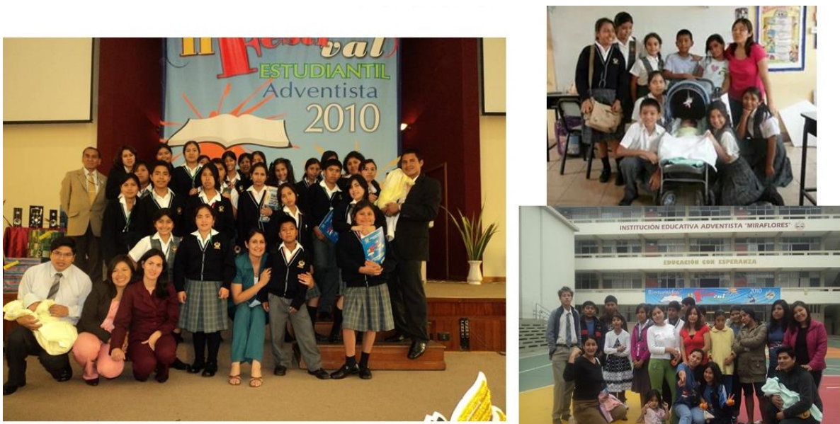
Figura A3. Talento y creatividad con los mapas conceptuales.

Nota: Alumnos del quinto grado de la Institución Educativa Unión Americana de Ica participando del II Festival Estudiantil Adventista 2010 en Miraflores, Lima.