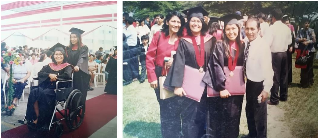
Figura A1. Graduación con honores en el año 2008.

Nota: La graduación tuvo lugar en la Universidad Peruana Unión (UPeU), Ñaña, Lima.