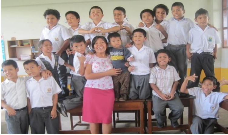
Figura A4. Trabajos en el día del Logro.

Nota: Los alumnos del tercer grado de primaria de la IE Maranatha que participaron de la siembra y cosecha de hortalizas.