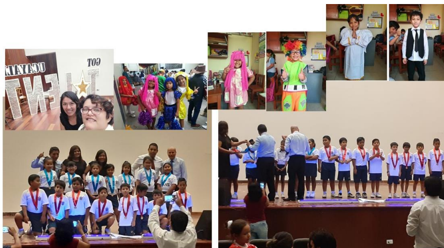
Figura B6. Desarrollando tema de “La Dramatización”.

Nota: Medalla de honor en “Talento Ucayali: Mi Personaje Favorito”.