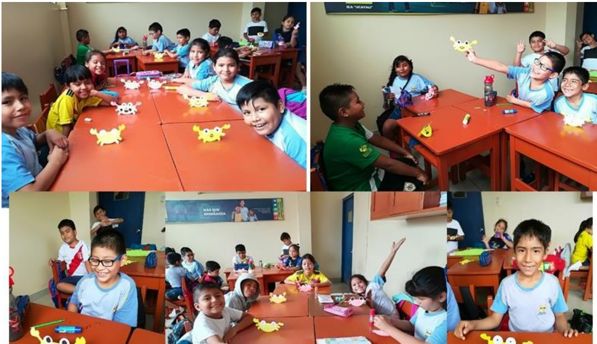
Figura B8. Celebrando el “Día del Logro”.