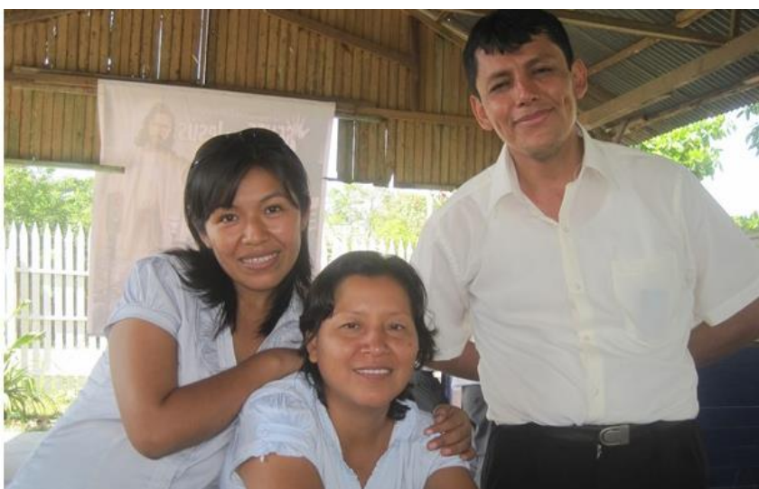
Figura B14. Proyecto de ciencias.