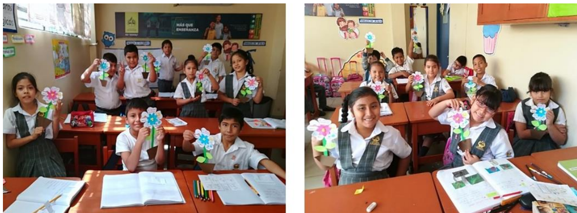
Figura B5. Actividad por “El día de las Madres”