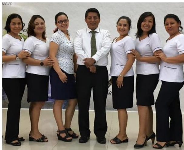
Figura B17. Comisión del proyecto de ciencia 2019.