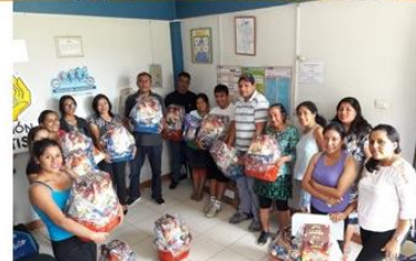
Figura B2. Lanzamiento de matrícula 2019.

Nota: El evento terminó con un evento navideño donde participaron docentes, alumnos y padres de familia.