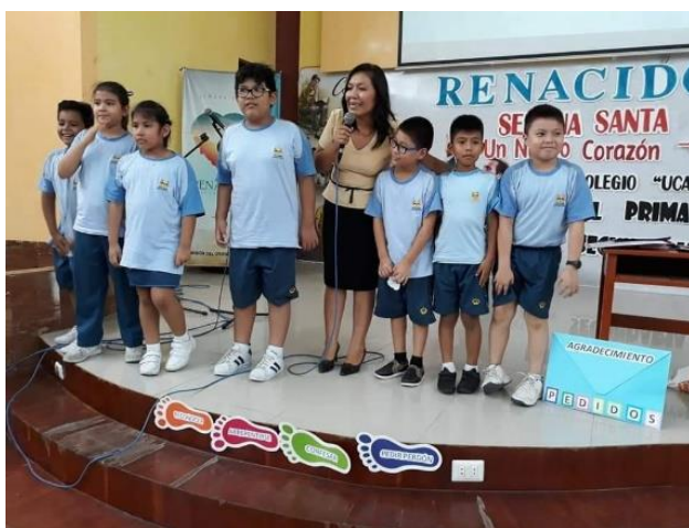
Figura B19. Primera Semana de Oración de niños, nivel primario del IE Ucayali, 2019.