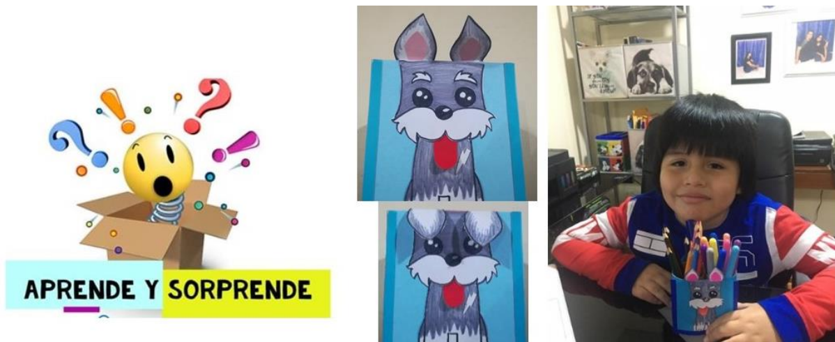
Figura B13. Fanpage "Aprende y Sorprende".