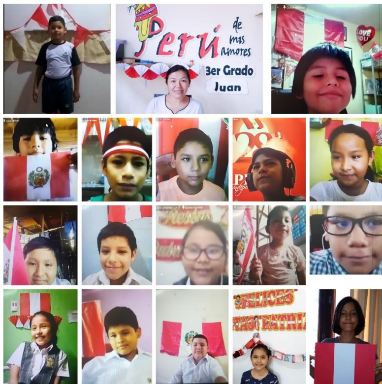
Figura B21. Profesora del tercer grado en el IE Ucayali.