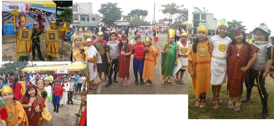
Figura B7. Dramatización “Vivenciando la historia”.