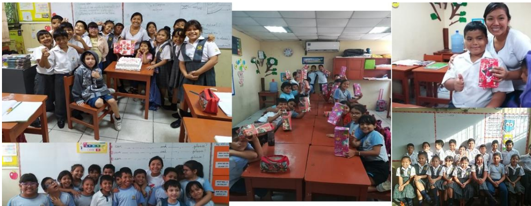
Figura A2. Preparación de postres.

Nota: La graduación tuvo lugar en la Universidad Peruana Unión (UPeU), Ñaña, Lima.