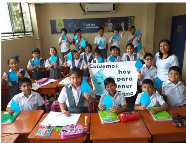
Figura B3. Proyecto “Cuidemos el Agua”.

Nota: El evento terminó con un evento navideño donde participaron docentes, alumnos y padres de familia.