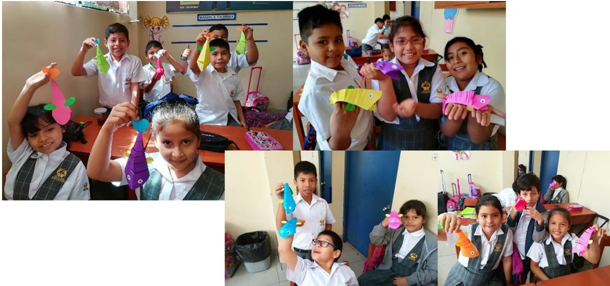
Figura B9. Manualidad: Avestruz con papeles de colores.