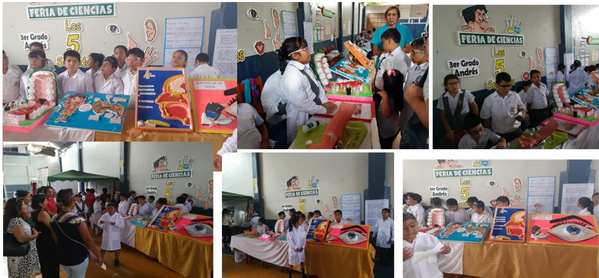
Figura B4. Feria de ciencias.