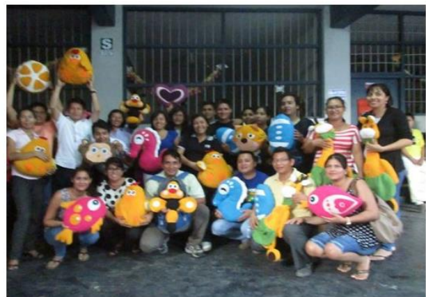
Figura A6. Decoración para salas con espejos o cuadros elaborados con material reciclado.

Nota: Materiales elaborados por los alumnos en el Taller para la vida del Programa de Educación a Distancia (PROESAD) de la UPeU, años 2014 y 2015.