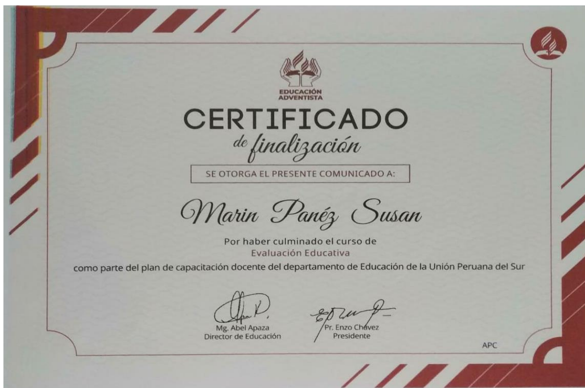
Figura 3. Certificado de curso de Evaluación Educativa

permitió conocer el manejo y elaboración de diferentes instrumentos de evaluación dentro de los formales e informales que se puede aplicar al educando.