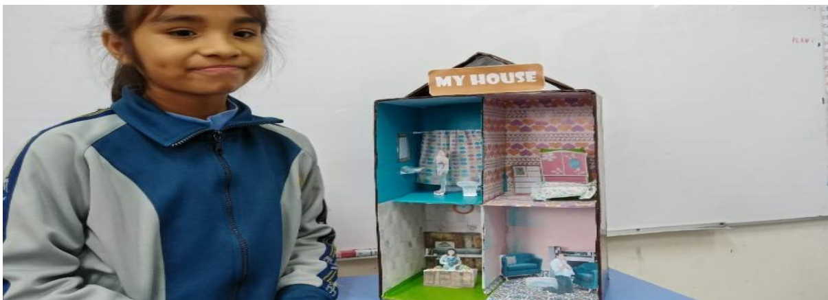
Figura 6. Maquetas de trabajo "My House"