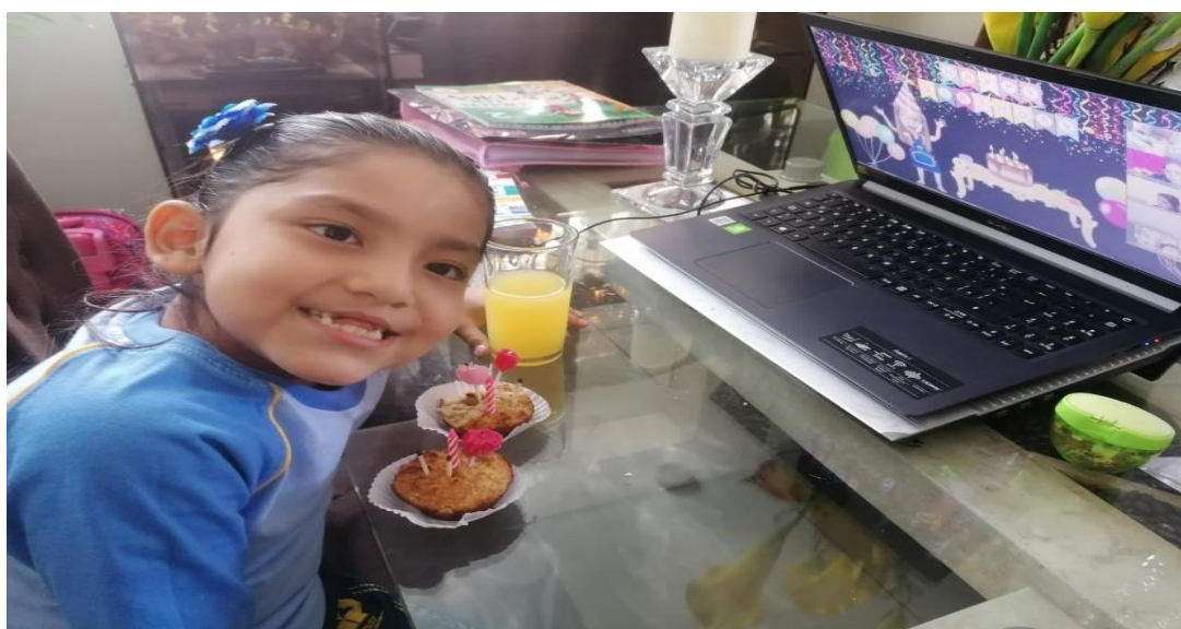
Figura 8. Actividad virtual “How old are you?”