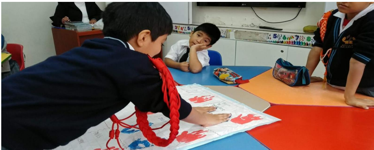
Figura 5. Trabajos grupales "These are my hands"