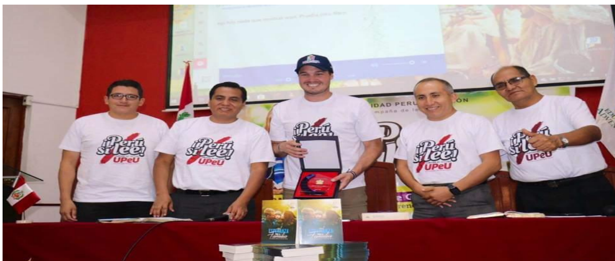
Figura 10. Condecoración al Alcalde como embajador de la campaña de lectura "Perú si lee"

Para finalizar el programa, se hizo las coordinaciones respectivas con el área de recursos humanos del municipio para hacer la entrega de los libros también a todo el personal administrativo. La entrega se llevó a cabo en el auditorio de la municipalidad contando con la asistencia de más de cien trabajadores; a quienes se les hizo una presentación del libro exponiendo de manera puntual su contenido para así despertar el interés en ellos. La municipalidad quedó totalmente agradecida con la institución instando a que se siga promoviendo actividades como las que fueron invitados a participar.