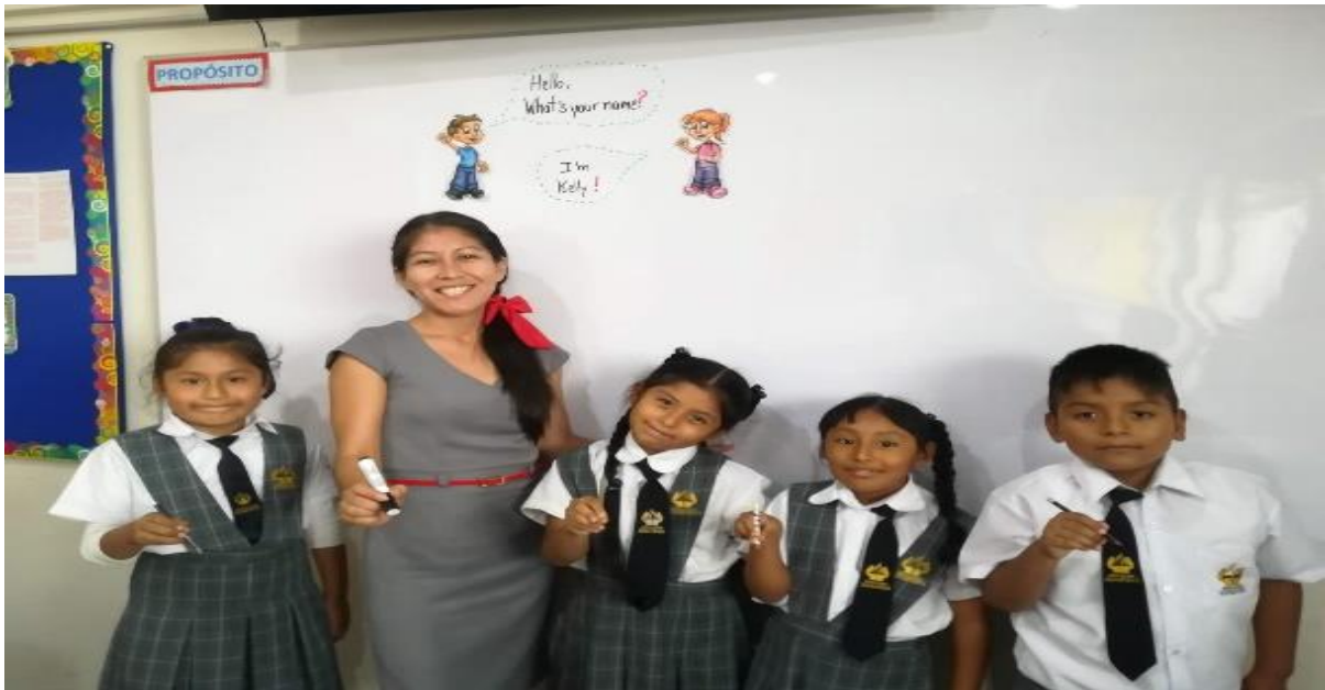
Figura 4. Clase presencial