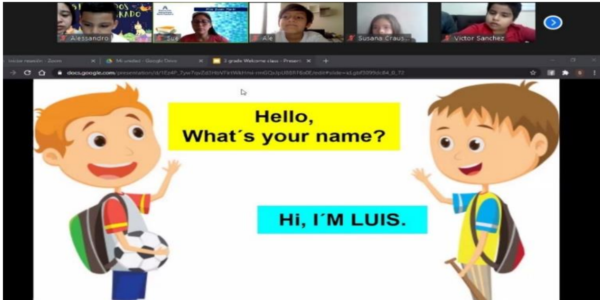
Figura 9. Clase virtual de inglés "Introduce yourself"