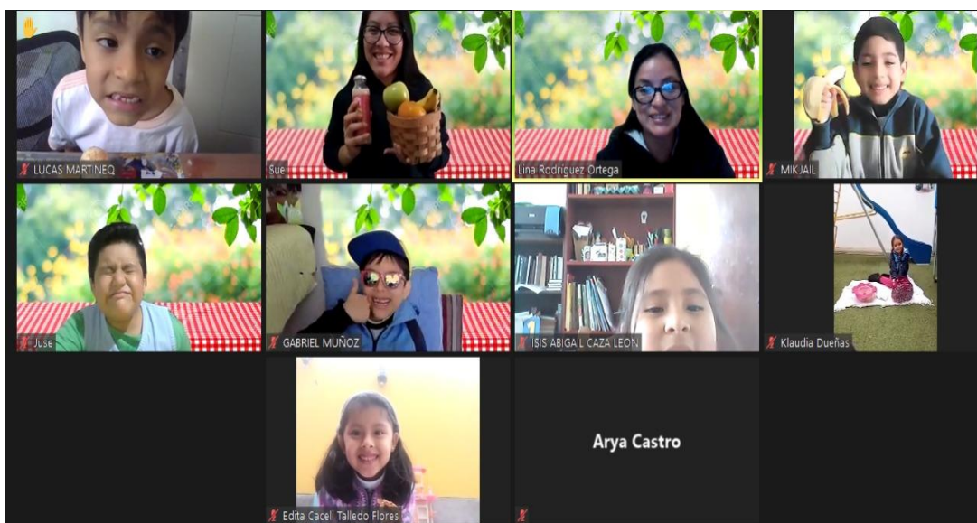
Figura 7. Clase virtual “Picnic On Line”

Lamentablemente el panorama de la docencia cambio en el año 2020 (Kaden, 2020; UNESCO, 2020), de tal manera que adaptó la modalidad virtual, donde se buscaron las formas de adaptar las estrategias y actividades a las clases realizadas a través de la plataforma Zoom, y a la vez generando oportunidades para la comunicación desarrollando las capacidades del área de inglés. También se puede destacar que la modalidad virtual dio acceso a las visitas virtuales nacionales e internacionales, como la visita a zoológicos, acuarios, ciudades y a conocer algunas maravillas del mundo.