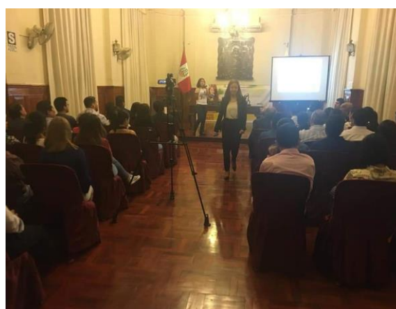
Figura 11. Exposición del libro a los trabajadores del área administrativa del municipio