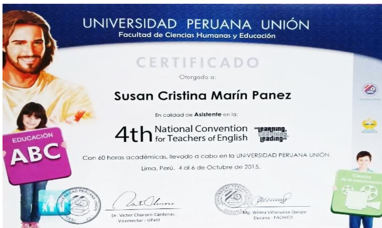
Figura 1. Certificado de 4ta Convención Nacional de profesores de inglés

de la empatía entre maestros y estudiantes; y así estar más prestos a identificar y responder a las necesidades de los alumnos.