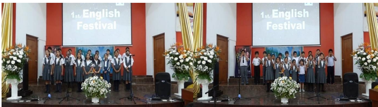
Figura 14. Participación de los estudiantes en el “First English Festival

A finales del año escolar 2019, se implementó desde el área de inglés, el primer festival de inglés “First English Festival”, con la participación de los tutores de aula y profesores de taller. Durante el año se trabajó en las aulas la presentación musical en cada grado, motivando la participación de todos los alumnos sin excepción alguna, los niños mostraron buena disposición al saber que participarían del festival, un evento dirigido para toda la escuela y padres de familia. Semanas antes al evento se hicieron ensayos previos con todas las aulas dentro y fuera del horario de trabajo, en donde como número central se presentó una escenificación de una historia bíblica. El evento fue dirigido por los mismos estudiantes, para ello, se les dio a los estudiantes un papel protagónico y al maestro el rol de mentor y monitor, acompañando antes y durante la actividad.