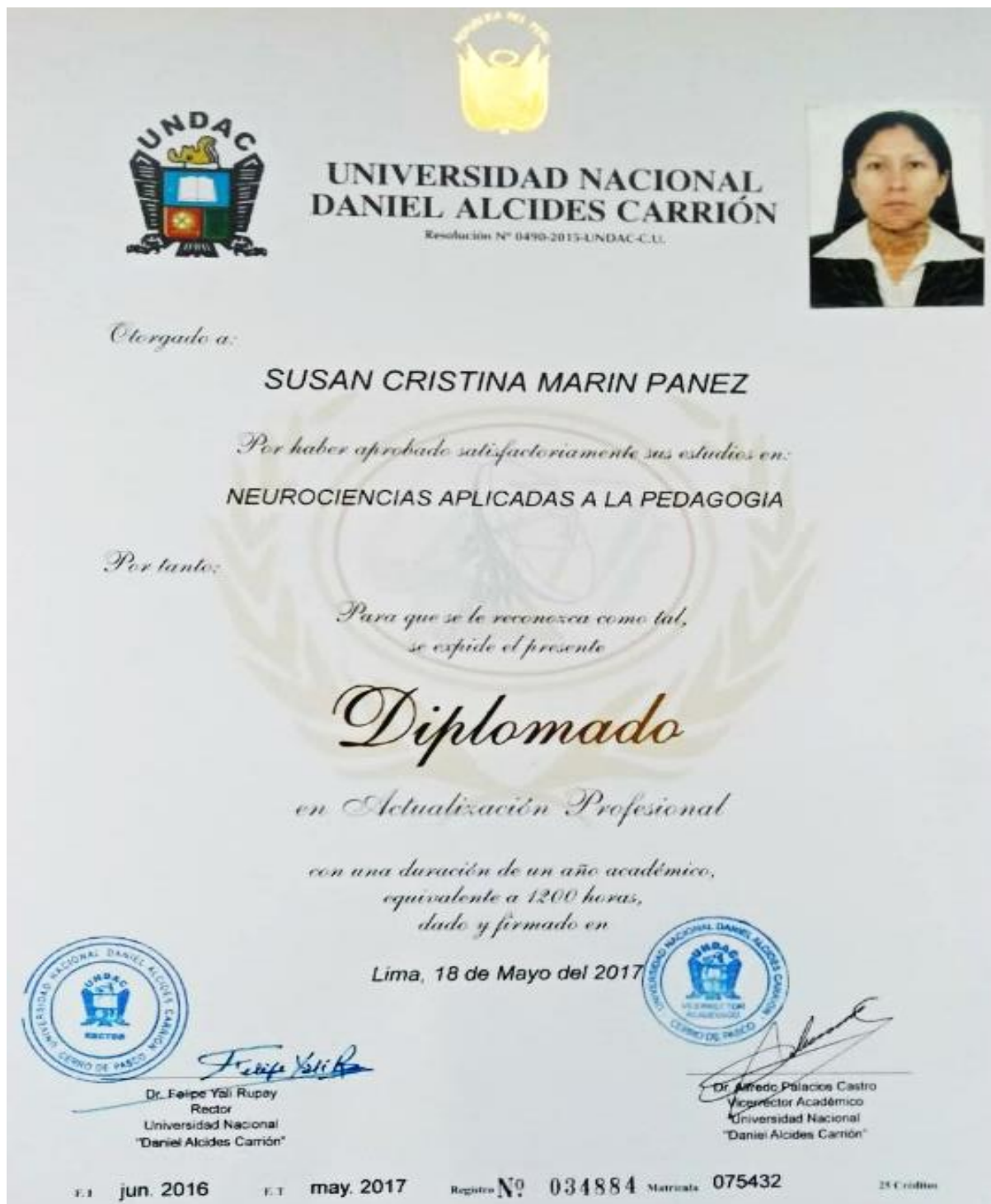
Figura 2. Diplomado en Neurociencias Aplicadas a la Pedagogía

En los siguientes años, la bachiller se mantuvo en su cargo desempeñando el rol de docente. Para la planificación y ejecución de las actividades extracurriculares y pedagógicas, la institución educativa se organiza mediante equipos de trabajo o comisiones, de las cuales la