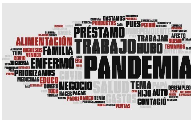
Figura 1 Palabras más frecuentes

Contamos con un grupo de los clientes morosos que se auto educan, generalmente ellos trabajaban medio tiempo y medio tiempo estudian o en las vacaciones obtenían ingresos en diferentes actividades, emprendían o trabajo dependiente, también colportaban y se dio el caso que no terminaron sus labores por el estado de emergencia y se contagiaron de la Covid-19 y tenían que llevar tratamiento y no pudieron conseguir más recursos económicos para realizar sus pagos a tiempo con la universidad. La situación financiera de los clientes morosos de acuerdo a las entrevistas menciona que en el 2020 se sintió que les afectó en gran manera, pero poco a poco se están restableciendo.