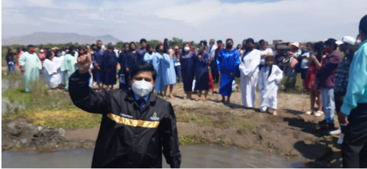
Anexo 10: Nueva iglesia plantada y construida en plena pandemia