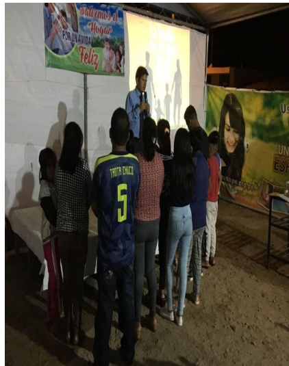
Anexo 9: Nuevos bautismos después de la campaña