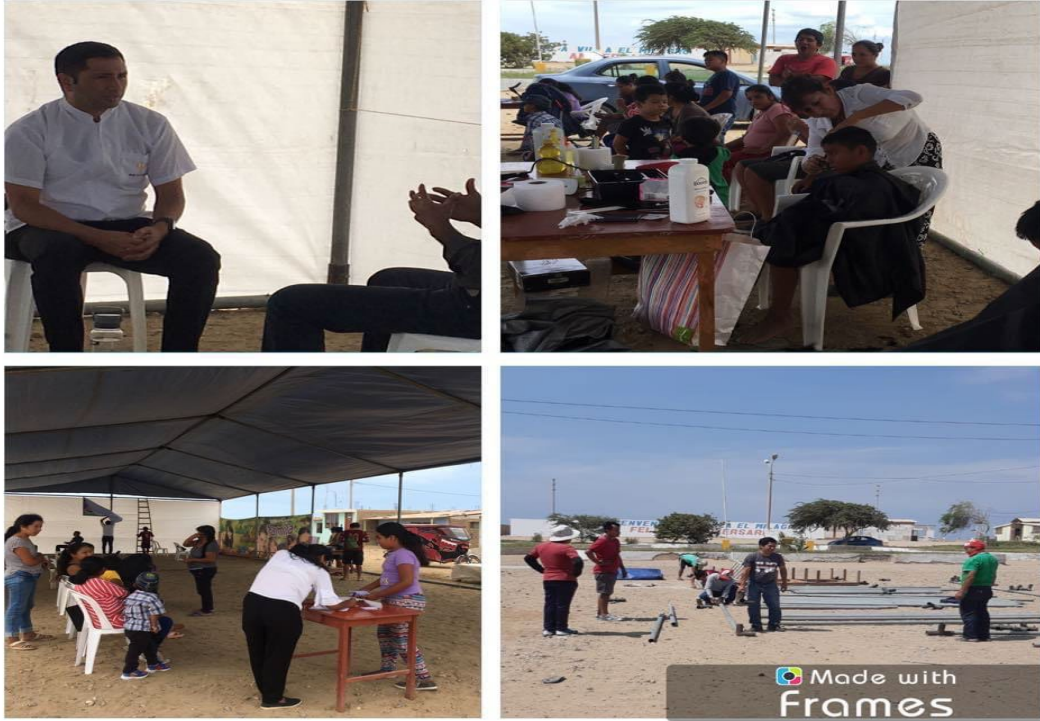
Anexo 8: La campaña evangelística en la carpa por las noches