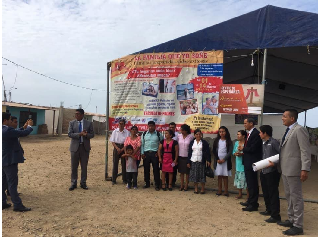
Publicidad volanteo y perifoneo de casa en casa, Anexo 6