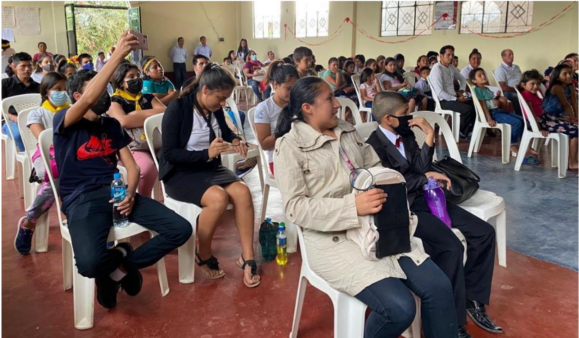
Foto 10: Personas entregando su vida a Dios a través del Santo Bautismo