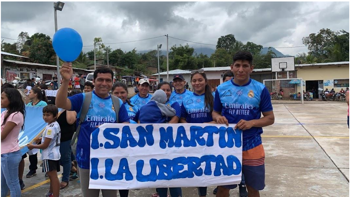
Foto 12: Formación del Núcleo para la organización de la iglesia Llunchicate