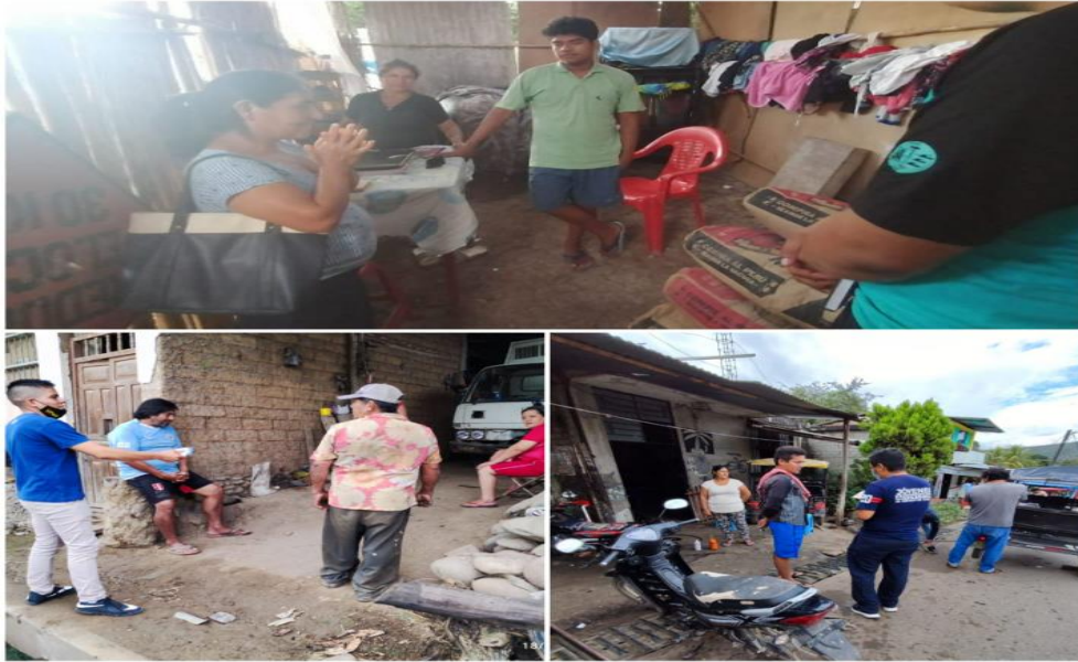
Foto 7: Distribución de libros misioneros en los diferentes centros de Evangelismo