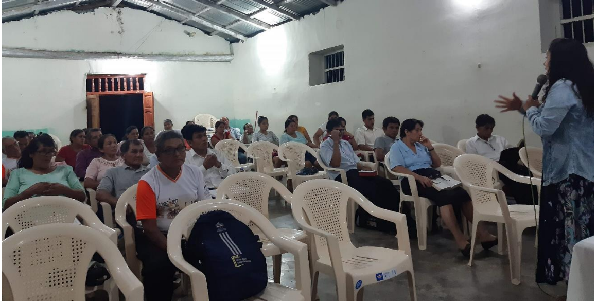
Foto 3: Retiro Espiritual con las Directivas de Jóvenes y ayuno de 10 horas