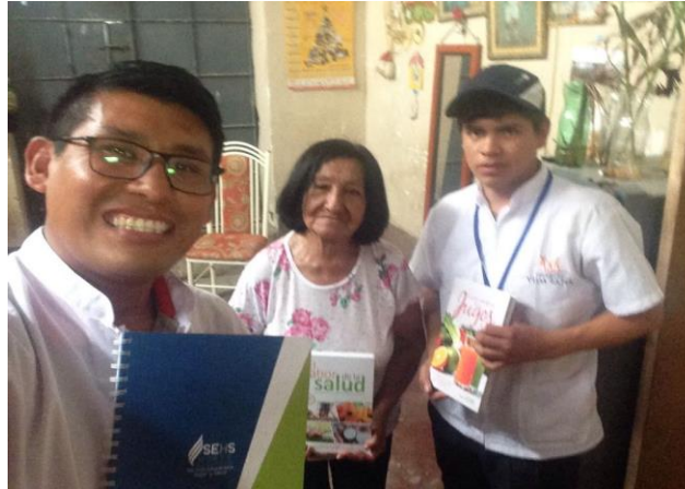
Anexo 6 – Formato de seguimiento correcto de los pasos de una presentación en la asistencia.