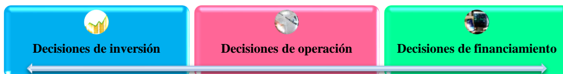
Figura 4: Actividades de las decisiones financieras.

Nota: Datos extraídos de la aplicación de guía de entrevista.