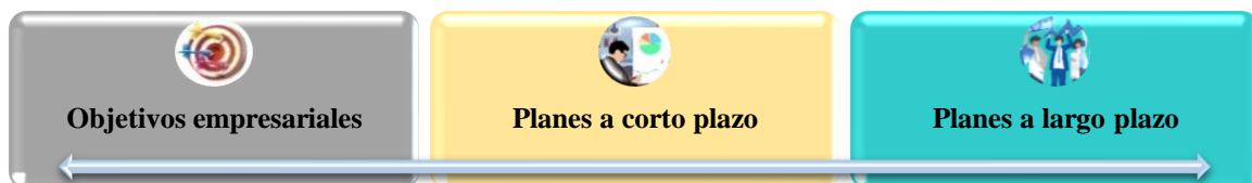
Figura 1: Actividades de los planes operativos.

Nota: Datos extraídos de la aplicación de guía de entrevista.