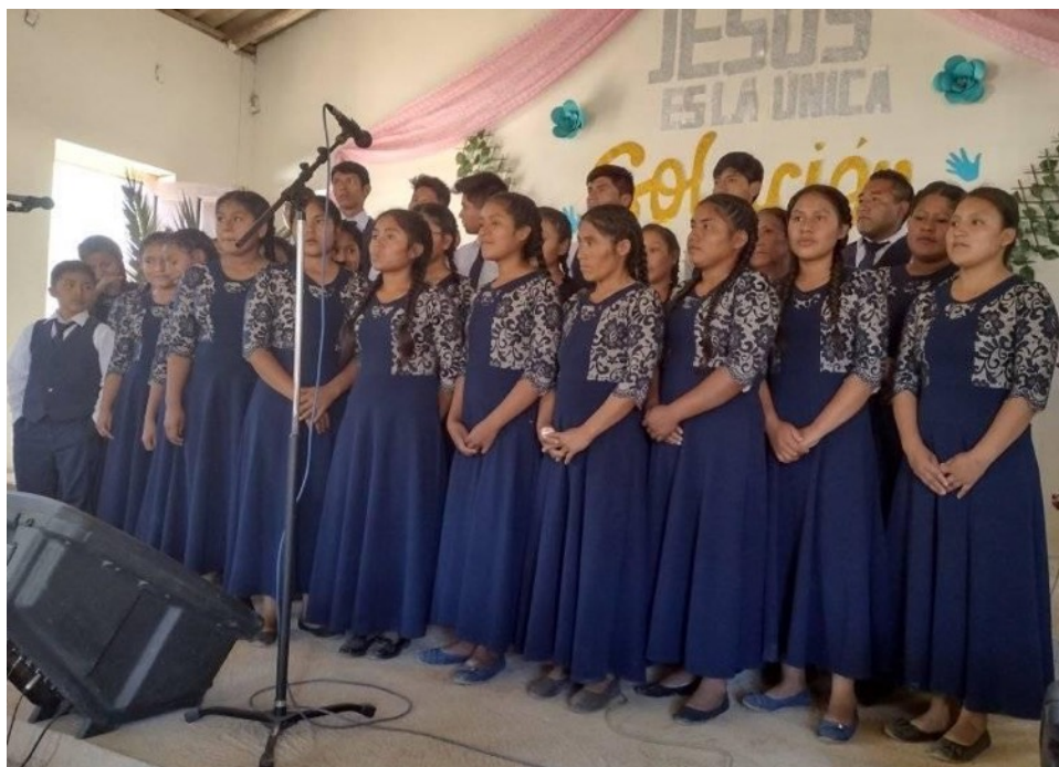
Coro IASD La Victoria