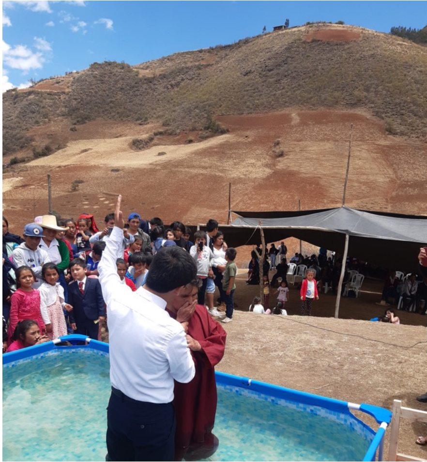
Campaña en la IASD La Victoria. Entregaron sus vidas a Cristo 12 almas.