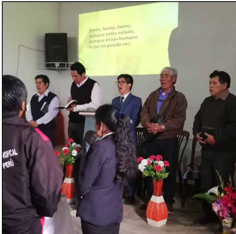
En dicho encuentro la iglesia participó de la cena del Señor.