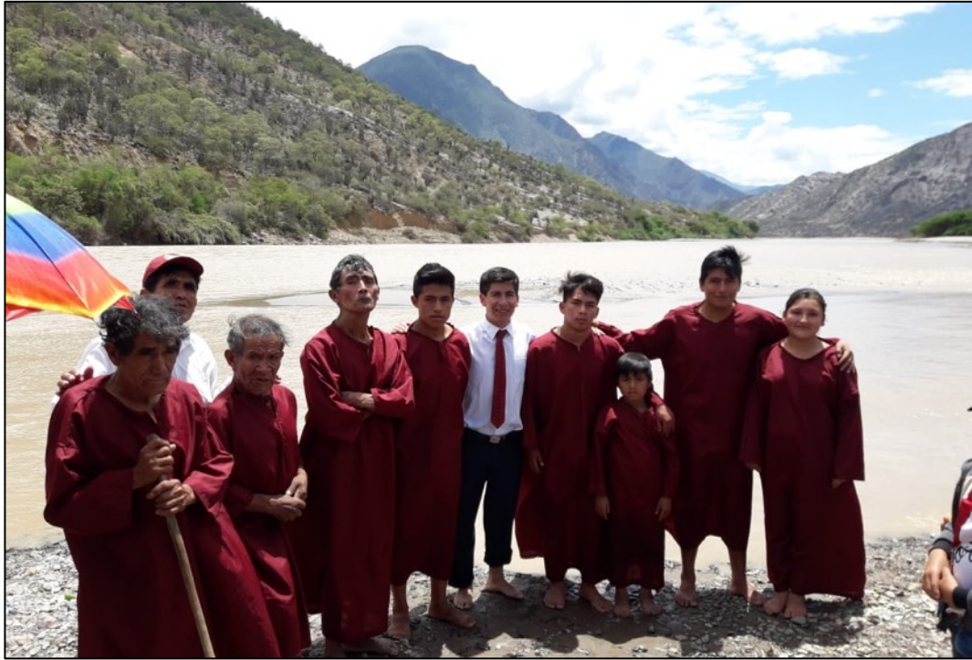
Anexo 9. Aniversario IASD La Victoria