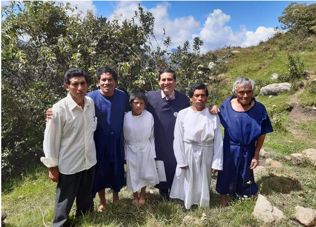
Bautismos en la iglesia Monte de los Olivos