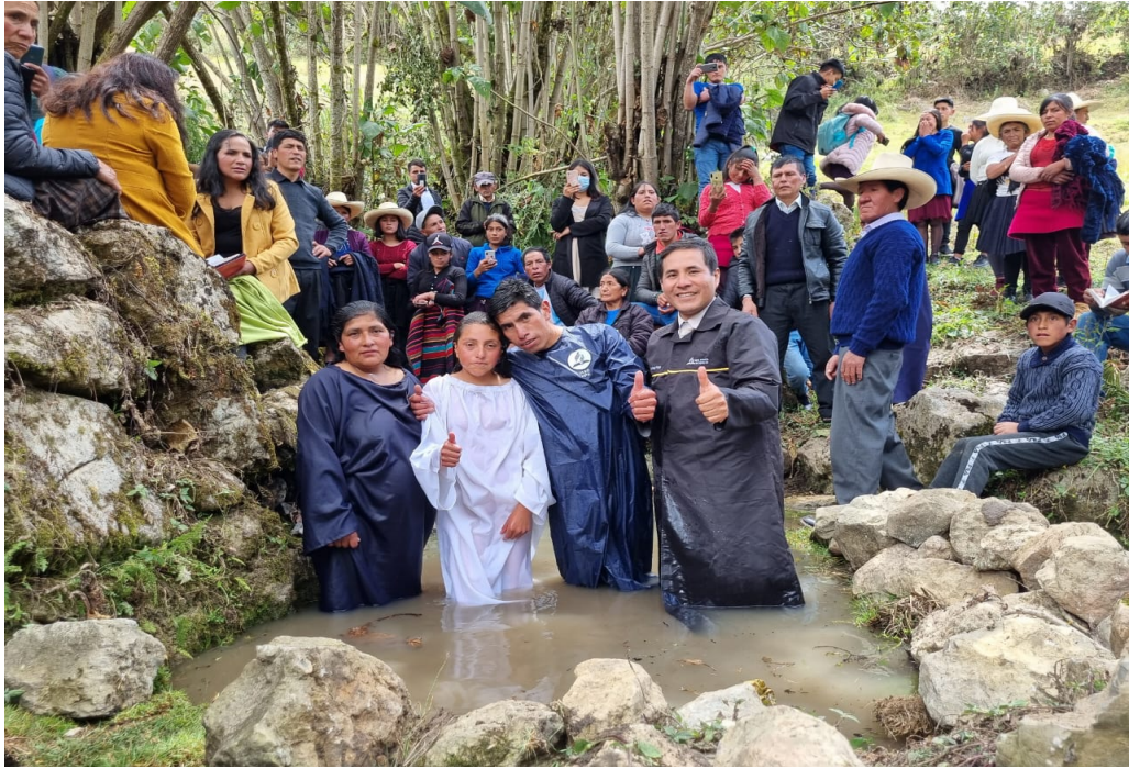
Bautismos en la Caravana de la Esperanza 2022