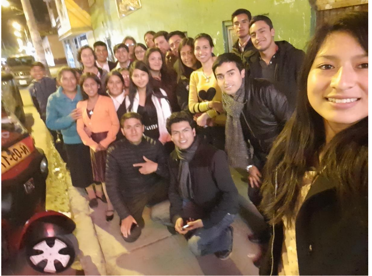
Capacitación y entrega de materiales a los líderes