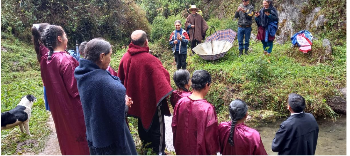
Personas entregando su vida a Jesús a través del bautismo.