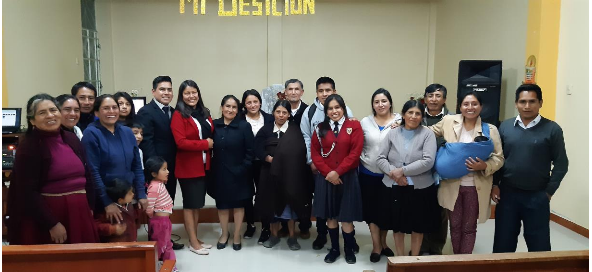
Reconociendo a los hermanos de las diferentes Iglesias y comprometiendo a cumplir la misión.