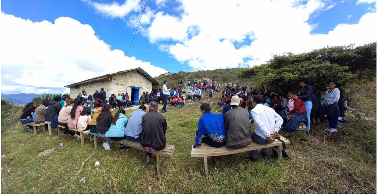
capacitaciones a los líderes y hermanos de las diferentes zonas