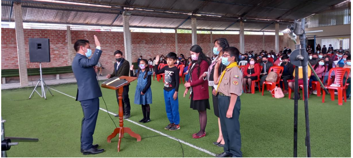
Más personas uniendo sus vidas a Cristo