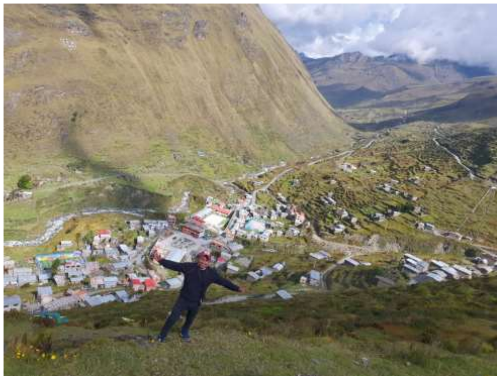
Vista fotográfica de la Comunidad Campesina de Untuca