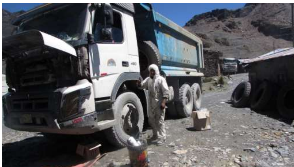
Volquetes de la Comunidad Campesina de Untuca