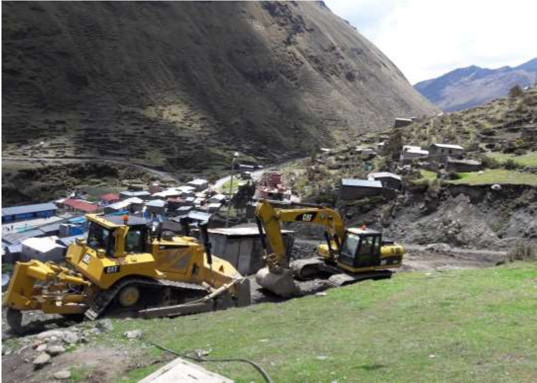
Maquinarias de la Comunidad Campesina de Untuca