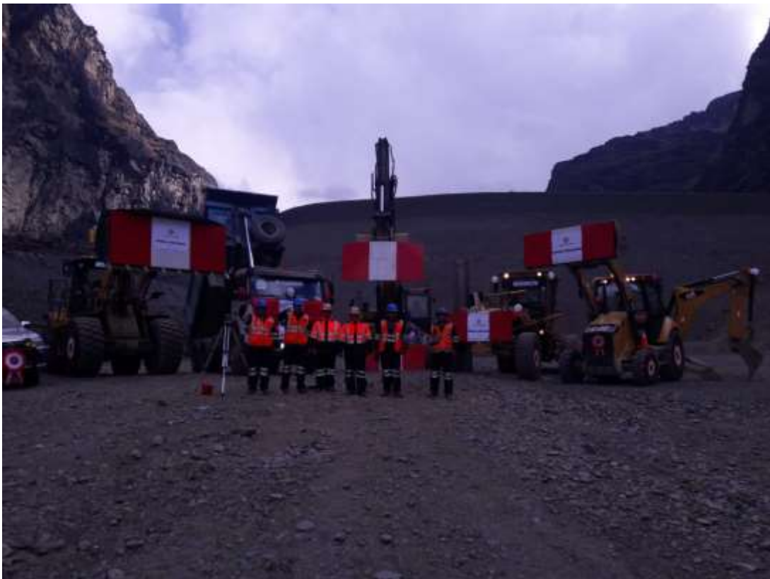
Maquinarias de la Comunidad Campesina de Untuca