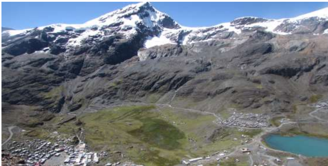
Vista fotográfica de la Comunidad Campesina de Untuca

aumentara la capacidad de la empresa para reunir capital internamente y mantener el crecimiento a lo largo del tiempo.