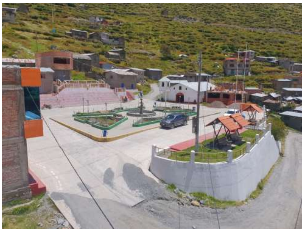
Plaza de Armas de la Comunidad Campesina de Untuca