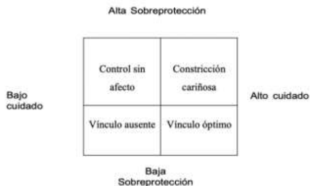
Distribución de vínculos parentales según la sobreprotección y cuidado