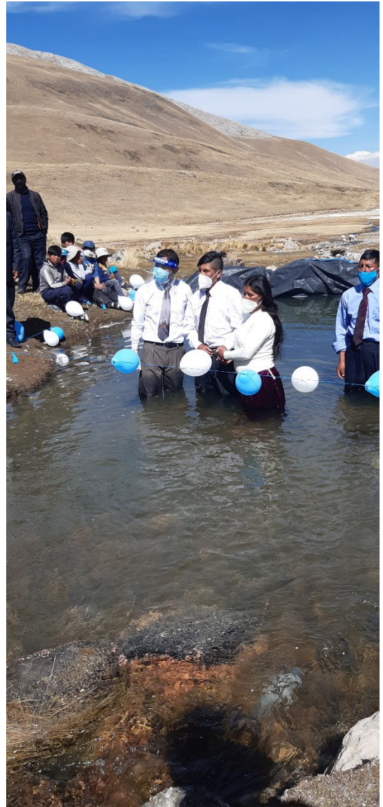
Mas bustimos de las zonas alejadas de Crucero de la iglesia de Phara