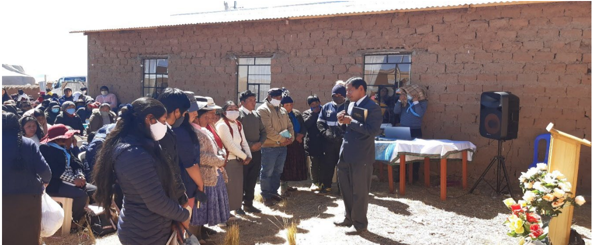
Se abre nuevamente la iglesia de Bethel después de años con nuevos candidatos al bautismo