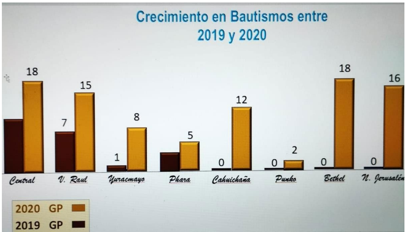
Crecimiento en bautismo de iglesias y grupos