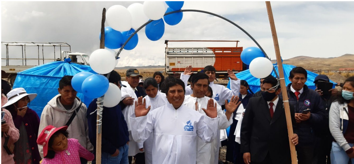
Reunión de nuevos jóvenes por el trabajo misionero y los bautismos de Aricoma