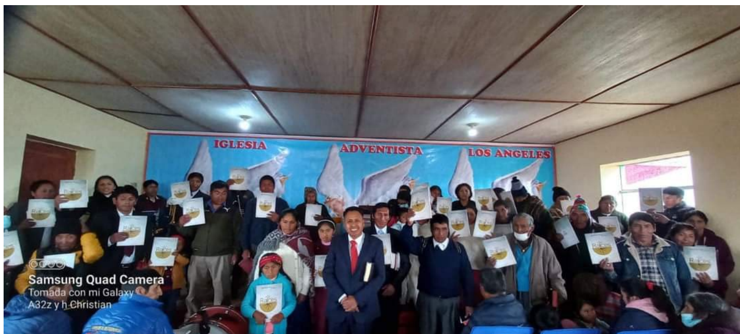
Capacitación de mayordomía por nuestro departamental