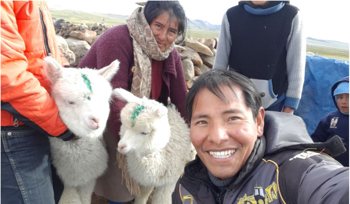
Visita y reunión de coordinación de la iglesia de Yuracmayo