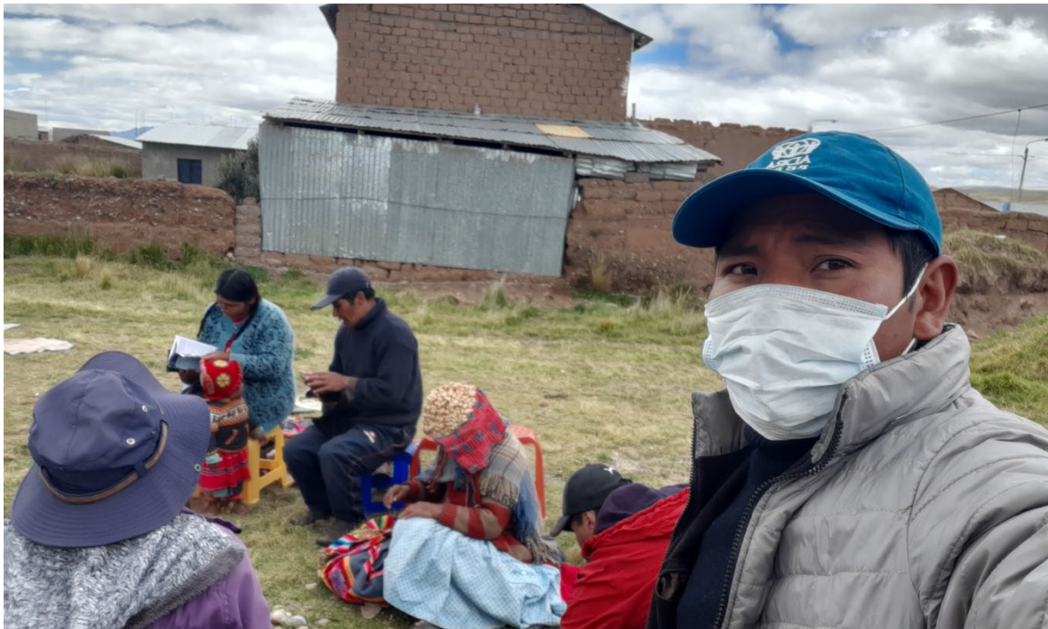
Bautismo y visitas en pleno estado de emergencia por el covid