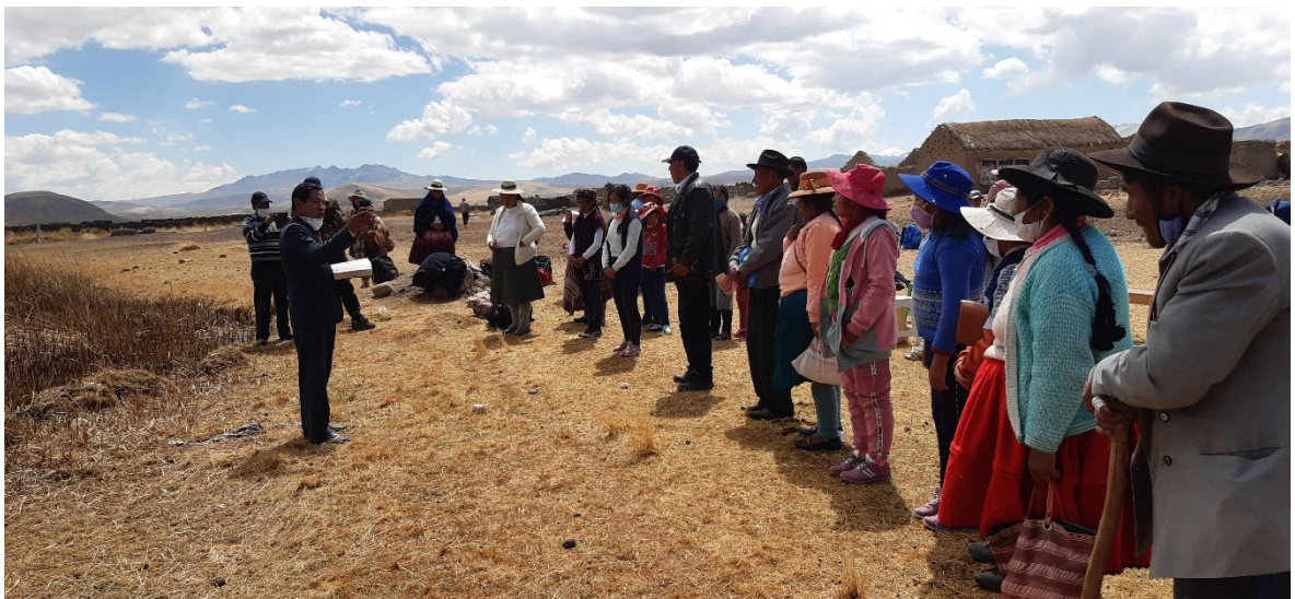
Candidatos al bautismo de la iglesia de Potoni