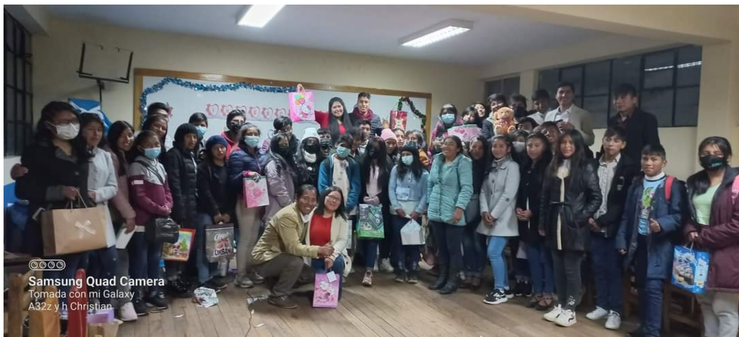
Después de haber terminado Caleb se entregaron premios por su arriesgada participación