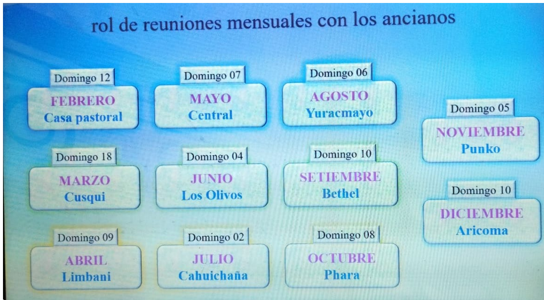
Cuadro de las reuniones mensuales para un mejor trabajo pastoral