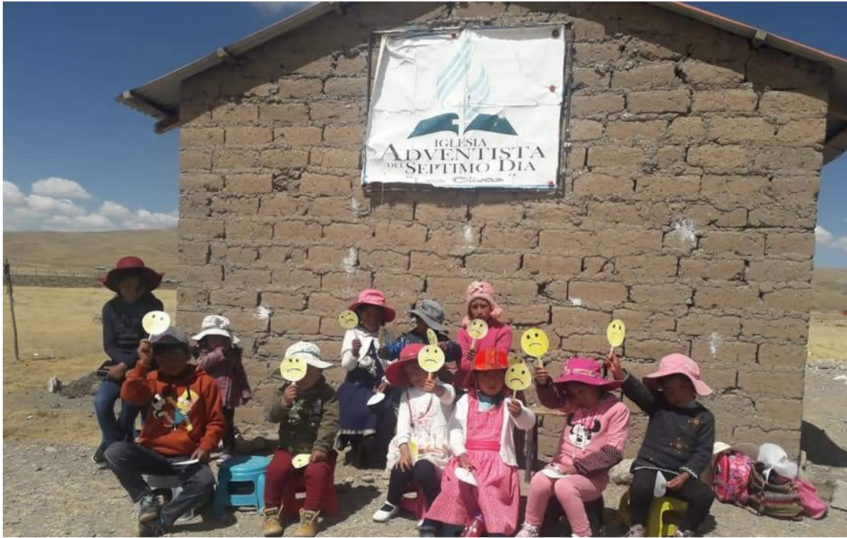
Una iglesia se vuelve abrir después de 15 años de estar cerrado