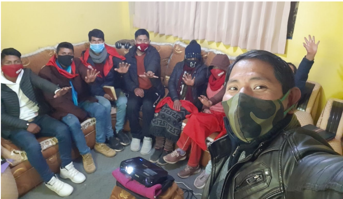
Bautismo y grupo pequeño de JA coordinación de semana santa