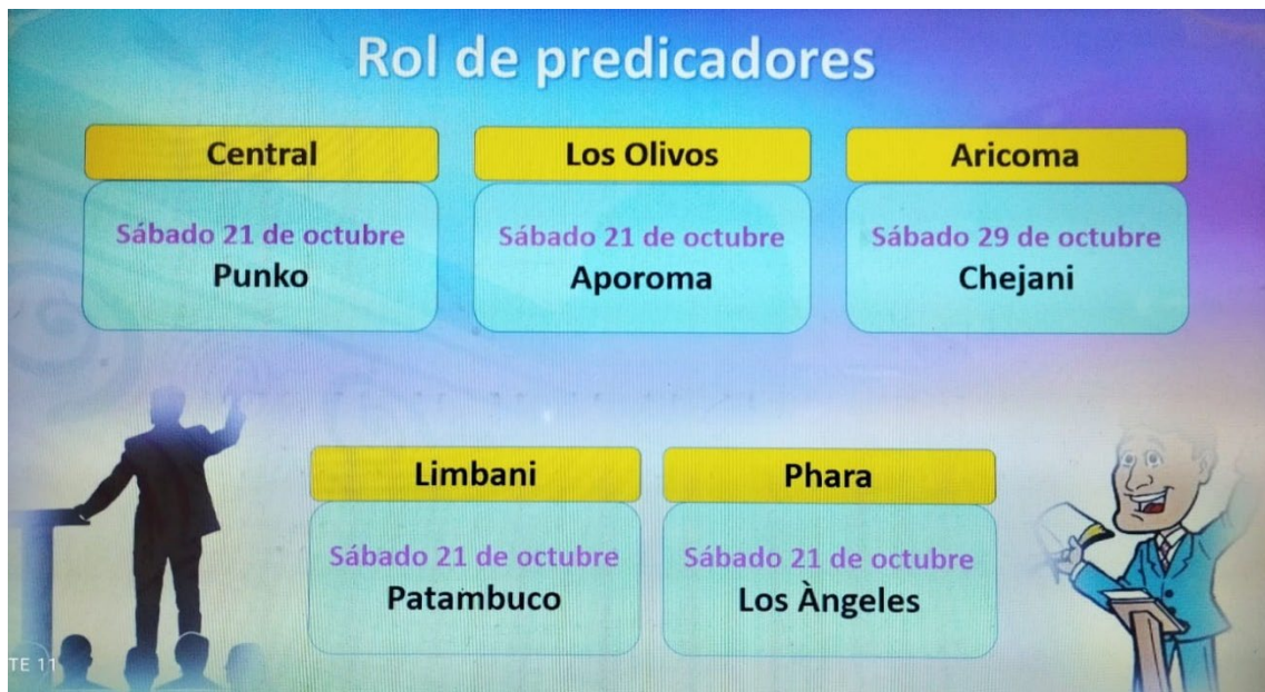
Cuadro de predicadores que los ancianos salen a predicar a las iglesias del distrito