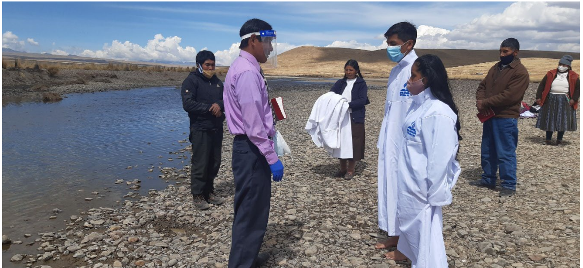
Bautismo de la iglesia Luz y Vida