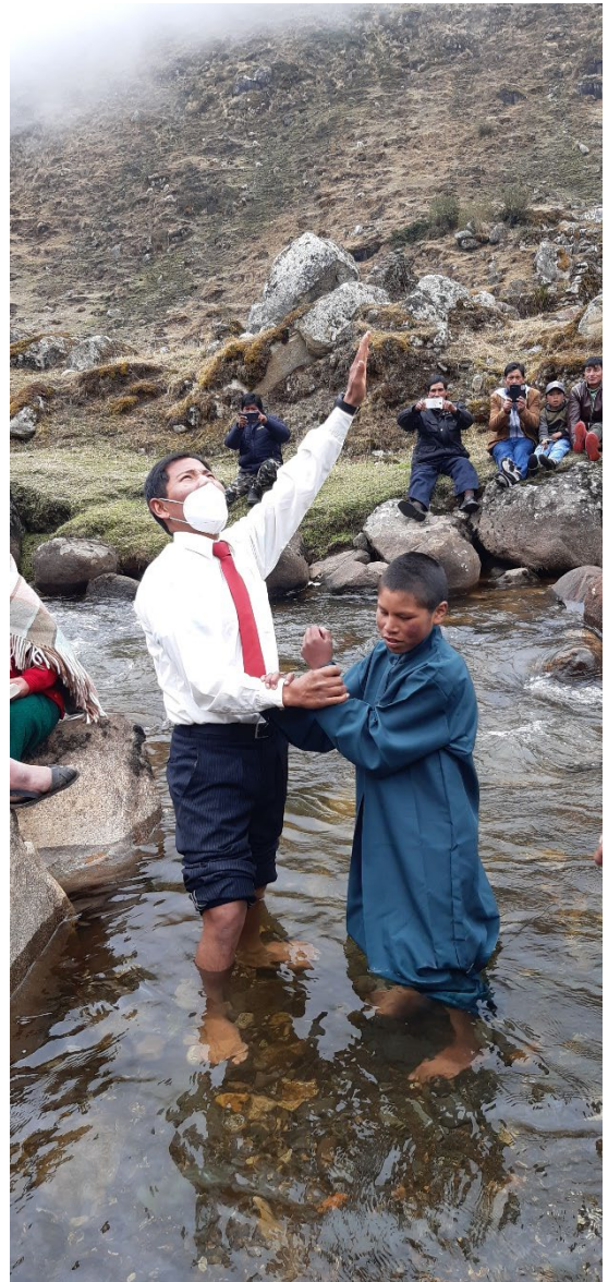
Bautismo de la iglesia de Cusqui una zona alejada de Crucero