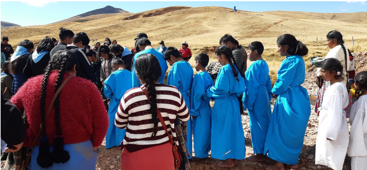
Candidatos para el bautismo de las iglesias de Patambuco y Yuracmayo