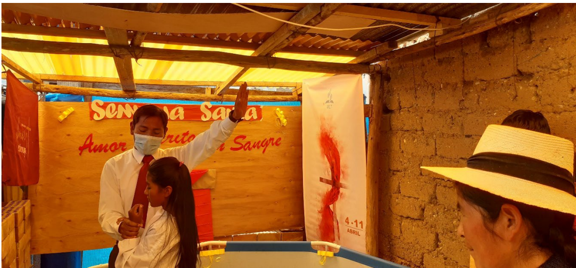
Bautismo en la casa pastoral