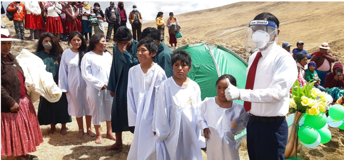
Mas personas para Cristo de las de Los Olivos y Luz y Vida