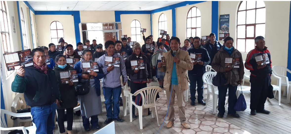
Reunión de líderes de la iglesia de Punko y Patambuco