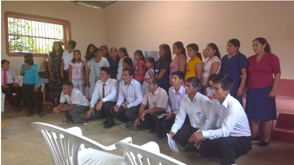
Anexo. Organización del G.O. Estrella Divina