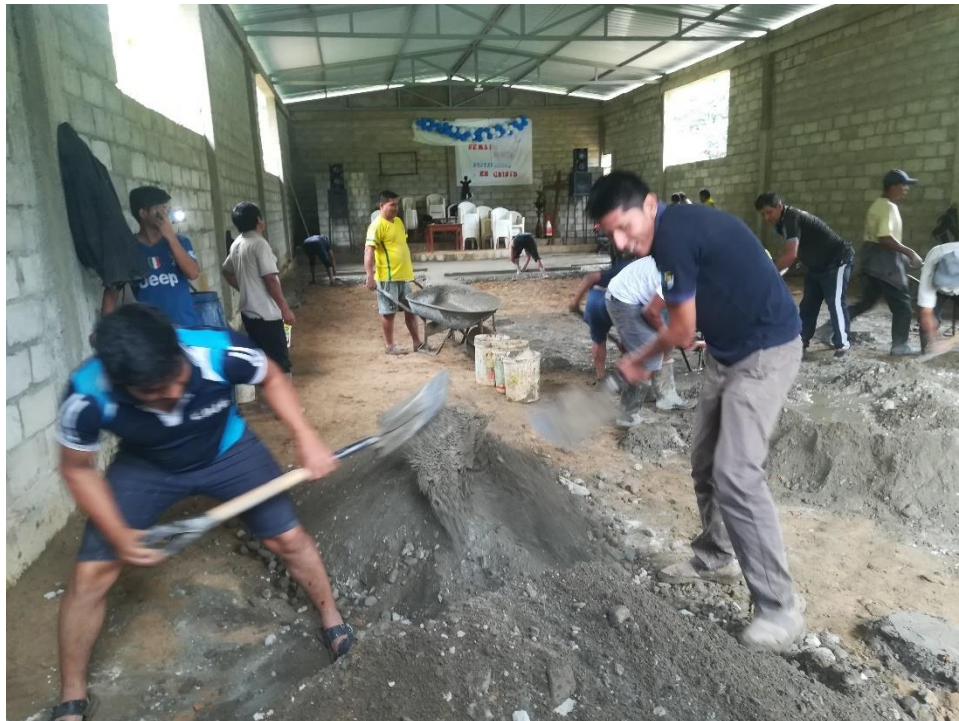
Anexo. Vecinos de la Bermeja se une para construir nuevo templo adventista