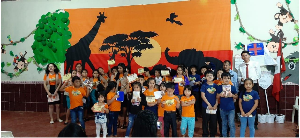
Anexo. Previo a la pandemia, la ECV en Panchía Central