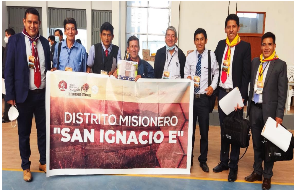
Anexo. Organización del Distrito Misionero San Ignacio "E", Congreso Ordinario MPN