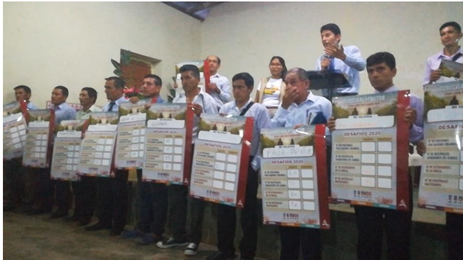
Anexo 8. Capacitación distrital y desafíos para el próximo año 2020