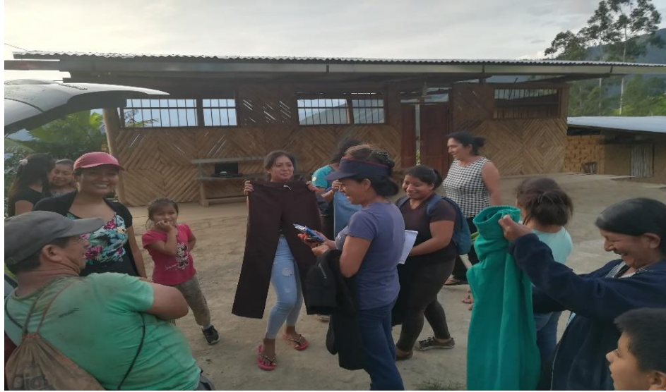
Anexo 7. Semana Siembra en G.P.