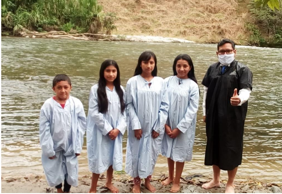
Anexo. Frutos de las campañas evangelísticas vía radio FM, San Pedro