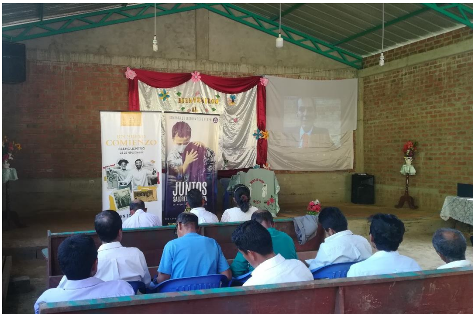
Anexo. Sábado de Capacitación Misionera y Vigilia de líderes distrital