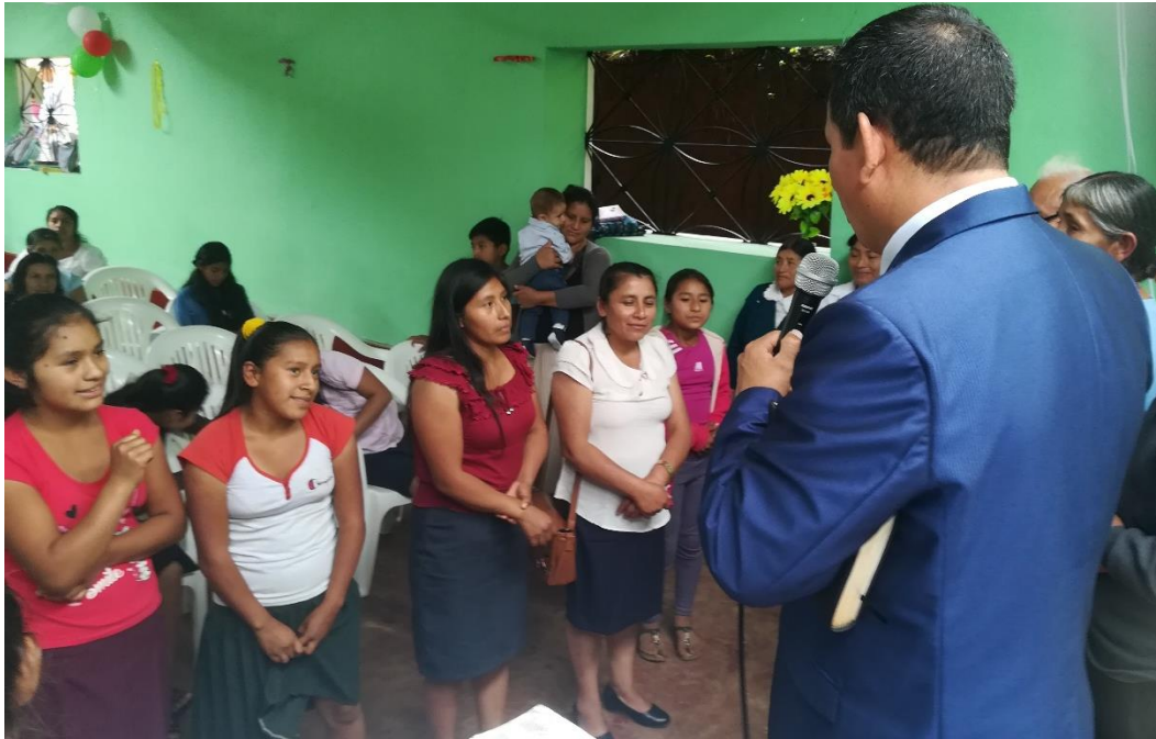
Anexo. Organización de la Iglesia “La Palma Churuyacu”