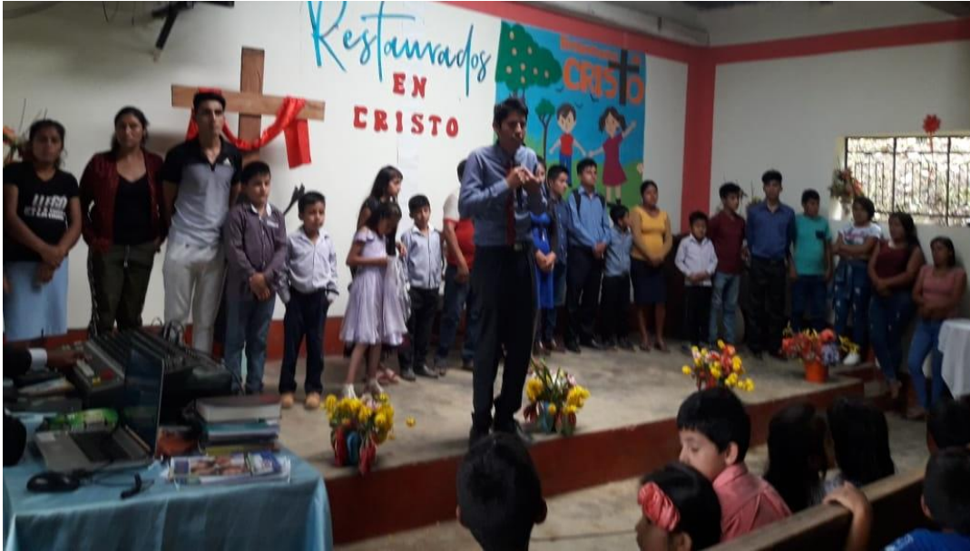
Anexo. Cosecha de Semana Santa 2021, 100 bautismos hasta allí.