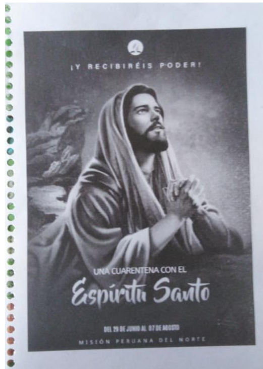
Anexo. Libro repartido a todas las familias del distrito, 40 madrugadas.