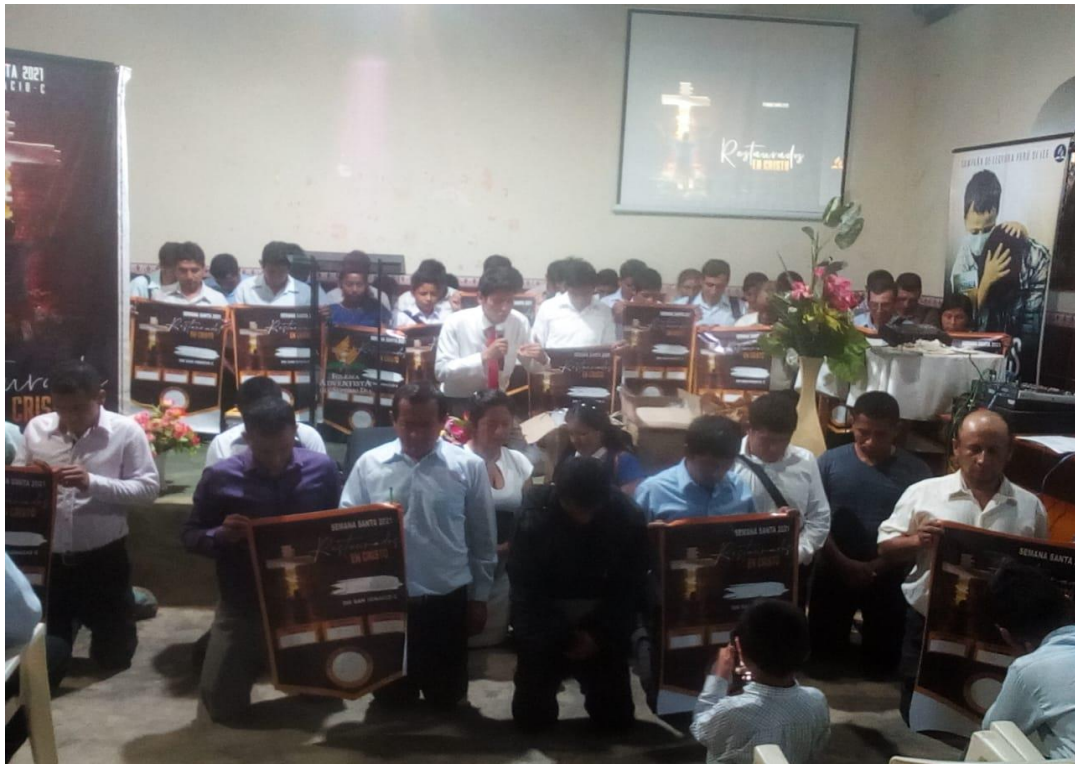
Anexo. Compromiso misionero para el 2021 rumbo a los 300 nuevos bautismos