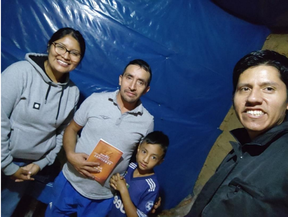
Anexo. Visitas a líderes de iglesia.