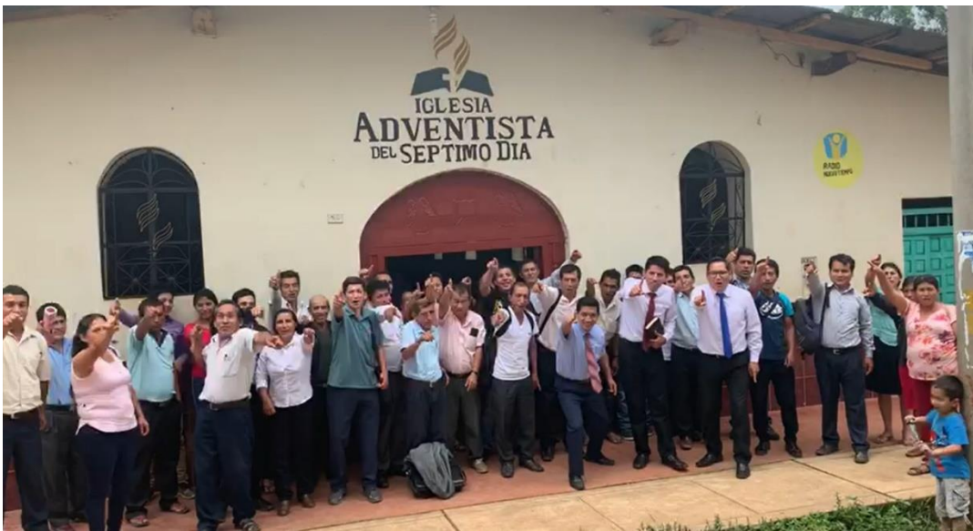
Anexo 10. Capacitación Evangelistas 2020