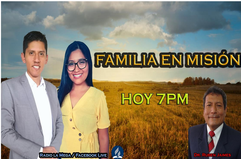
Anexo. Programa radial “Familia en Misión” – viernes 7-8pm