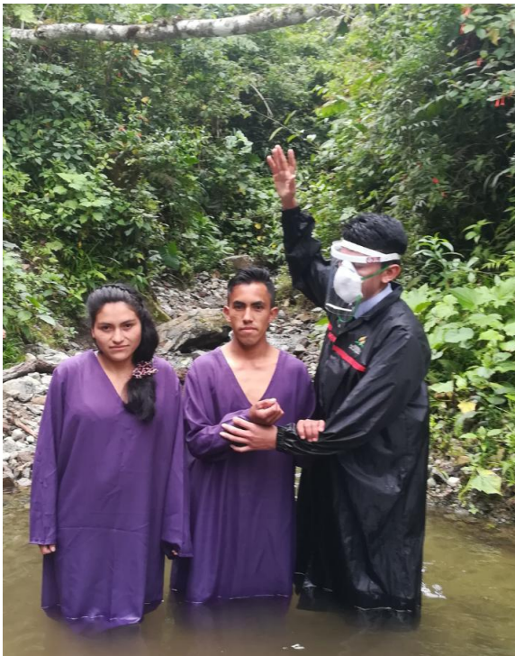
Frutos de las campañas evangelísticas vía radio FM, Flor de Selva