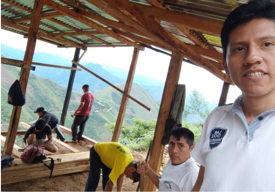
Anexo. Construcción de vivienda para familia abandonada, Flor de Selva