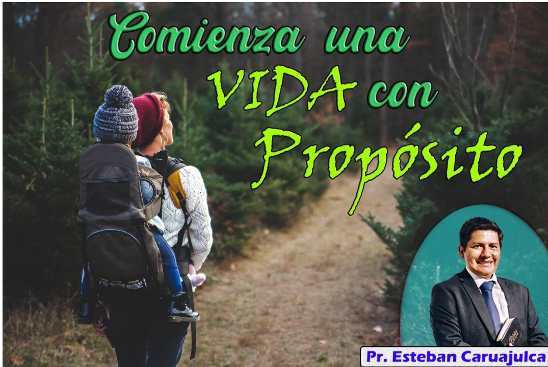
Anexo. Campaña Evangelística Radial Tabaconas