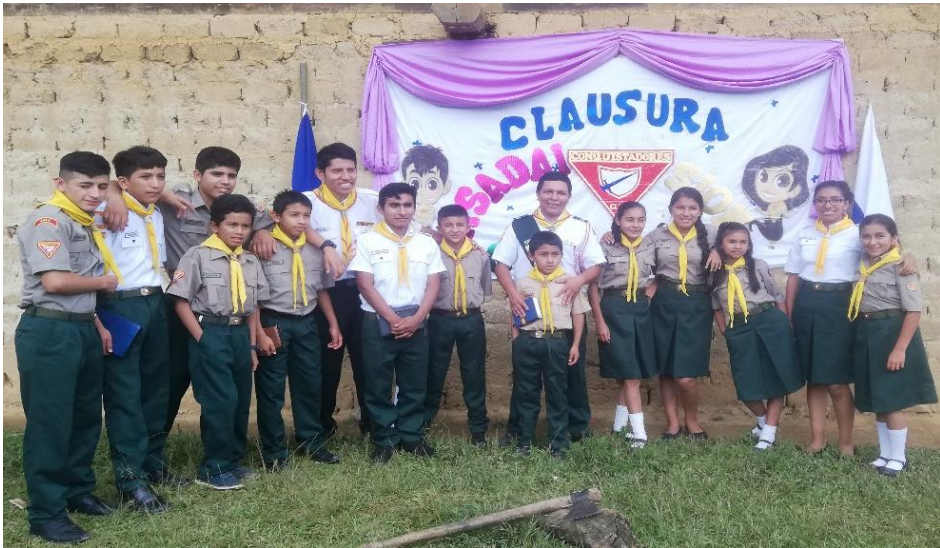
Anexo 9. Clausura de los 3 clubes de conquistadores del distrito