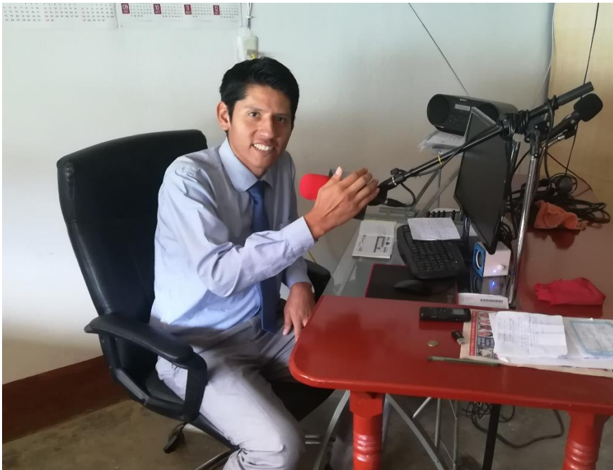
Anexo. Programa radial “Biblia Fácil” – Domingos 7-8pm