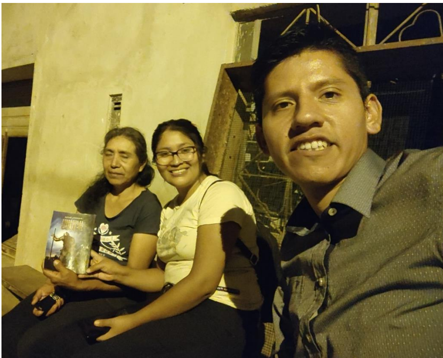
Anexo. Visitas, repartiendo siguiente jornada espiritual