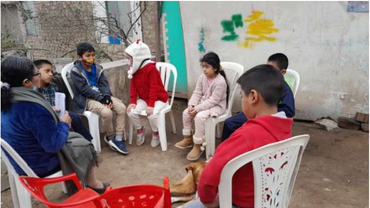
Anexo 2 clase de infantes