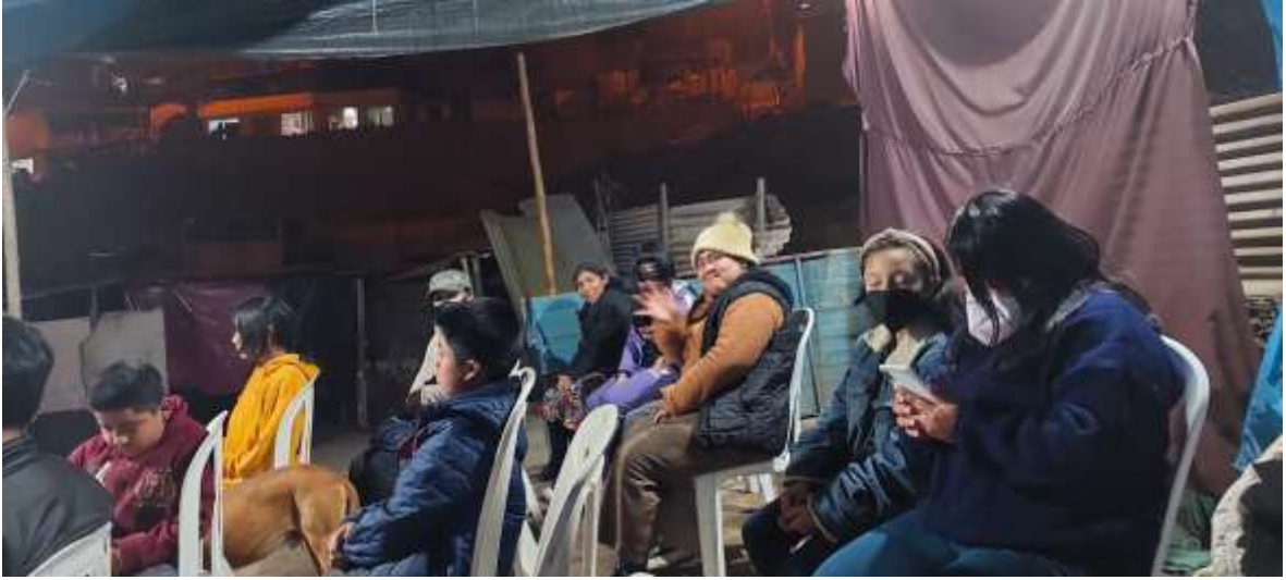
Anexo 1 comienzo del plantio