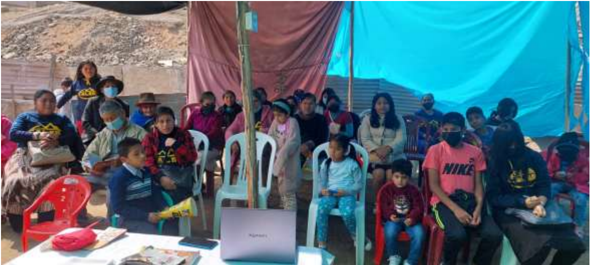
Anexo 5 culto divino