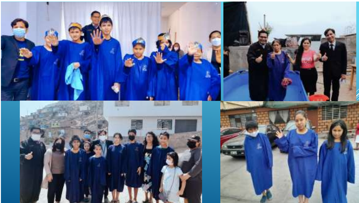
Anexo 7 bautismos de campañas