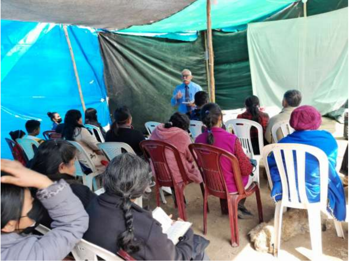
Anexo 4 clase de adultos