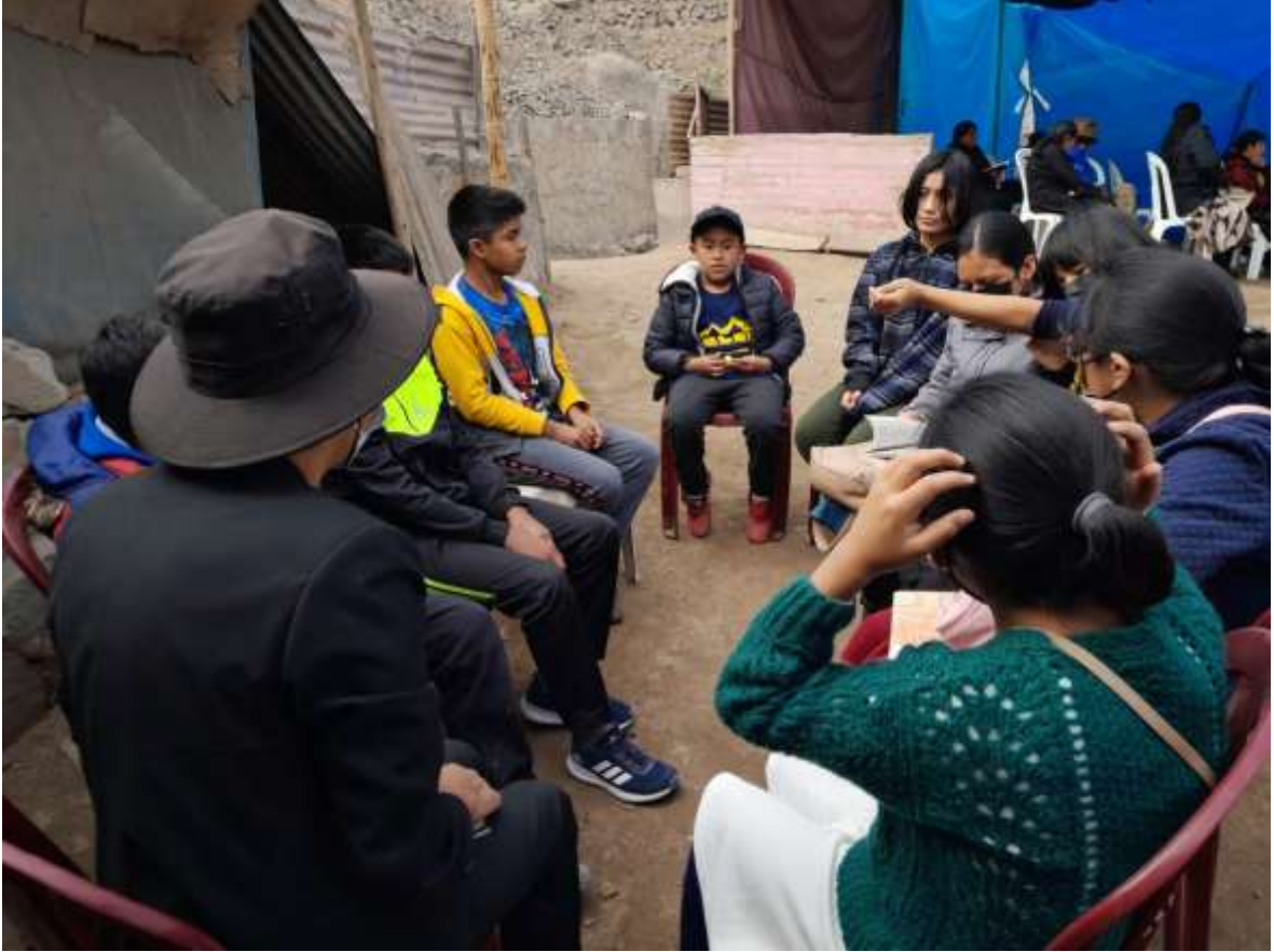
Anexo 3 clase de adolescentes