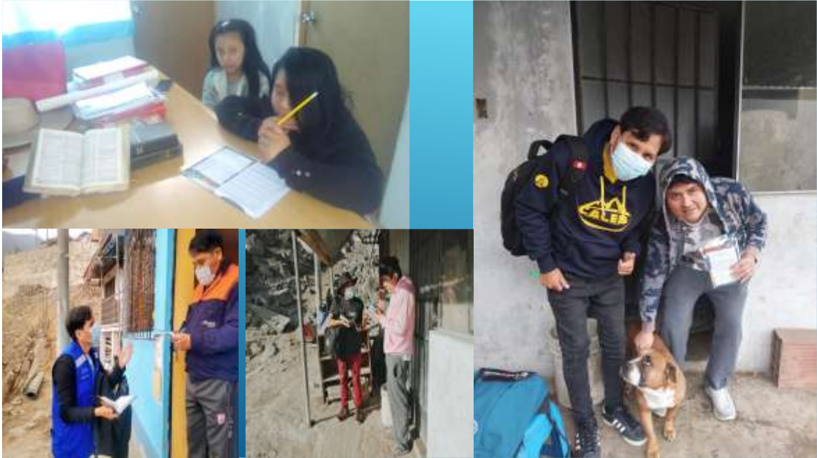
Anexo 6 cursos biblicos