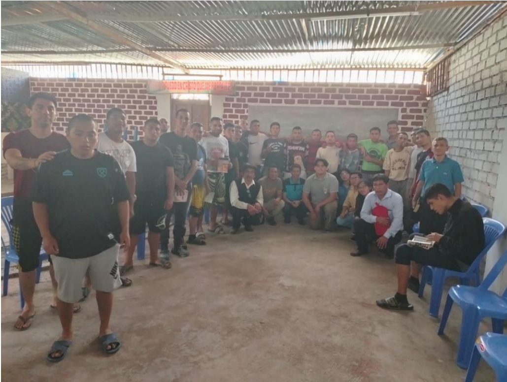
Imágenes: bautismo de 12 internos del Centro “Unidos en Cristo