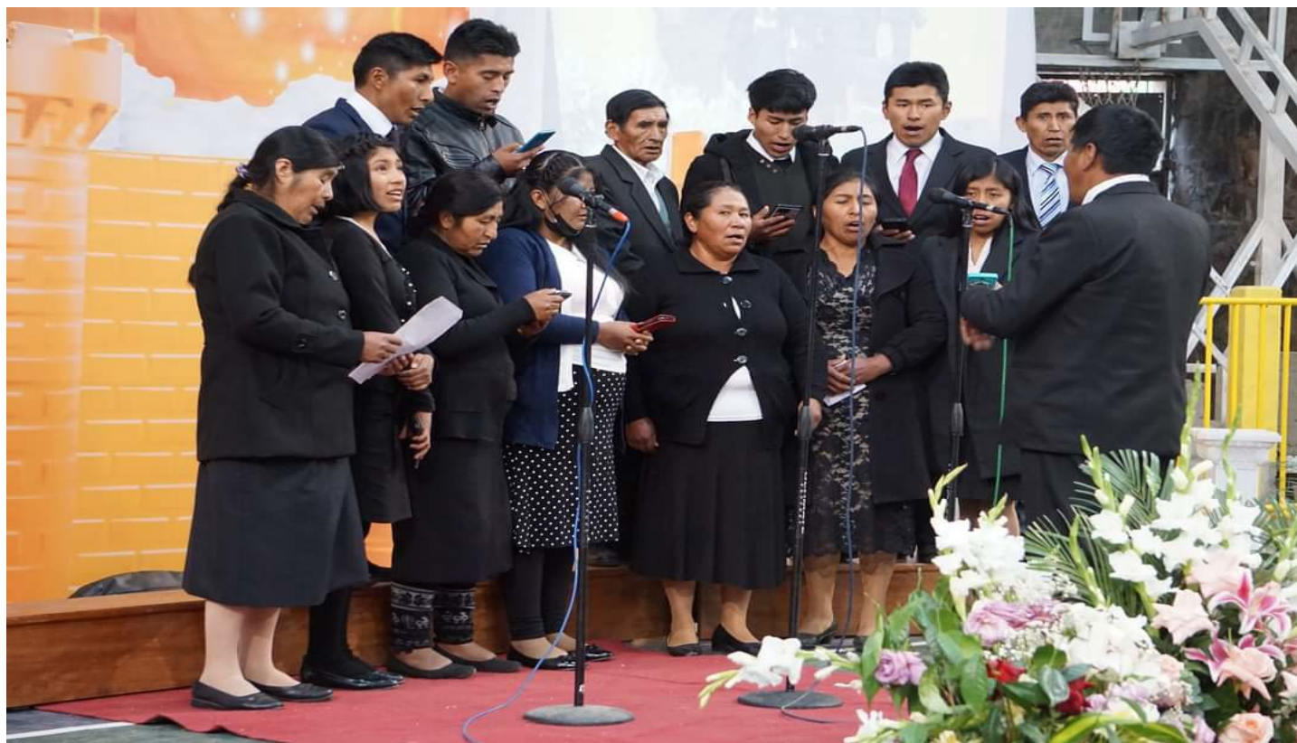
Evidencia de las Noches de Vigilia y retiros espirituales para la oración constante.