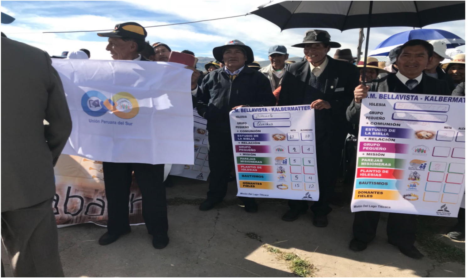
Parejas discipuladoras con sus estudiantes de la Biblia