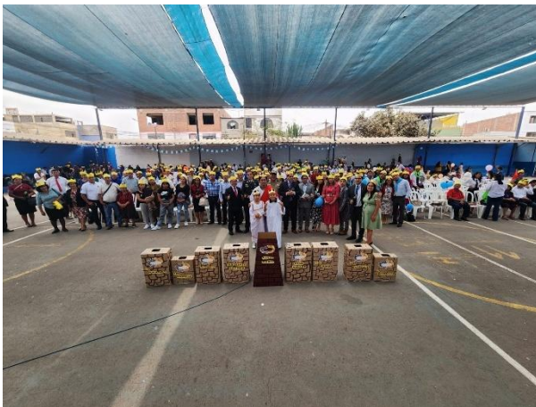
Encuentro Distrital de Iglesias y lanzamiento de Planes 2024