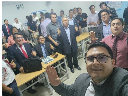
Reuniones de Monitoreo con lideres Distritales