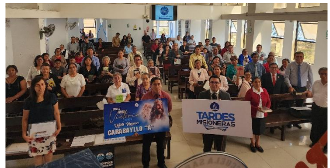
Encuentro distrital de lideres