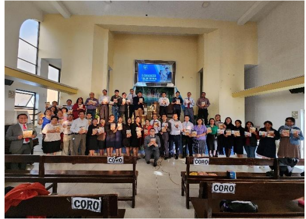
Lideres reunidos para ver detalles de la campaña de evangelismo de Semana Santa