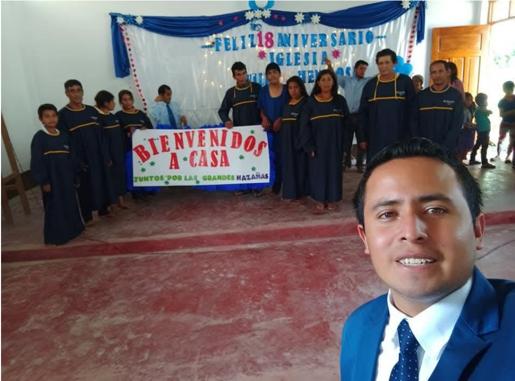
Capacitación a instructores bíblicos