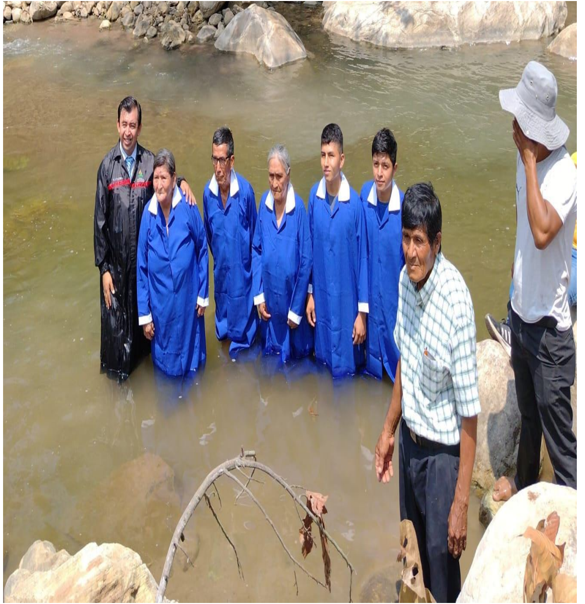
Bautismos de jóvenes en de campaña plantío de iglesia