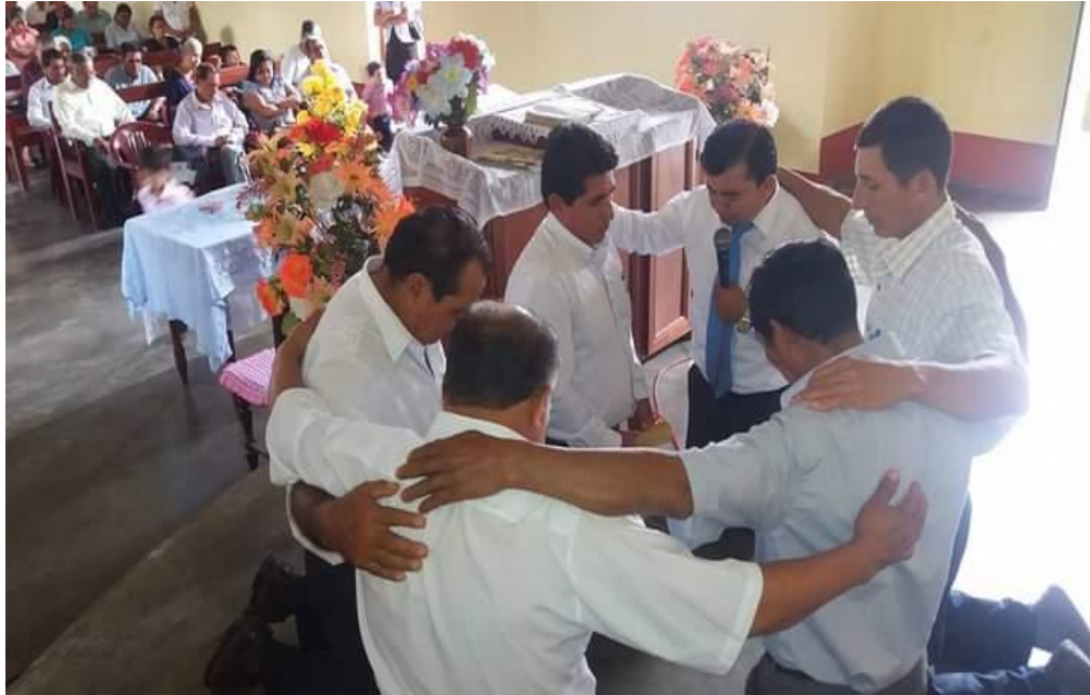
Foto del equipo de evangelismo