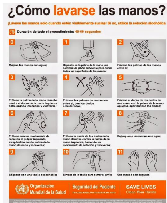
Figura 2: 11 Pasos del Lavado de Manos.