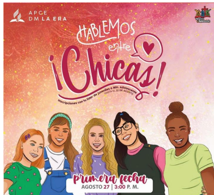
FIGURA 4: Afiche publicitario "Hablemos entre Chicas"