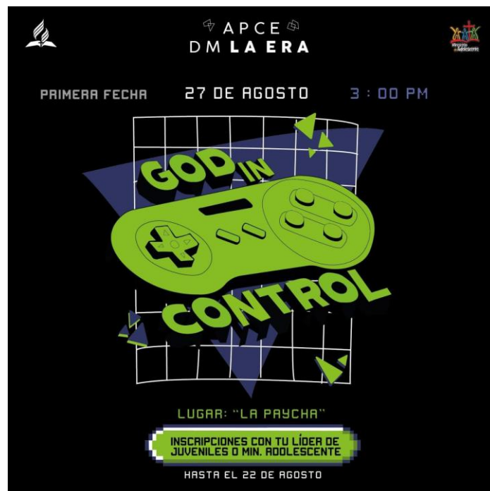
FIGURA 3. Afiche publicitario "God and Control"