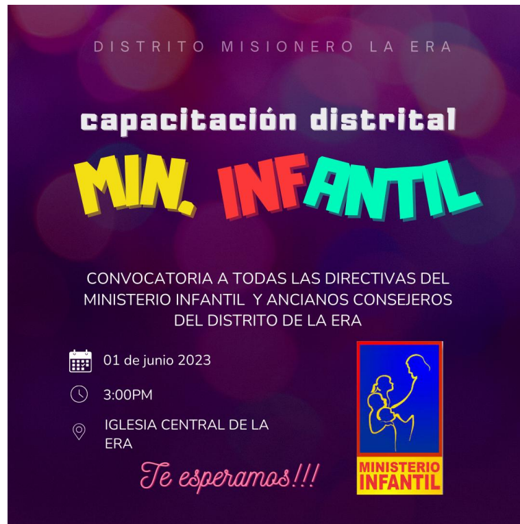
Figura 1: Convocatoria distrital