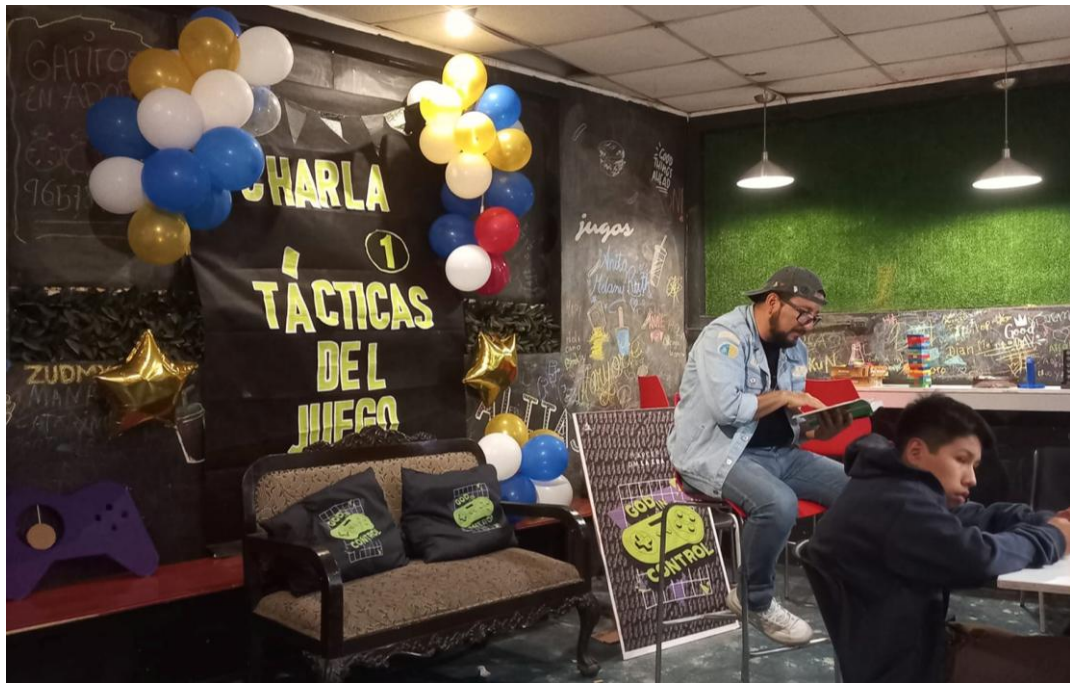
FIGURA 8: Charla 1 “God and Control”