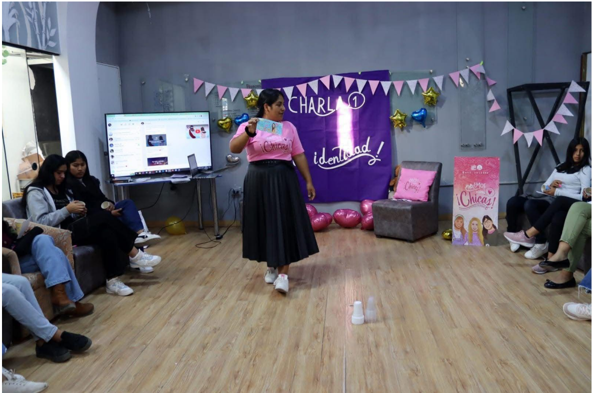
FIGURA 5: Charla 1 “Hablemos entre Chicas”