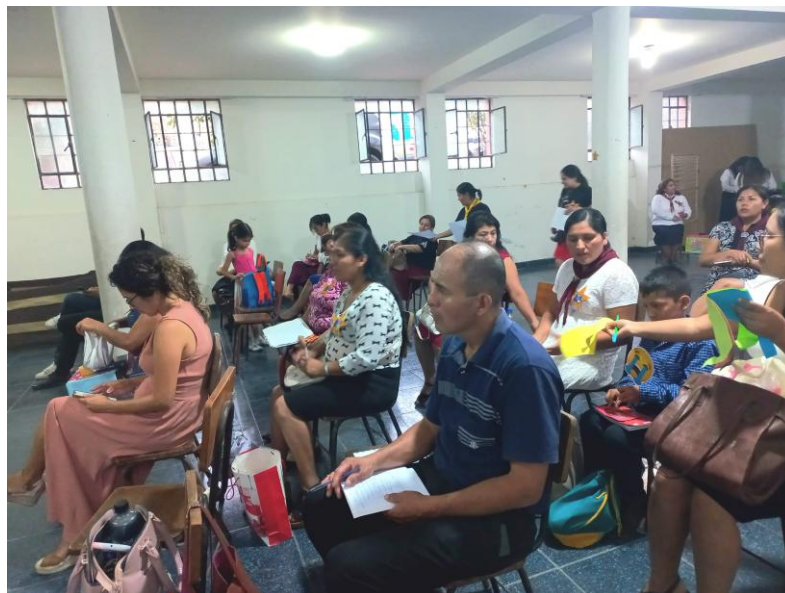
Figura 2: Reunión de directores de ministerio infantil, Distrito La Era