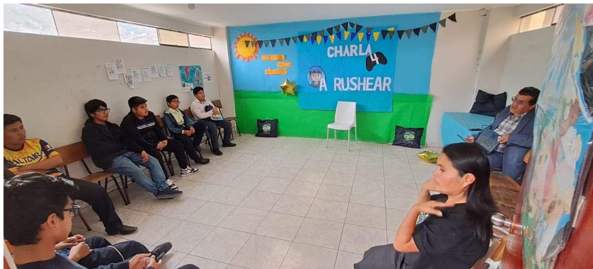
FIGURA 11: Charla 4 "God and Control"