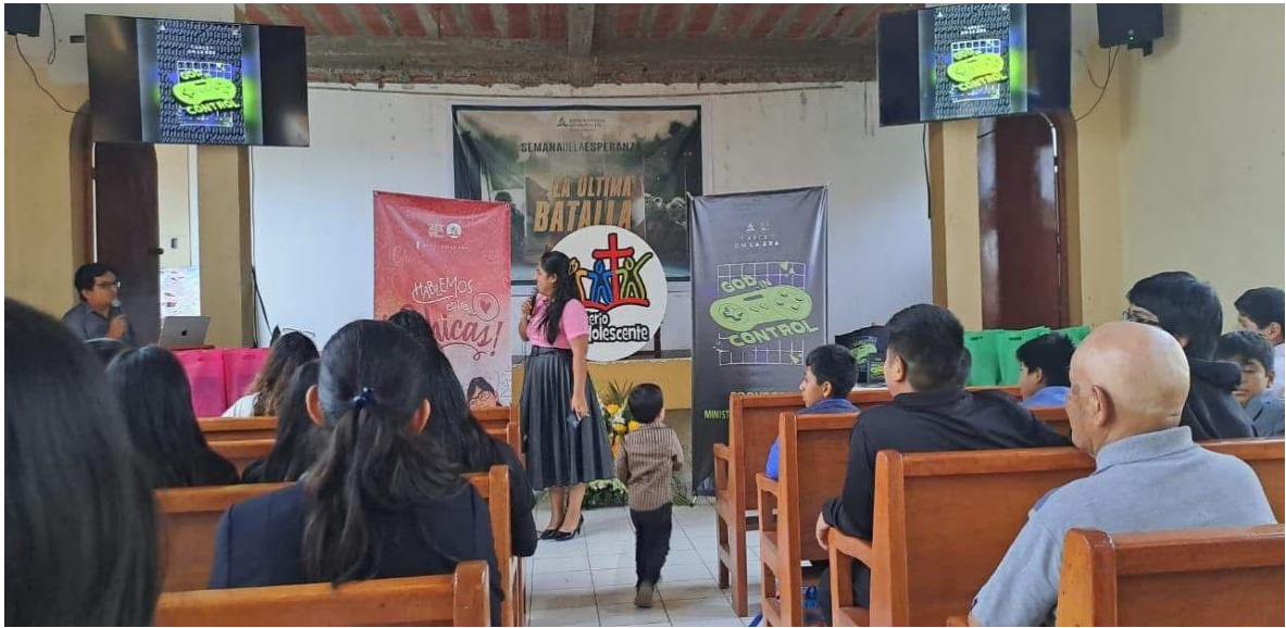
FIGURA 12: Entrega de Certificado