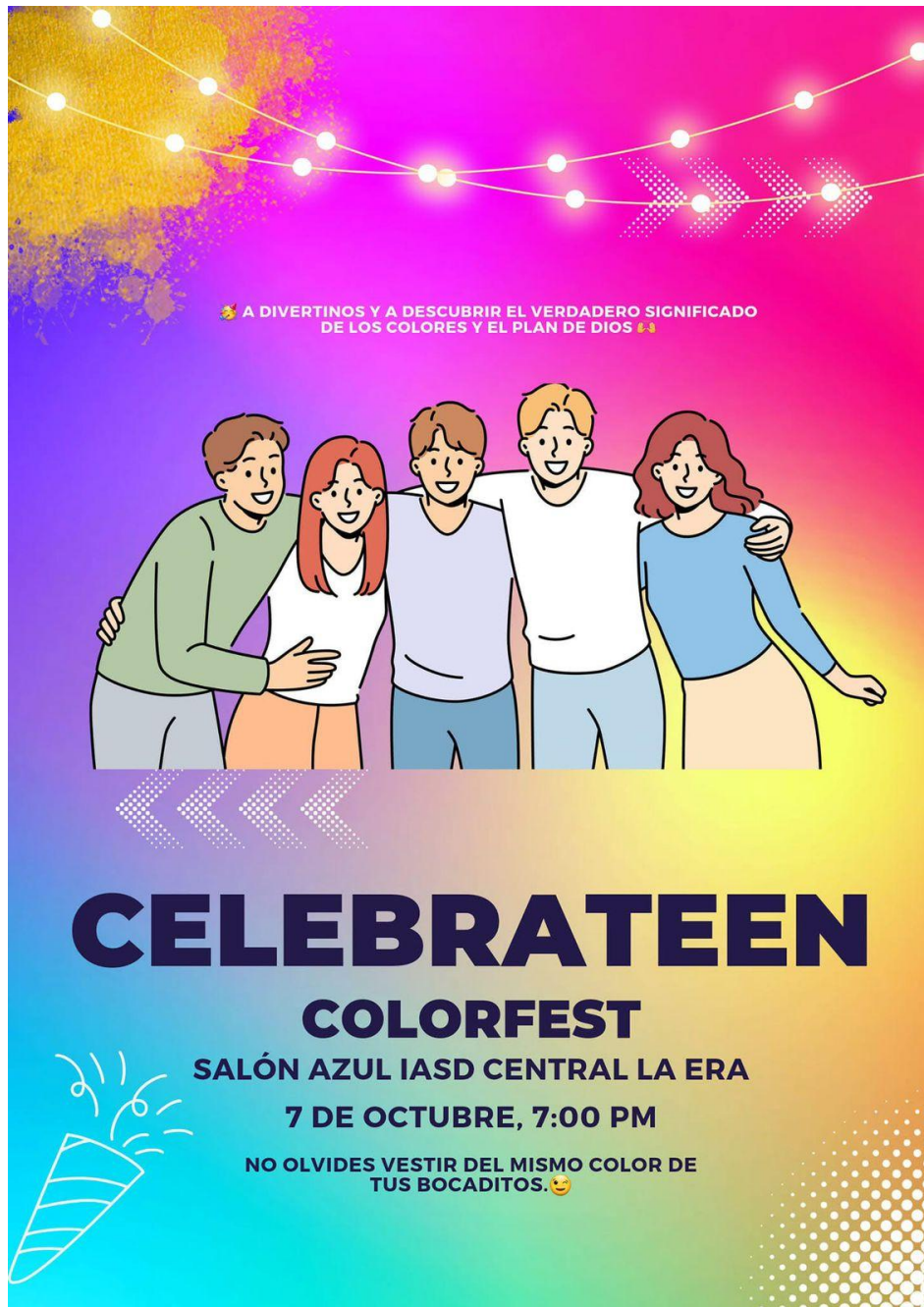
FIGURA 13: Celebración