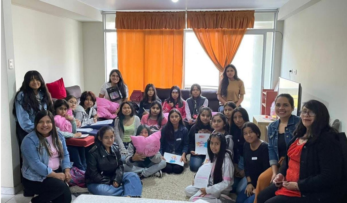
FIGURA 6: Charla 3 “Hablemos Entre Chicas”