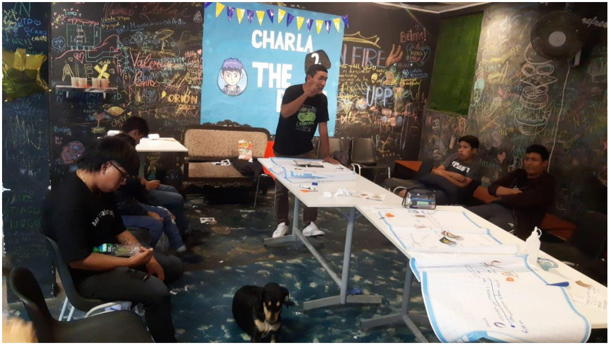
FIGURA 8: Charla 2 "God and Control"