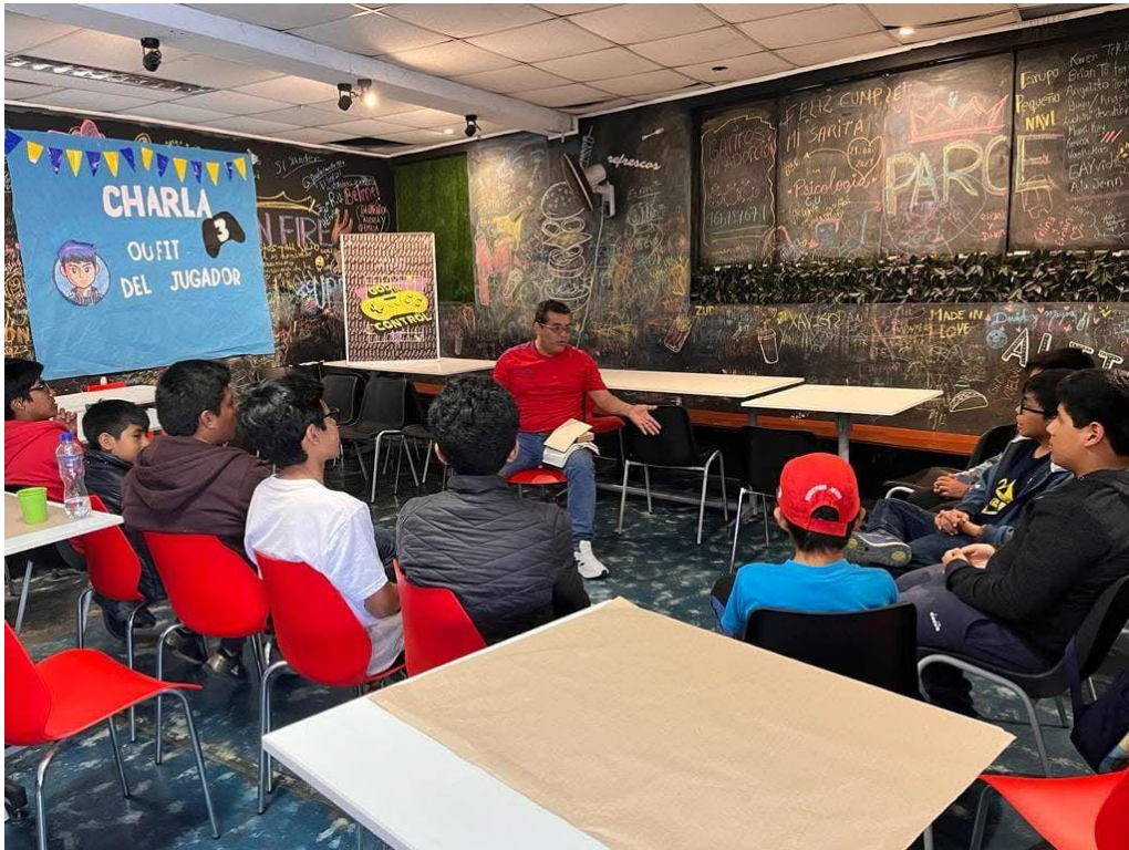
FIGURA 10: Charla 3 “God and Control”