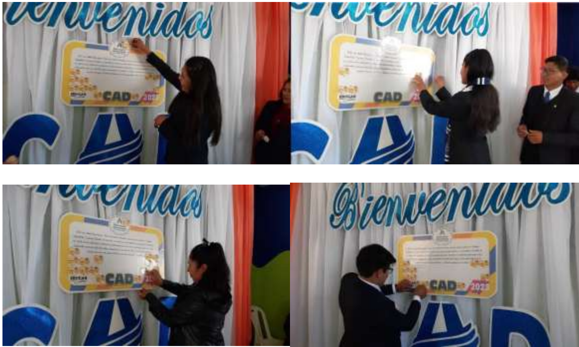
Anexo N° 06 (Grupos Pequeños)