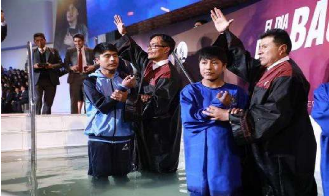
Bautismo en Campamentos - Aventurí ( solo una foto de muestra)