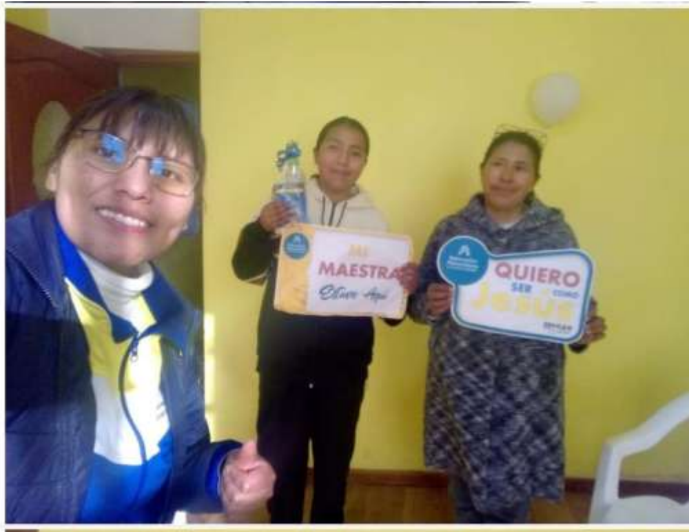
Los maestros realizando visitas a los estudiantes