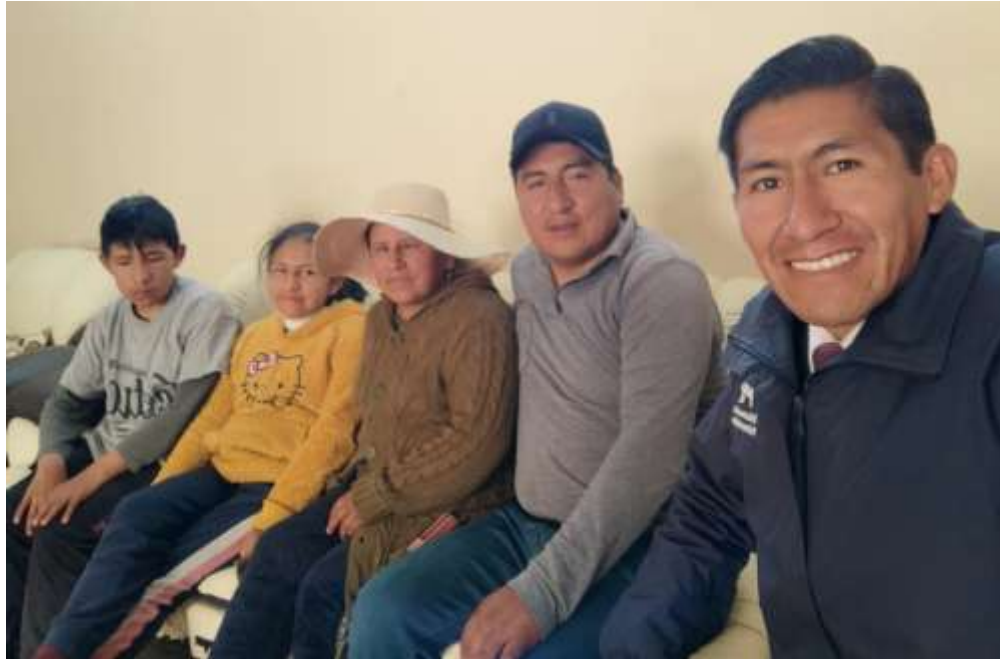
Visitando a nuestros padres de familia