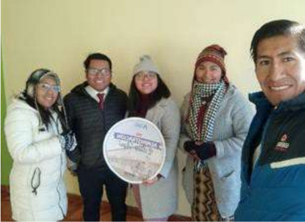
Visitando a la administración del colegio