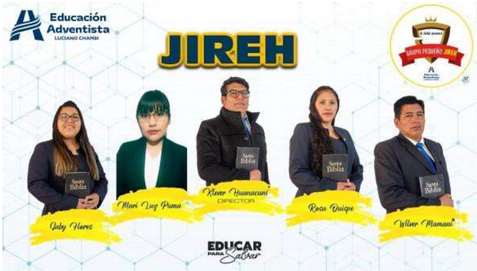
Anexo N° 07 (Desfile de Grupos Pequeños y desafío de metas)