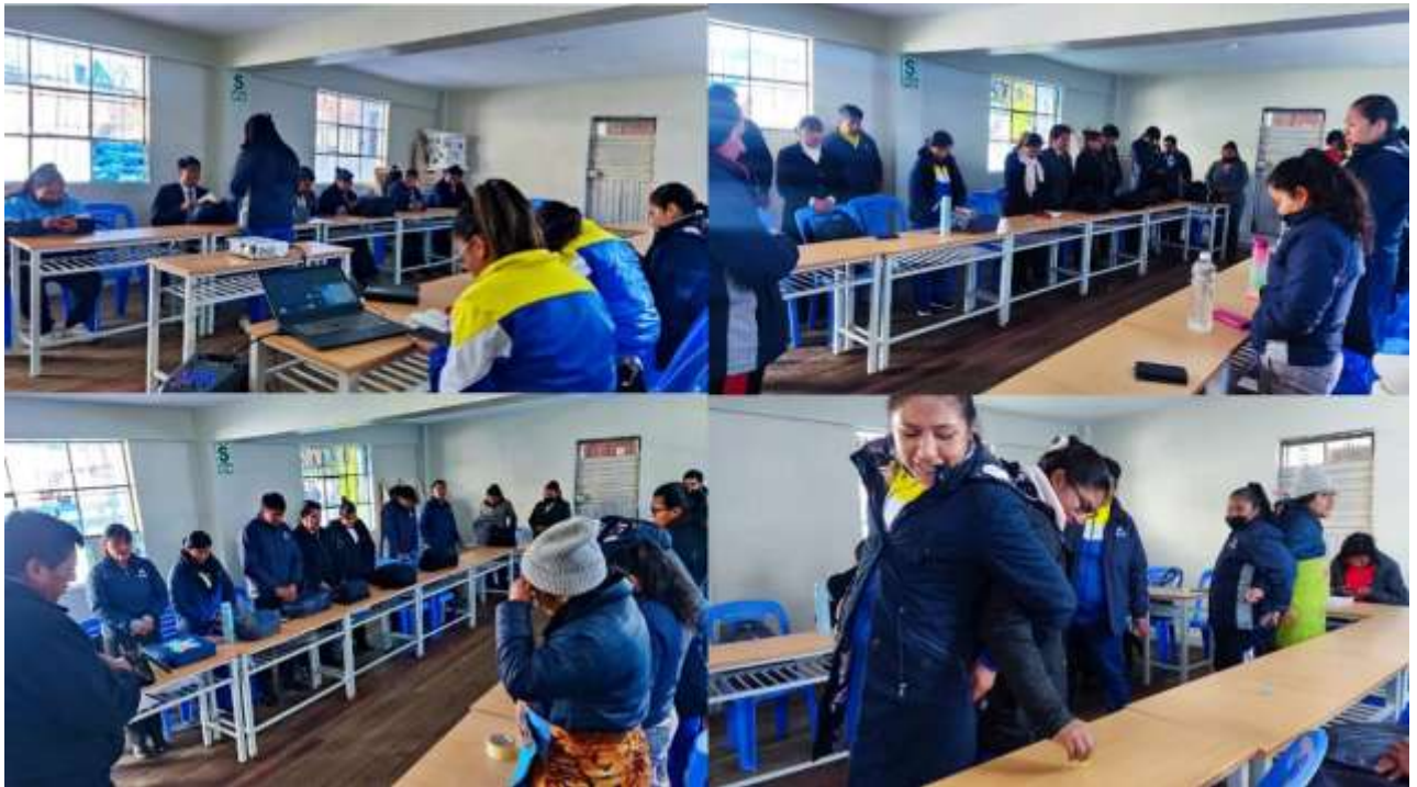
Anexo N° 09 (Realizando el curso Yo creo y la Fe de Jesús)