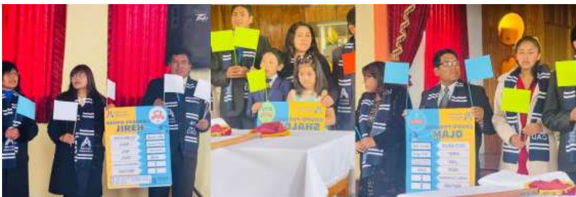
Anexo N° 08 (Programas dirigidos por los grupos pequeños)