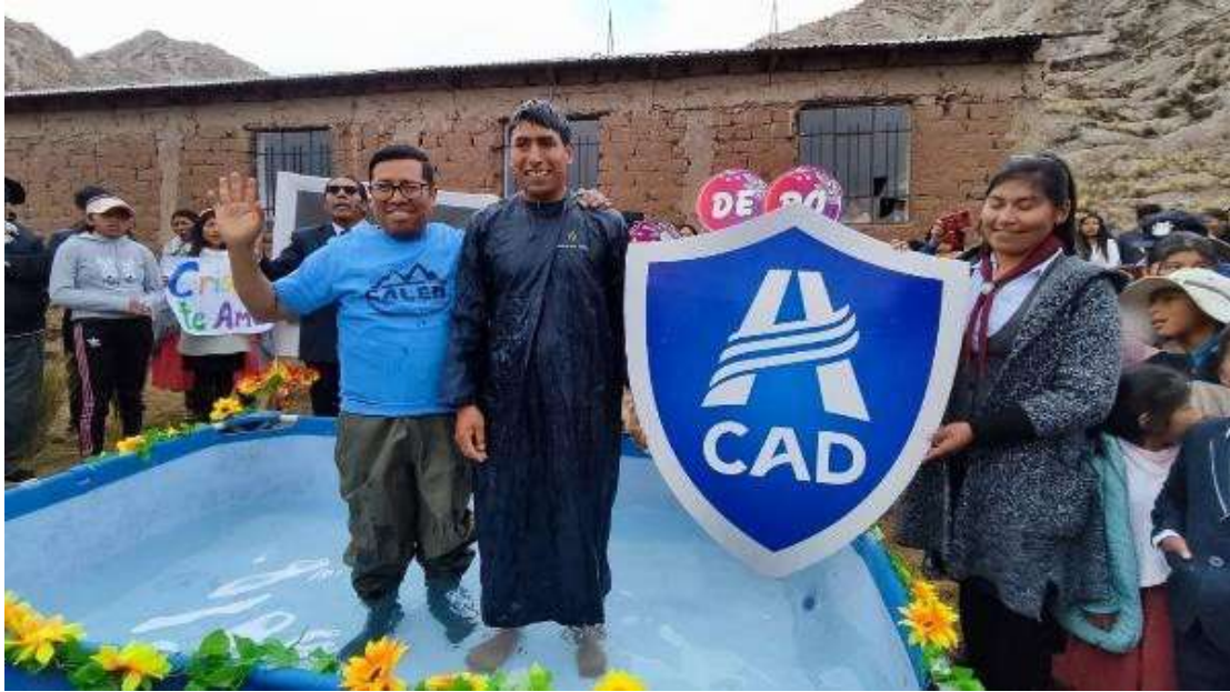
Bautismo en Aniversarios ( solo una foto de muestra)