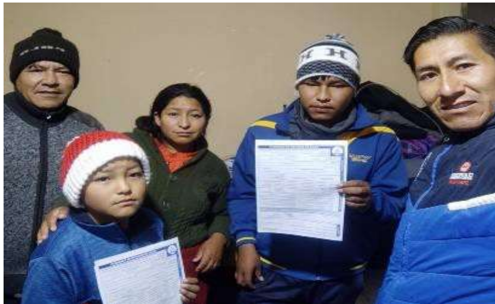
Visitando a nuestros estudiantes y tomando decisiones para el bautismo

Durante el transcurso del año 2023, se llevaron a cabo visitas a los estudiantes y padres de familia de la Institución Educativa Adventista Luciano Chambi de Desaguadero. Para garantizar el éxito de este plan, se involucró activamente a los maestros, quienes desempeñaron un papel fundamental en la realización de estas visitas.