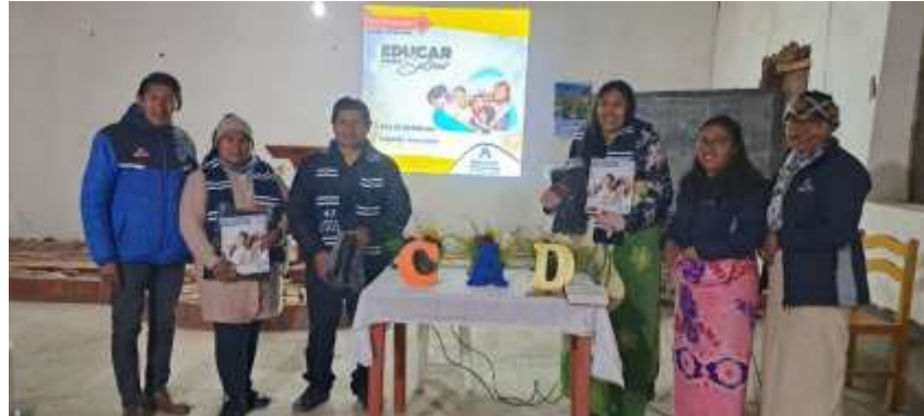
Anexo N° 03 (Programa de lanzamiento del Proyecto Primero Dios, demoniando la llave del cielo)