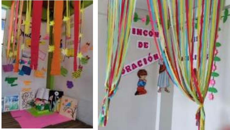
Anexo N° 05 (Compromiso de los maestros)