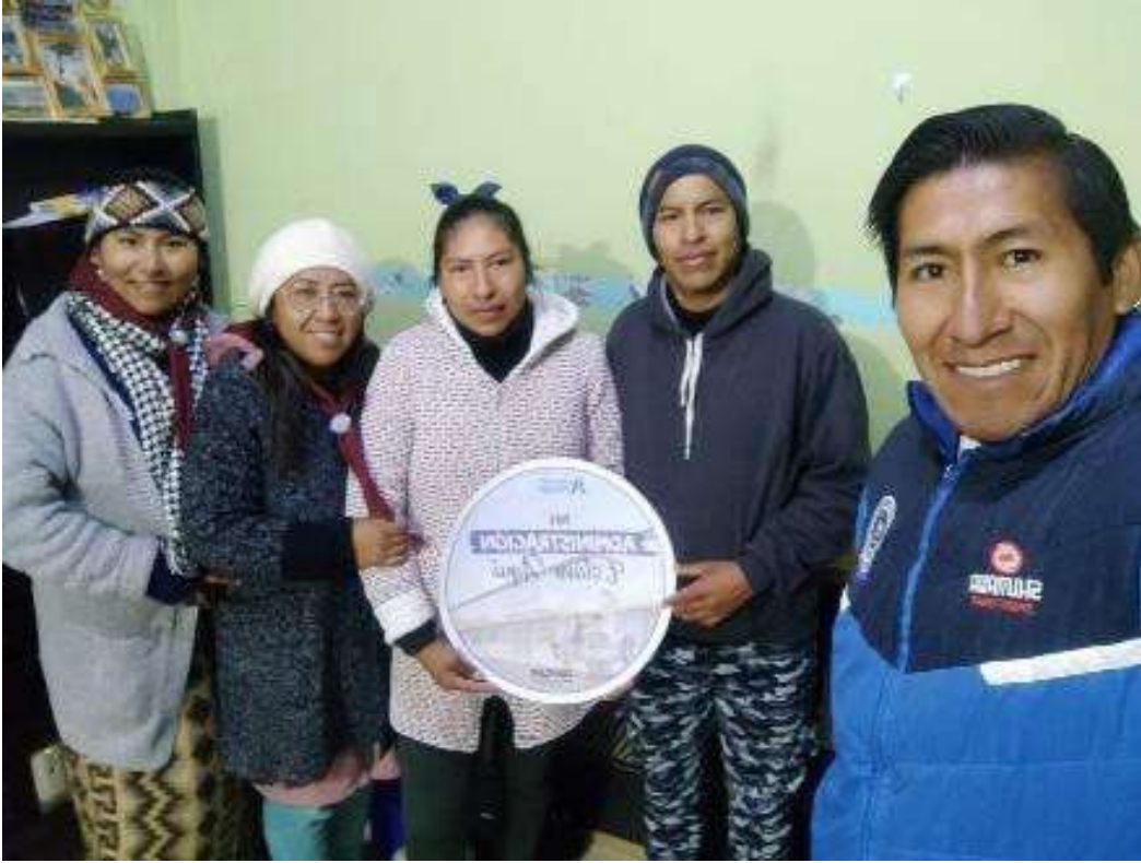
Visitando al personal docente