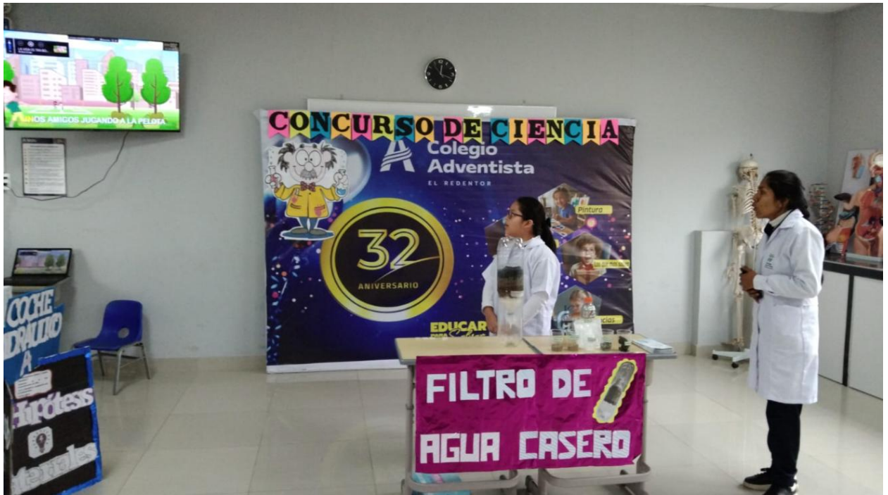
Figura 7. Concurso de ciencias