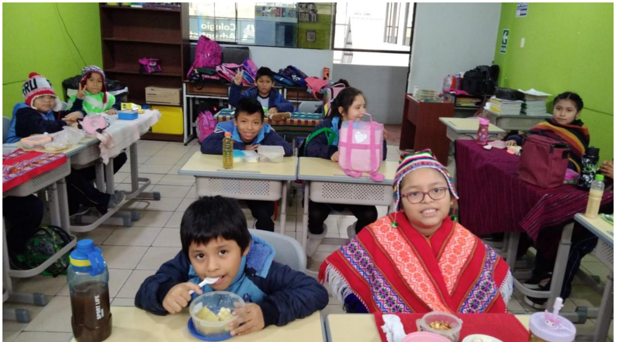
Figura 4. Día del campesino

Con este proyecto, buscamos que la celebración del Día del Campesino sea una experiencia enriquecedora que genere conciencia sobre la importancia del trabajo agrícola y su impacto en nuestra vida cotidiana.