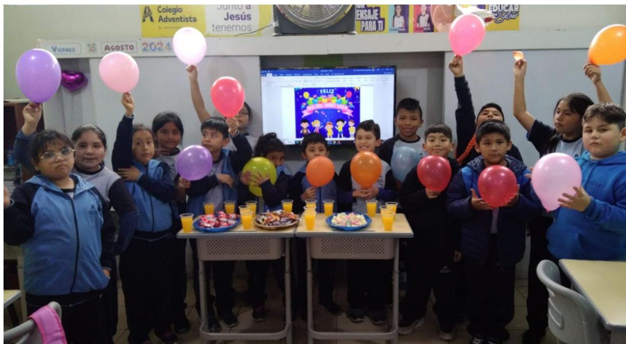
Figura 6. Día del niño

Alta participación de los niños en las actividades programadas. Mejora en la integración y convivencia entre los estudiantes. Experiencias positivas que refuercen la autoestima y el bienestar de los niños. Fortalecimiento de la comunidad educativa mediante el trabajo conjunto en la organización del evento. Con este proyecto, buscamos que la celebración del Día del Niño sea una experiencia enriquecedora y memorable para todos los estudiantes, contribuyendo a su felicidad y desarrollo integral.