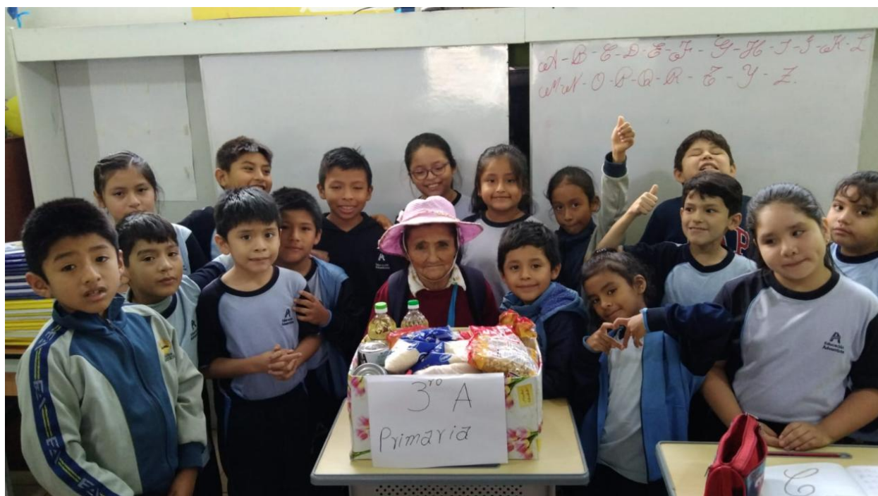
Figura 8. Más amor en Navidad

Con este proyecto, se buscó que la Navidad sea una oportunidad para que los niños experimenten la alegría de compartir y ayudar a los demás, promoviendo valores que perduren más allá de las festividades.