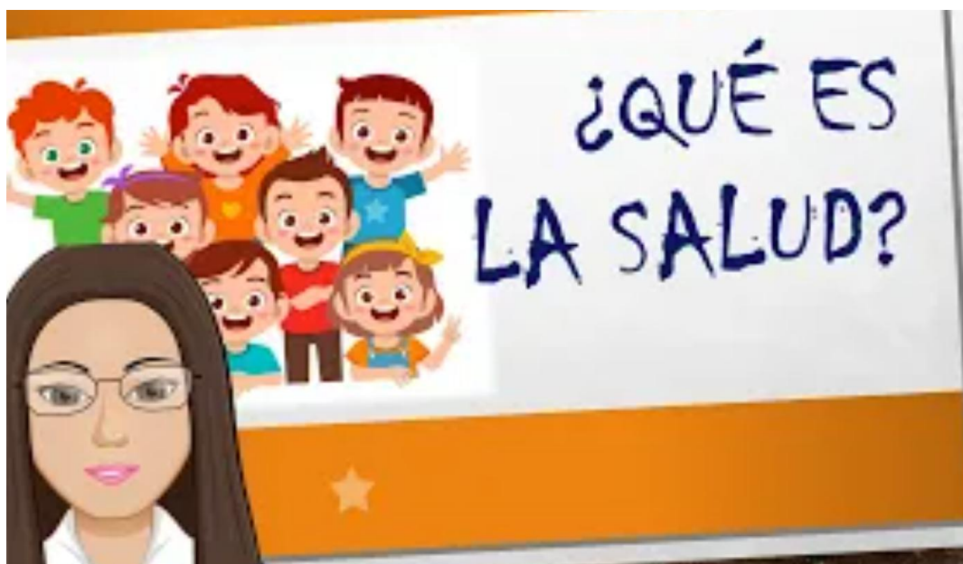
Figura 10. Video de ciencia y Tecnología. ( https://youtu.be/OKM88cZyuP8 )