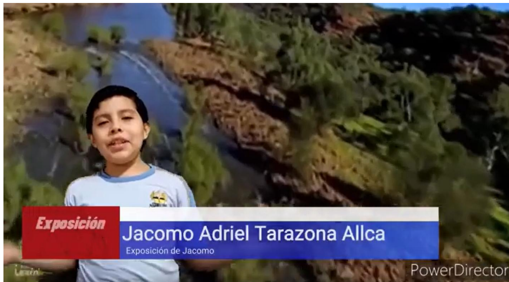
Figura 9. Exposición de un estudiante que colgó en su portafolio digital ( https://youtu.be/0Up6ZoLphIU )