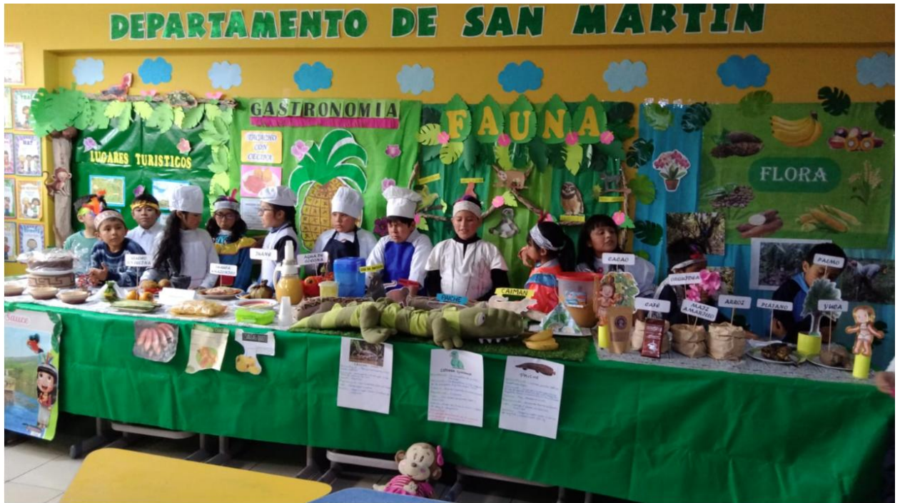
Figura 5. Semana Patriótica