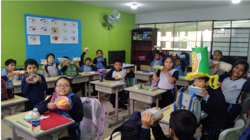
Figura 3. Día de la papa