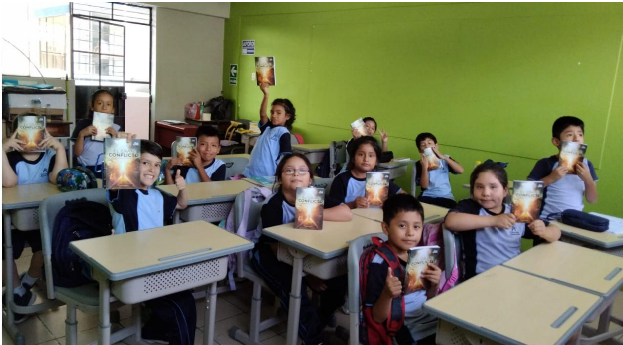
Figura 1. Perú sí lee

Concientizar sobre la importancia de la lectura como instrumento de crecimiento personal y social.