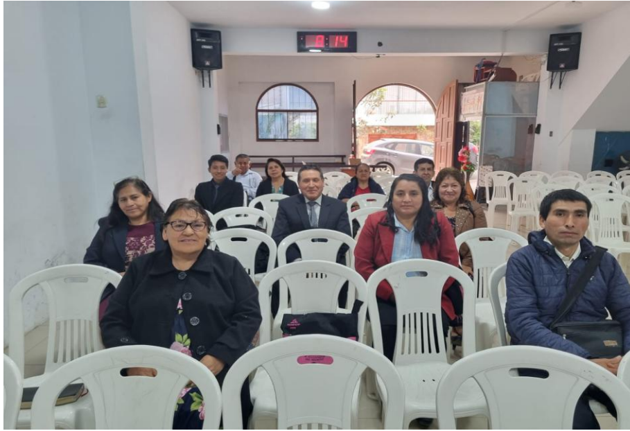
Anexo 3: Presentación del Proyecto a los líderes de las iglesias