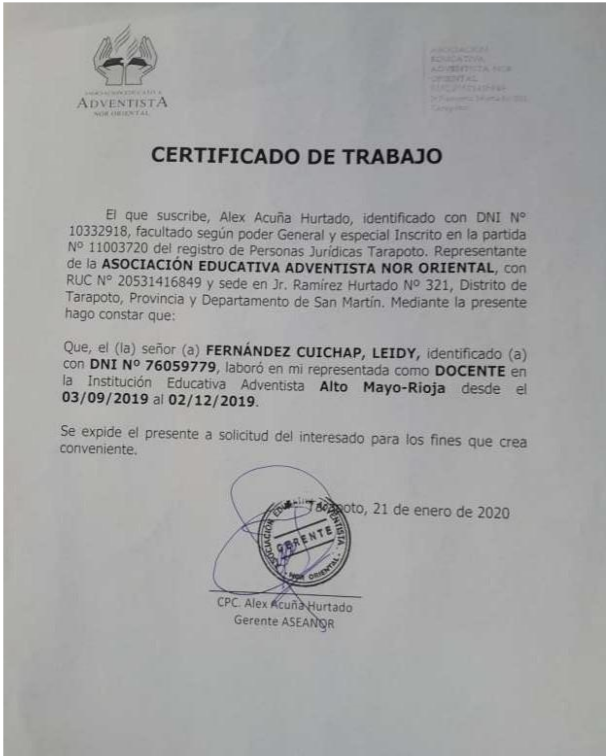
Ilustración 3 Certificado de Trabajo

Anexo A: Copia de certificado de los tres años de experiencia laboral