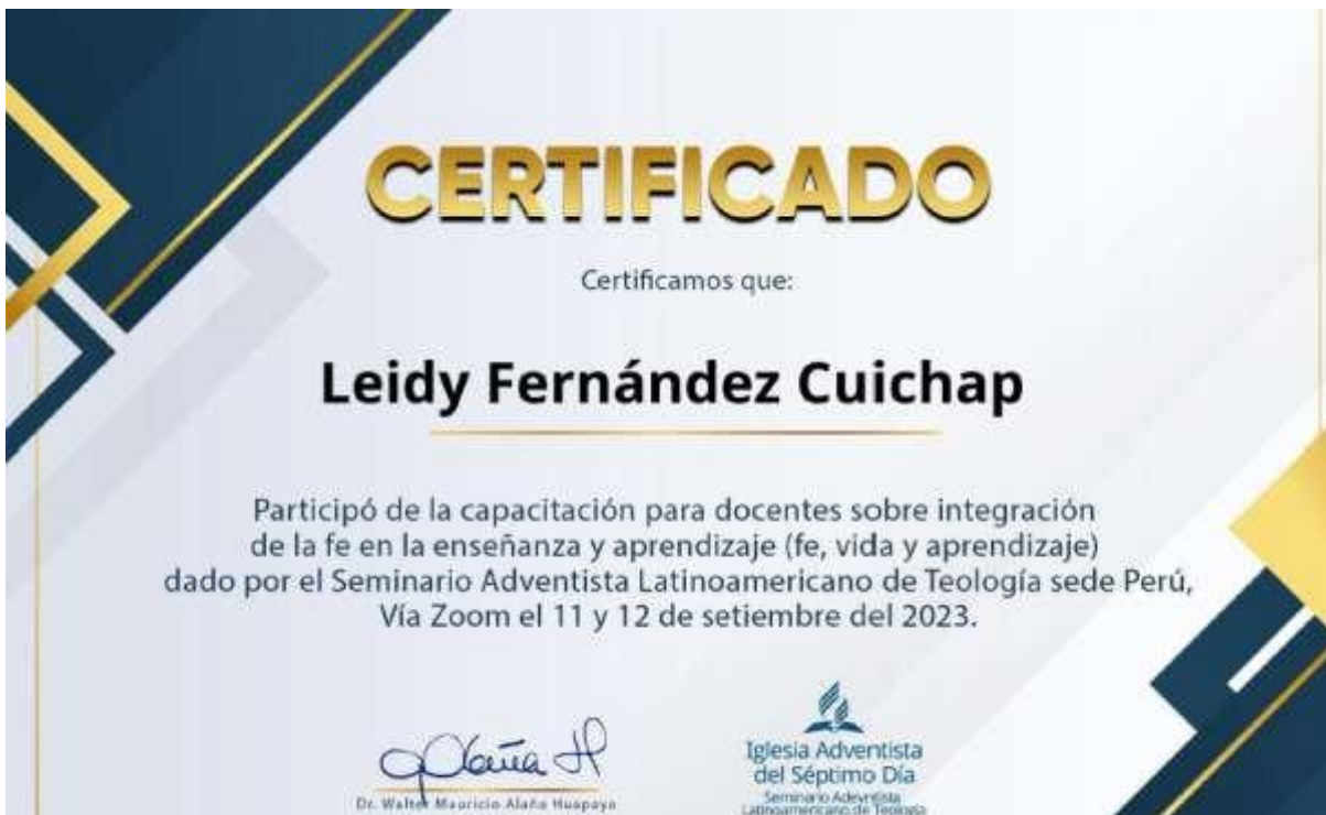
Ilustración 2 Certificado de participación para docentes.