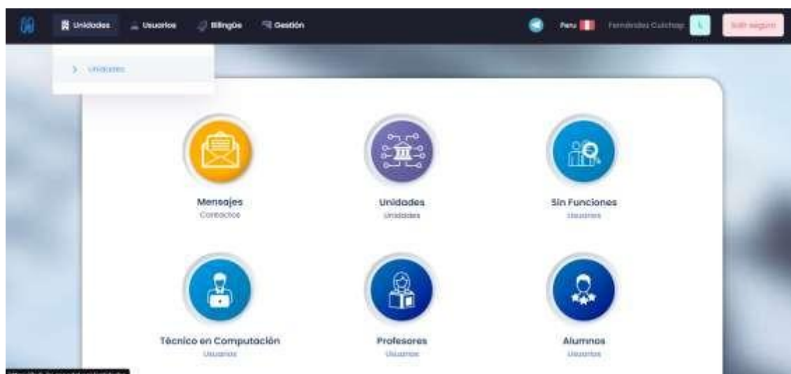
Ilustración 7 Plataforma HUB-Educacional