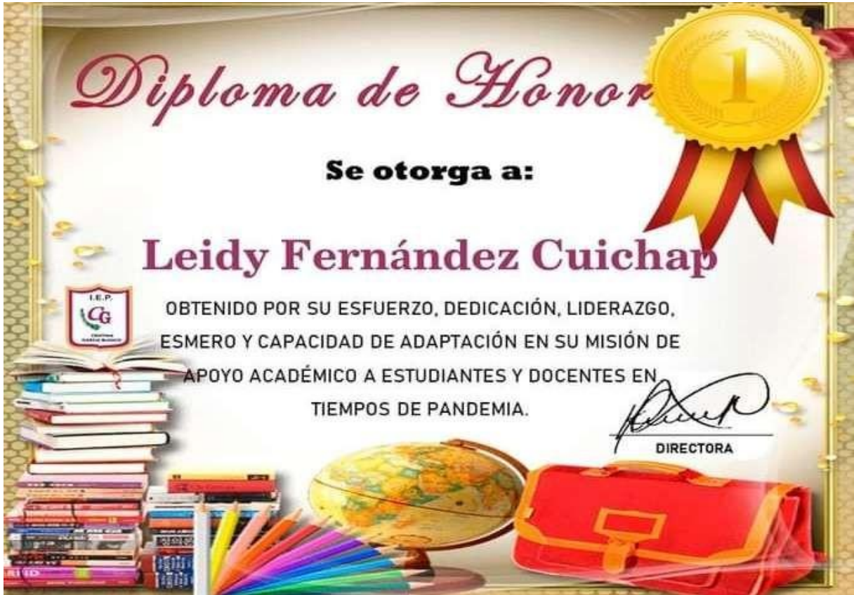
Ilustración 1 Diploma de apoyo académico a estudiantes y docentes.