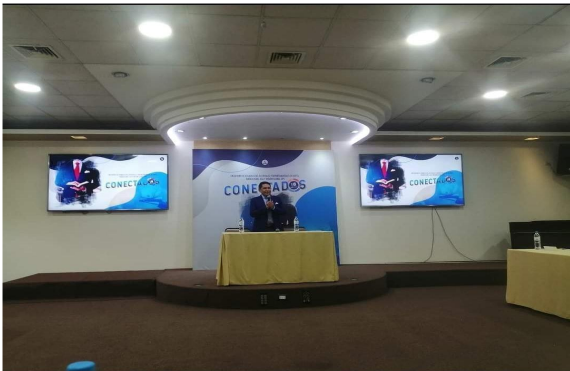
Figura 3: Capacitación de los evangelistas de la UPS