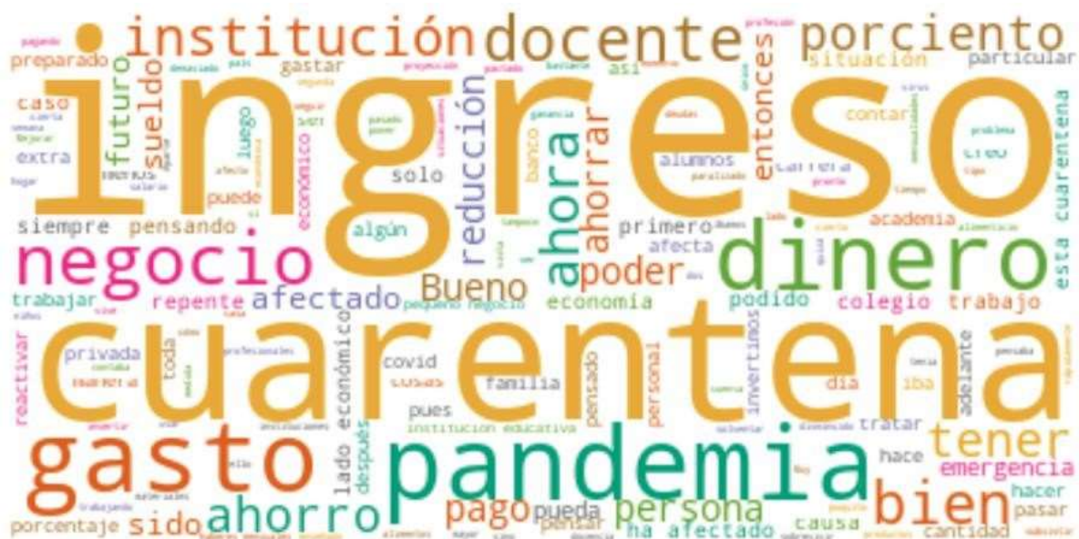
Figura 2 Palabra más frecuentes : ingreso, gasto, pandemia, docente, negocio, dinero, institución, ahorro, pago, persona, bien, futuro, afectado, cuarentena, emergencia, ahorra, sueldo

La figura 3 nos muestra el análisis de las palabra más frecuentes en la respuesta de los participantes: la palabra “ingreso” es la más mencionada ya que nuestros entrevistados han sido afectados considerablemente en este aspecto tal como lo menciona D008 “me está afectando la reducción de mis ingresos económicos considerablemente”, y a su vez afirma D007 diciendo “me afecto demasiado, por la reducción de mi salario mensual” como también la mencionan D001, D002, D003, D005, D006, D009 y D010; y es así que en la iteración 2 D004 indica que es indispensable la cultura financiera diciendo “mejorar el manejo de mis ingresos”, de igual manera, D003 nos recomienda “no tratar de gastar nuestro dinero o despilfarrarlo todo nuestro ingreso”, al igual que D005 “tener un control de mis ingresos y gastos o lujos innecesarios”, es por ello que esta corroborada por estas razones.