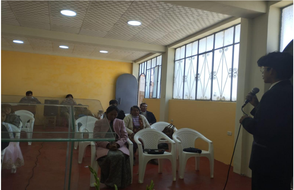
Anexo 11.2. Los jóvenes invitando al pueblo para la campaña Caleb