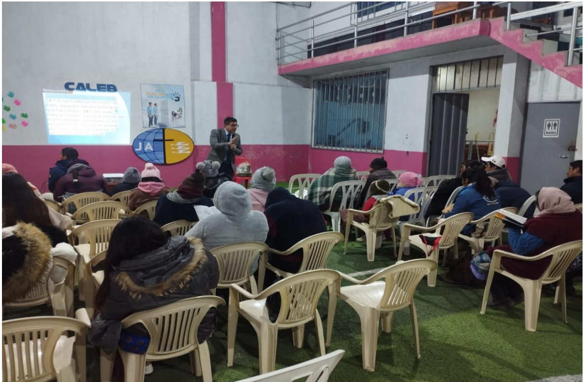
Mucha gente salió al llamado