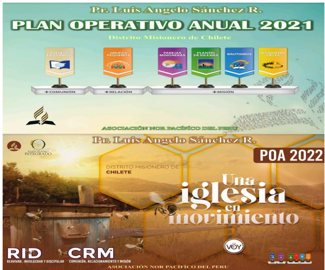
Figura 4: Plan operativo anual que abarca los meses enero a diciembre 2021 y 2022.

El POA ofreció a los dirigentes de iglesia la ruta de actividades con sus fechas respectivas siguiendo el Cronograma de la UPN y ANoP a fin de alcanzar los desafíos y metas del DM Chilete.