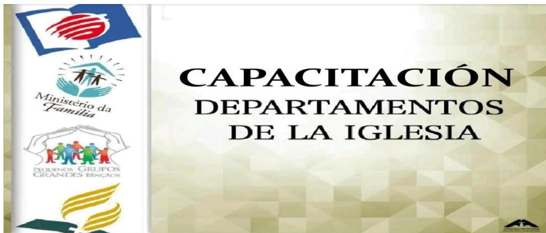
Figura 3: Este seminario abarca el tema de Funciones de los Departamentos

Este seminario concientizó a los dirigentes de iglesia sobre el conocimiento de sus funciones y objetivos competentes para su buen desempeño en la obra del Señor (1 Cor 12:4; Efe 4:12).