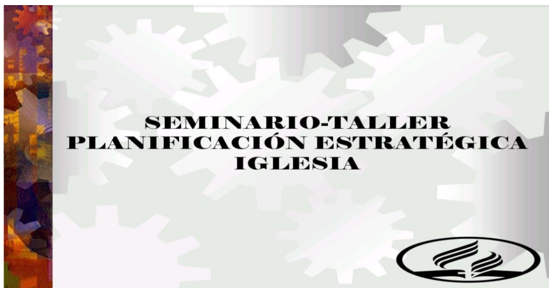
Figura 1: Este seminario abarca los temas de Definiciones estratégicas: Visión, Misión, Análisis FODA y Objetivos generales y específicos (Ver Anexo 3).

Dicho seminario concientizó a los dirigentes de iglesia sobre la necesidad primordial de estar preparados cabalmente para servir a Dios con propósito en forma digna, ordenada y reverente. (1 Corintios 7:17; 14:40; 2 Timoteo 3:17).