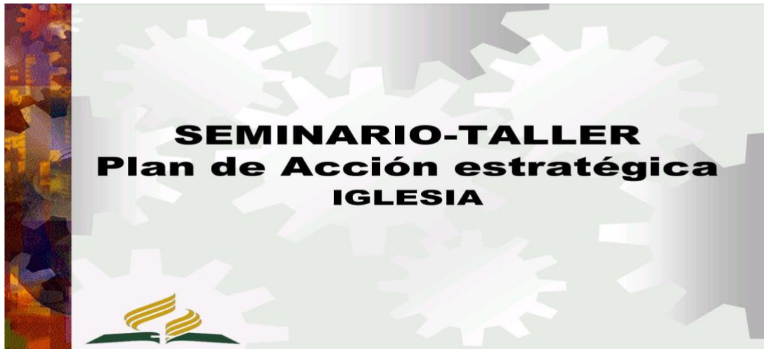
Figura 2: Este seminario abarca el tema de sobre ¿Cómo establecer las Metas, Actividades estratégicas, Indicadores y presupuesto de un plan de trabajo?

Dicho seminario ofreció a los dirigentes de iglesia las orientaciones y recomendaciones necesarias sobre cómo preparar un plan de trabajo que les permita ejecutar sus funciones y/o responsabilidades en el marco de los ministerios establecidos u otorgados por la iglesia (1 Corintios 12:5, 6).