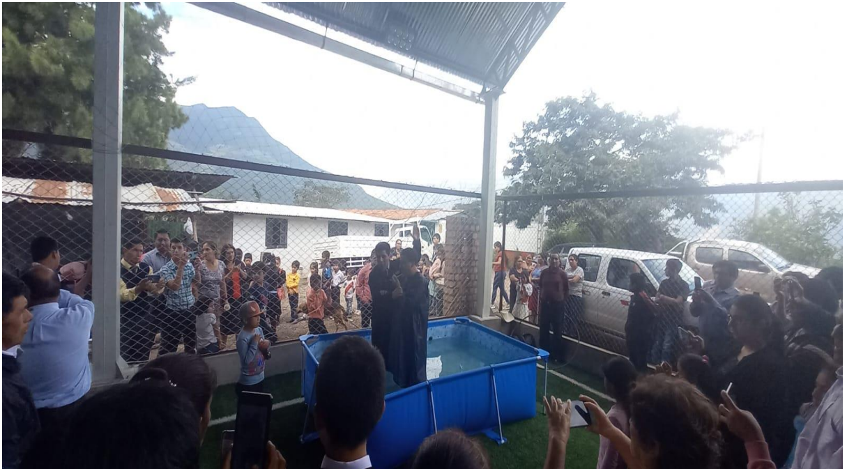
Anexo 6.13: Hermanos de Chilete participando del servicio de comunión