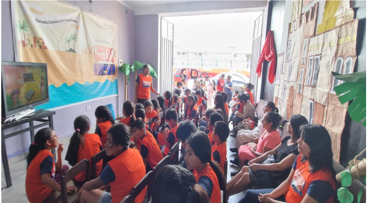
Anexo 10: Primer bautismo en los Jazmines