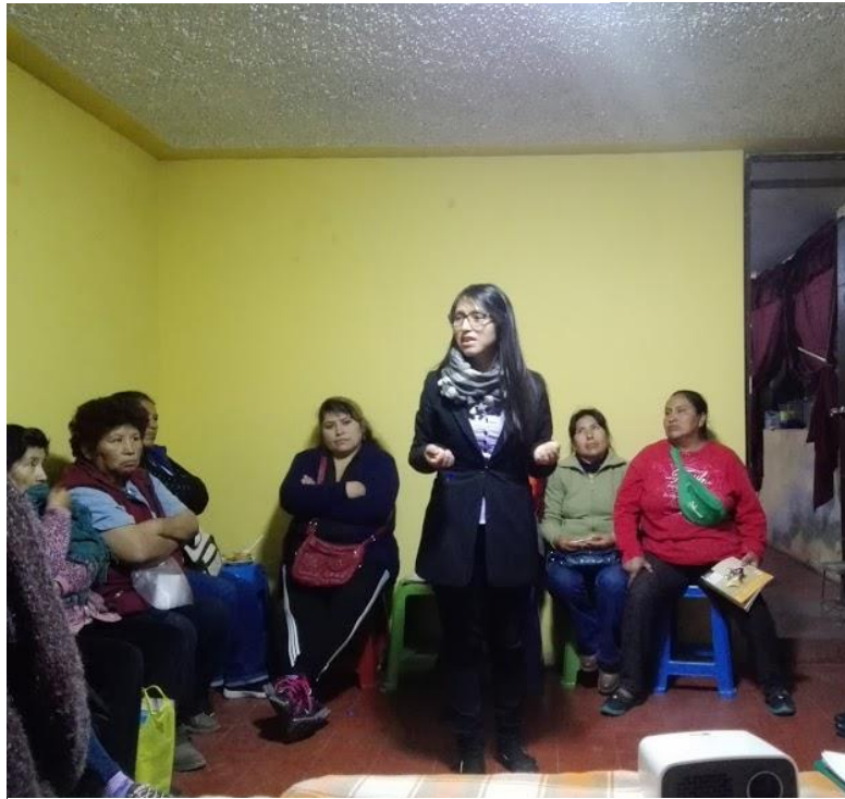
Figura 1: Indicaciones para la aplicación de los instrumentos – Distrito de Socabaya