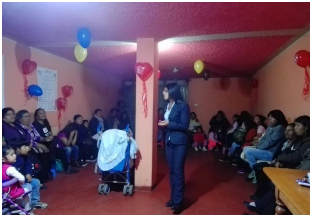
Figura 2: Indicaciones para la aplicación de los instrumentos – Distrito de Cerro Colorado