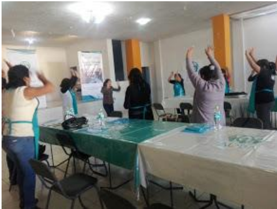
Figura 3: Dinámica con las participantes – Distrito de Alto Selva Alegre