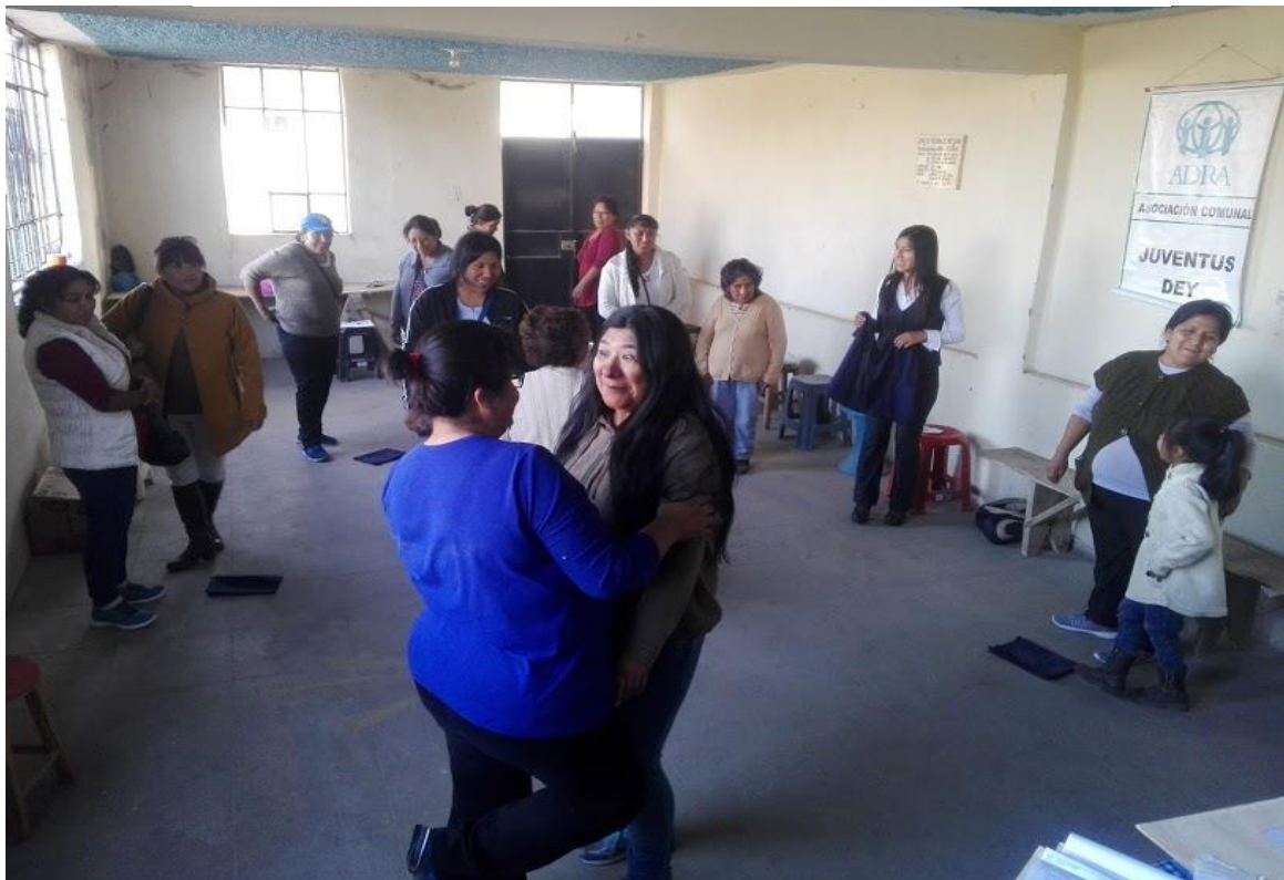
Figura 4: Dinámica con las participantes – Distrito de Hunter