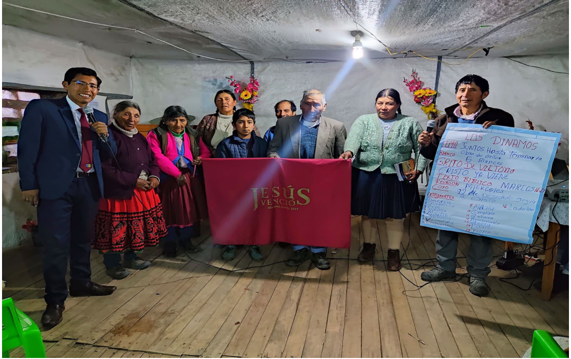
Anexo 20: Bandera blanca de Grupos Pequeños