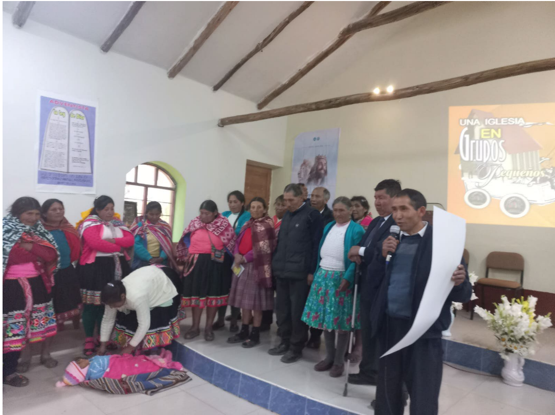
Anexo 19: Desfile de grupos pequeños en iglesias locales