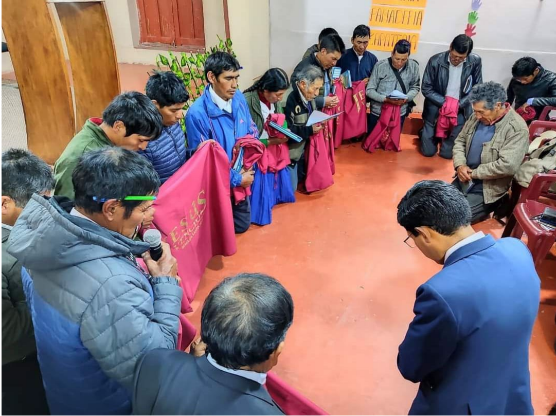
Anexo 18: Seminario una iglesia en grupos pequeños.