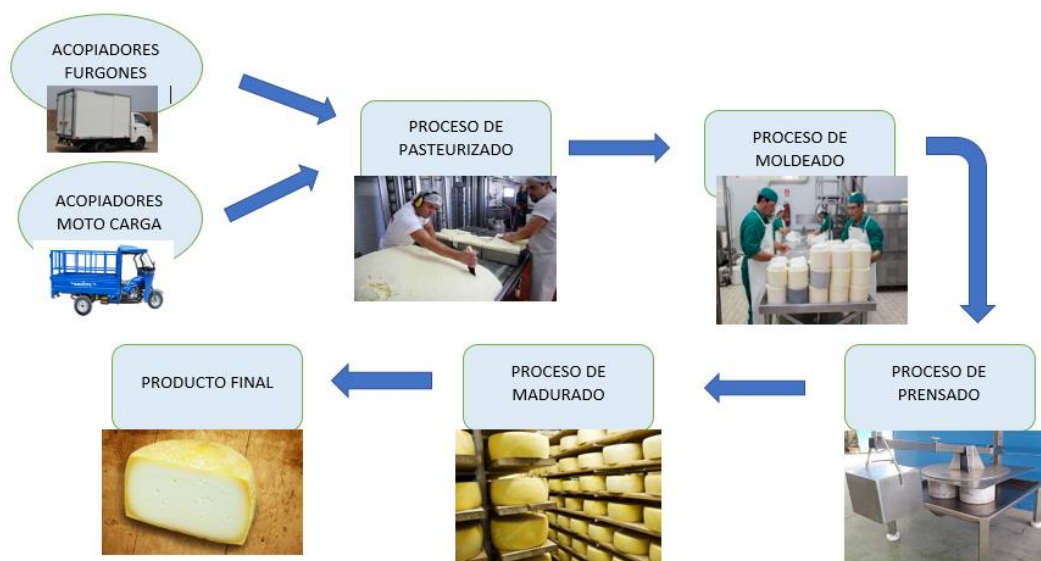
figura n° 01. Flujograma de procesos- (Diseño propio).

Para dicha investigación de Diseño de sistema de costos por procesos se realizó una entrevista diseñada para poder saber el estado situacional, como esta en la actualidad dicha Planta Industrial de estudio, esta entrevista también nos da conocer cómo funciona la elaboración de los quesos semi pasteurizados, cuanto de materia prima ingresa, cuantos trabajadores laboran en la planta, y cuánto dura en promedio cada proceso de producción y así varias preguntas que nos hace conocer sobre el manejo de la producción y que sirven de apoyo a nuestro estudio de investigación.