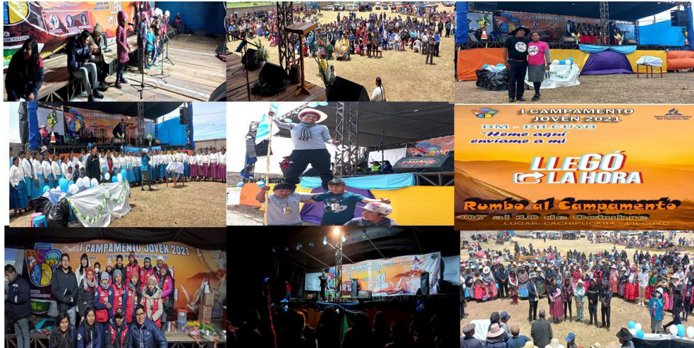
LLEGO LA HORA” en donde se repasó el curso bíblico “Conflicto de los siglos”.