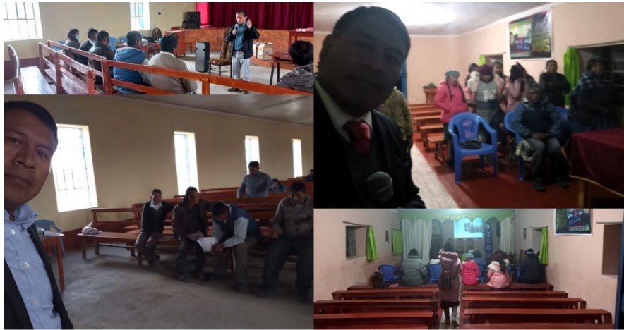
Imagen N°2.8: Jueves de Capacitación Líderes

Todos los jueves por ser un día de feria en la ciudad de Pilcuyo, ya que todos los líderes vienen a hacer sus compras, vender sus productos (productos de la zona), también vienen a la casa pastoral, donde en la iglesia central del Pilcuyo se hacen las capacitaciones y repaso de las principales actividades del trimestre.