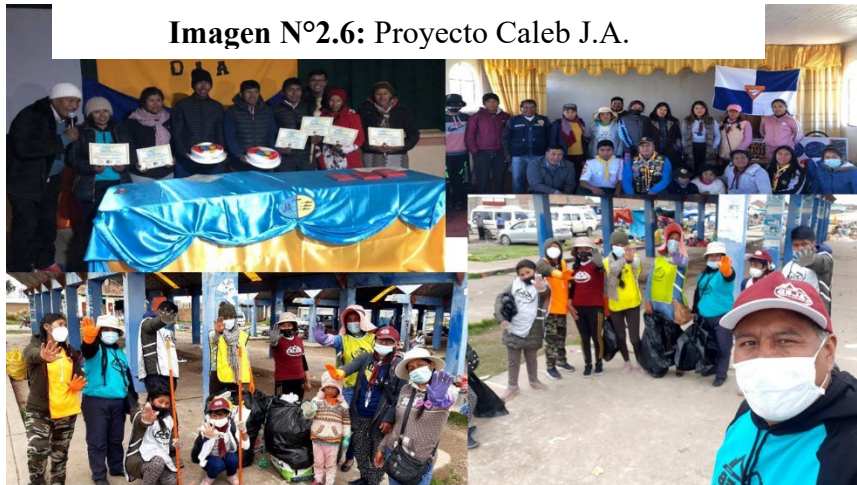
Imagen N°2.6: Proyecto Caleb J.A.

Se desarrolló los programas para los jóvenes el Proyecto Caleb, para despertar en cada joven el espíritu misionero.