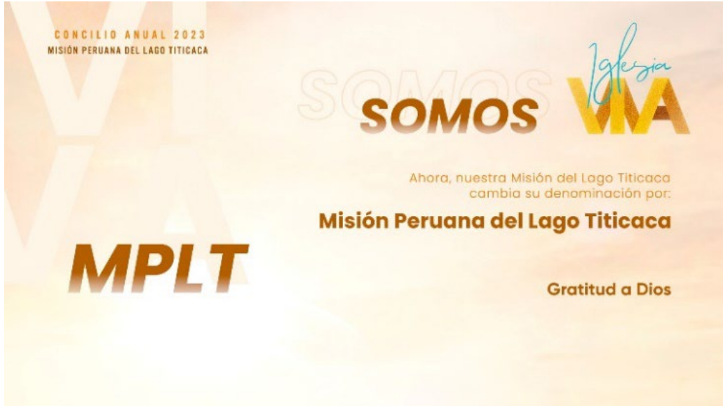
Imagen N° 1.1: Designación del Concilio anual 2023 para el cambio de nombre