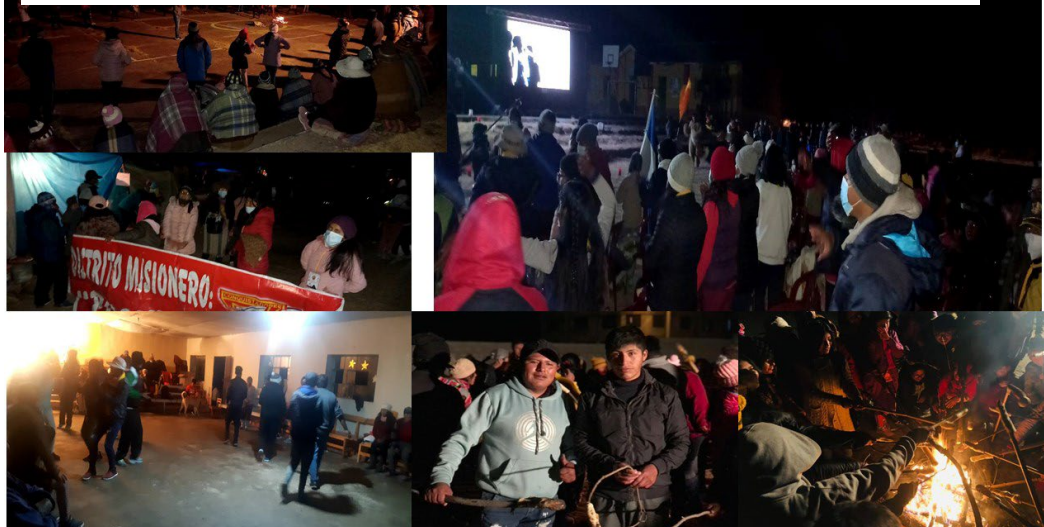
Imagen N°2.0: Juegos Sociales, Jincanas sábado de Noche.