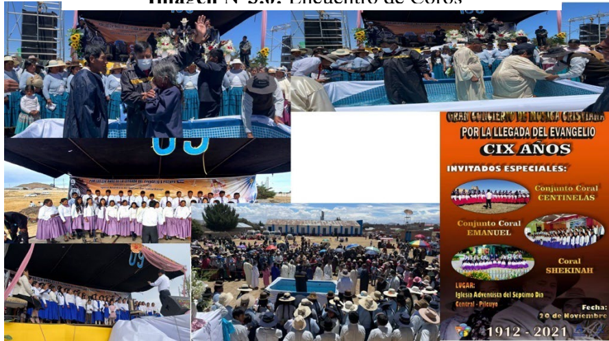
Imagen N°3.0: Encuentro de Coros

Encuentro de todos los distritos en los aniversarios de cada iglesia y bautismos.