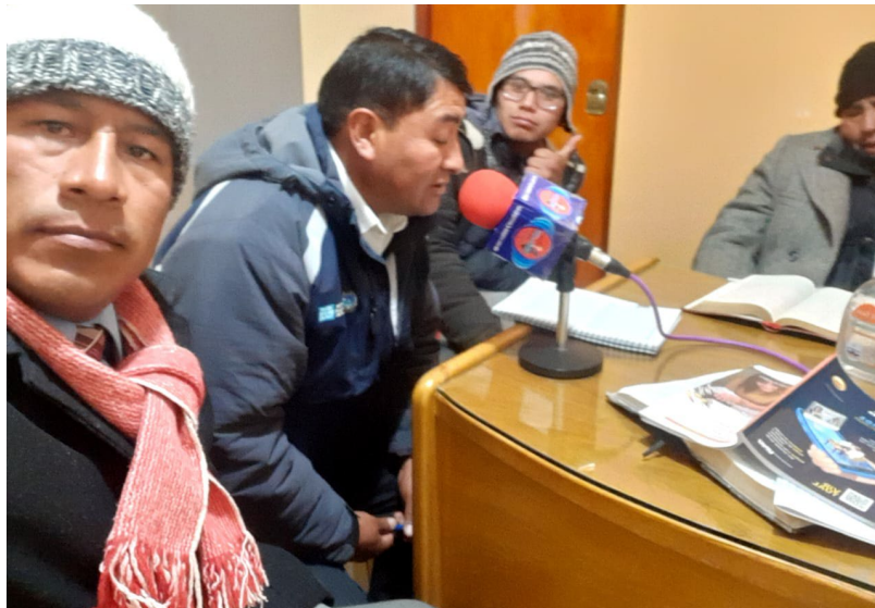
Imagen N°2.9: Programa de Radio “amanecer con Dios”

Todos los sábados a partir de las 4.30 de la mañana en la ciudad de Ilave, se presenta un programa radial, donde se hace repaso de la lección de escuela sabática, anuncios principales y un espacio de música cristiana con entrevistas.