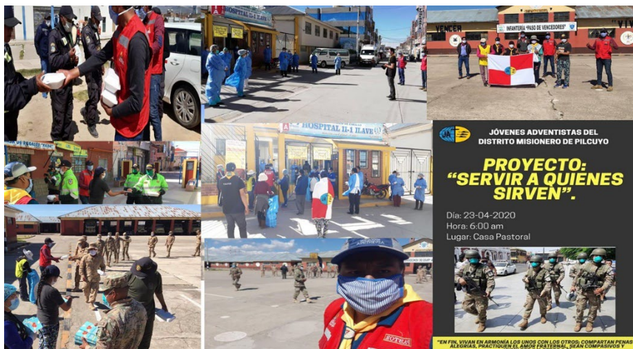
Imagen N°2.4: Actividad a la comunidad

Desarrollado hacia la comunidad a cargo de todos los jóvenes del Distrito Misionero denominado “SERVIR A QUIENES SIRVEN”.