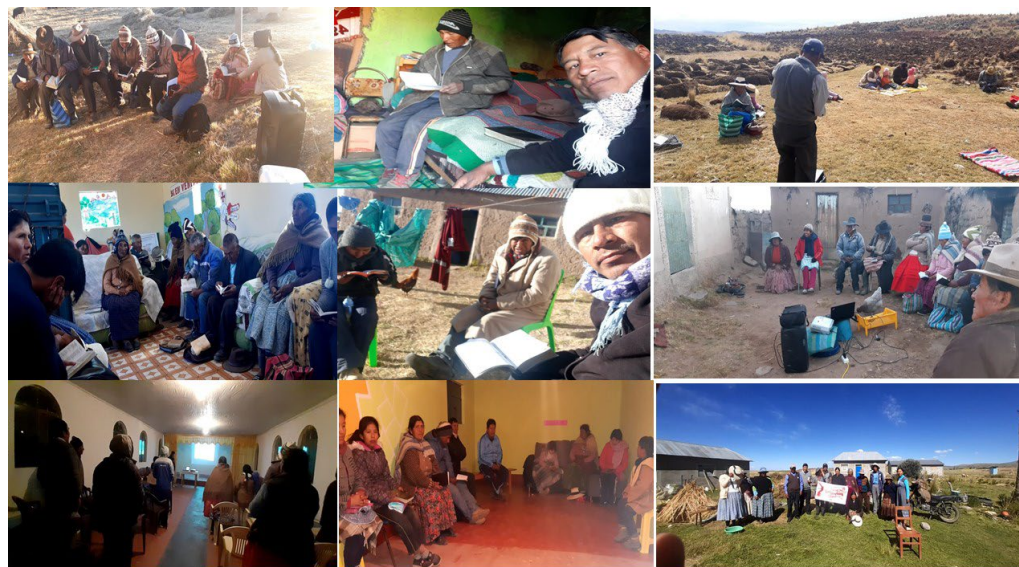
Imagen N°1.9: Visitación Pastoral

El bachiller diseño un plan de visitación general (necesidades de la iglesia y hermanos de iglesia) de acuerdo con el itinerario pastoral, a las iglesias correspondiente según la fecha programada.