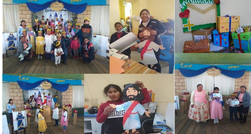
Imagen N°2.5: Escuela Cristiana de Vacaciones del Ministerio del Menor

Programas desarrollados para niños, como Escuela Cristiana de Vacaciones y cada fin de trimestre la pre trimestral del ministerio del menor.