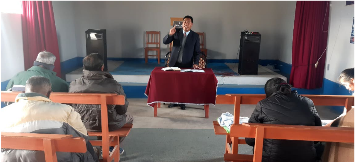
Imagen N°1.7: Reunion de Lideres de iglesia