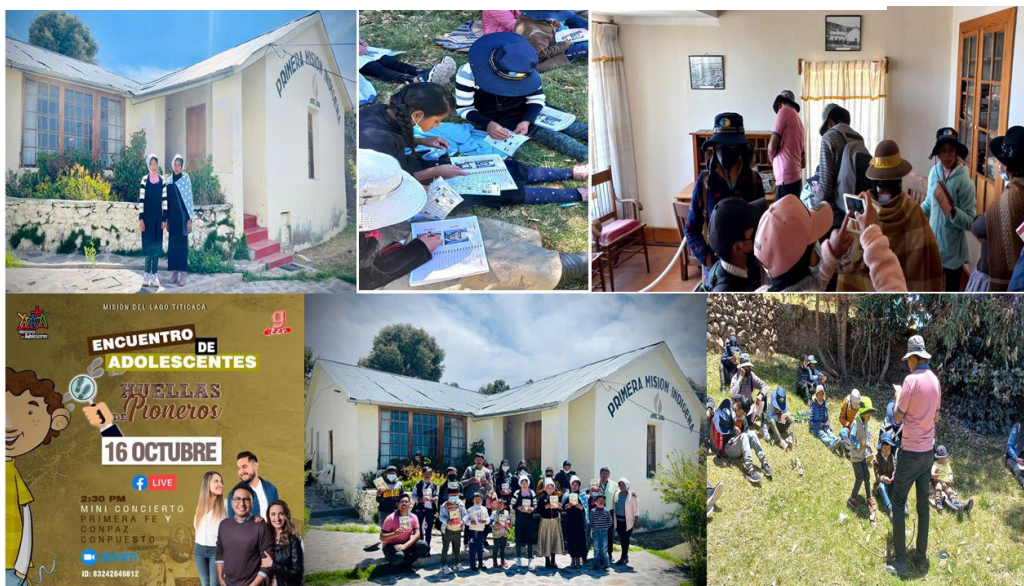
Imagen N°2.1: Encuentro de Adolescentes

“Huella de Pioneros”. Este programa se desarrolló, desde el Ministerio del Menor de la MPLT y se aplicó en la Iglesia Central de Pilcuyo con el objetivo de fortalecer la identidad en nuestros adolescentes, llevando un domingo a la casa del Pastor Fernando Stahl en Platería- Puno y visitar su museo.