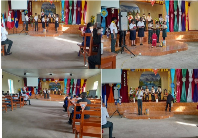
Imagen N°2.2: Creación del Club Federick Weeler

La creación del Club de conquistadores Federek Weeler, como base para la formación de líderes.