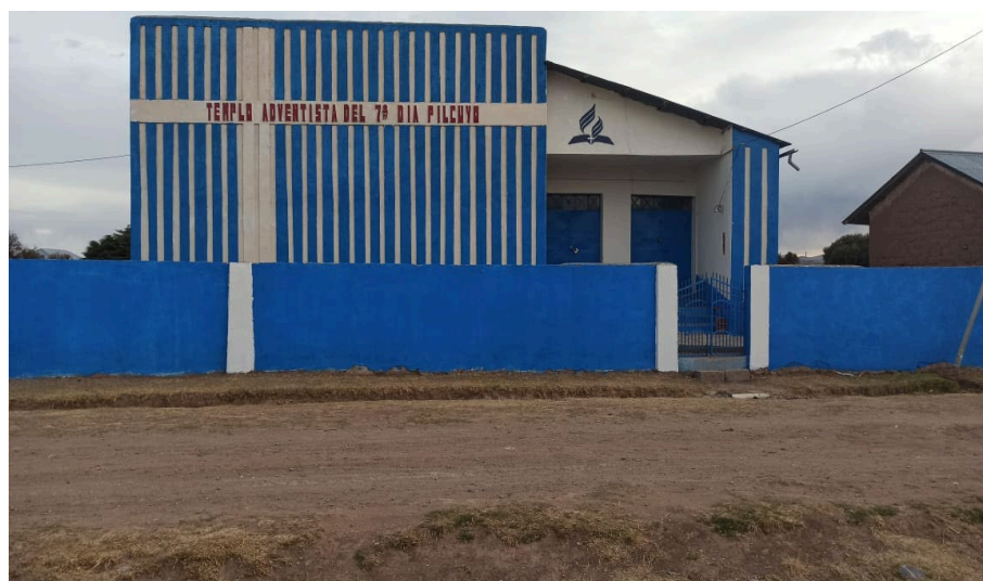
Imagen N°1.4: Iglesia Central Adventista de Pilcuyo

En la tabla se puede ver que el distrito misionero está dividido en 4 zonas (Alta, Central, Media y Lago), la iglesia Central de Pilcuyo cuenta con 70 miembros es la más grande por ello es la Central del distrito, además por ser la más antigua, es ahí donde se aplicó el plan de discipulado “reavivamiento y reforma”.