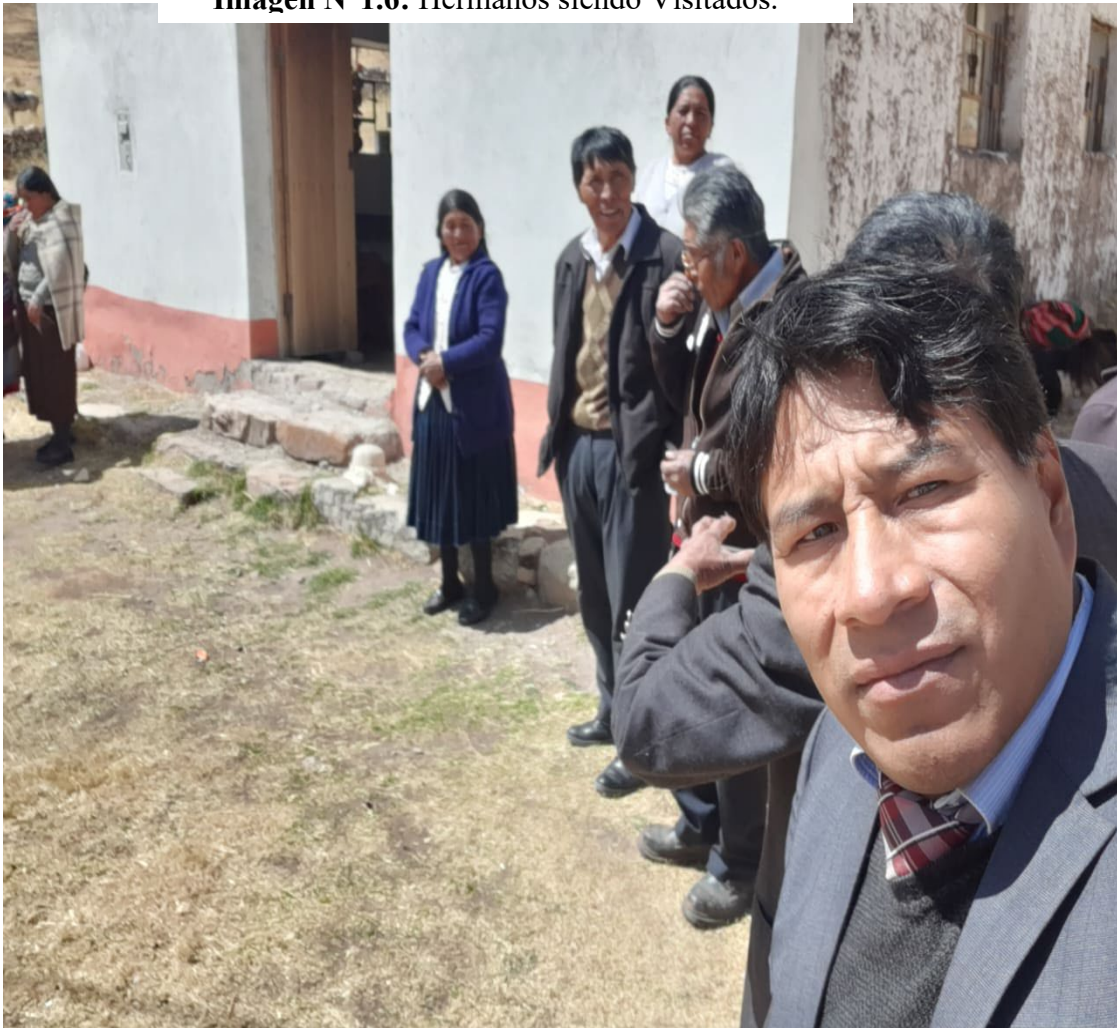
Imagen N°1.6: Hermanos siendo Visitados.

El bachiller con el resultado del FODA, tiene un análisis más preciso para aplicar el plan “reavivamiento y reforma”, frente a las necesidades urgentes del Distrito Misionero y en especial la Iglesia Central de Pilcuyo.