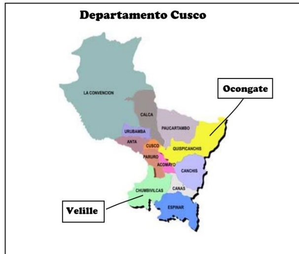
Figura N°1: Mapa de la región de cusco

La región Cusco está situado en la zona sur oriental, en la sierra del Perú, a una altitud de 3300 msnm. El distrito de Velille se localiza en la provincia de Chumbivilcas, entre los paralelos 14° 30' 18" de la latitud sur y los meridianos 71° 53' 06" de la longitud oeste. Su extensión territorial es de 45135 Km 2 teniendo una altura variada dese 3,200 hasta 4,800 m.s.n.m. El distrito Ocongate Se encuentra en la parte sur este de la provincia de Quispicanchi, teniendo coordenadas geográficas siguientes: Latitud Sur: 13° 37' 24" y Longitud W: 71° 23` 07", tiene 3 535 metros de altitud.