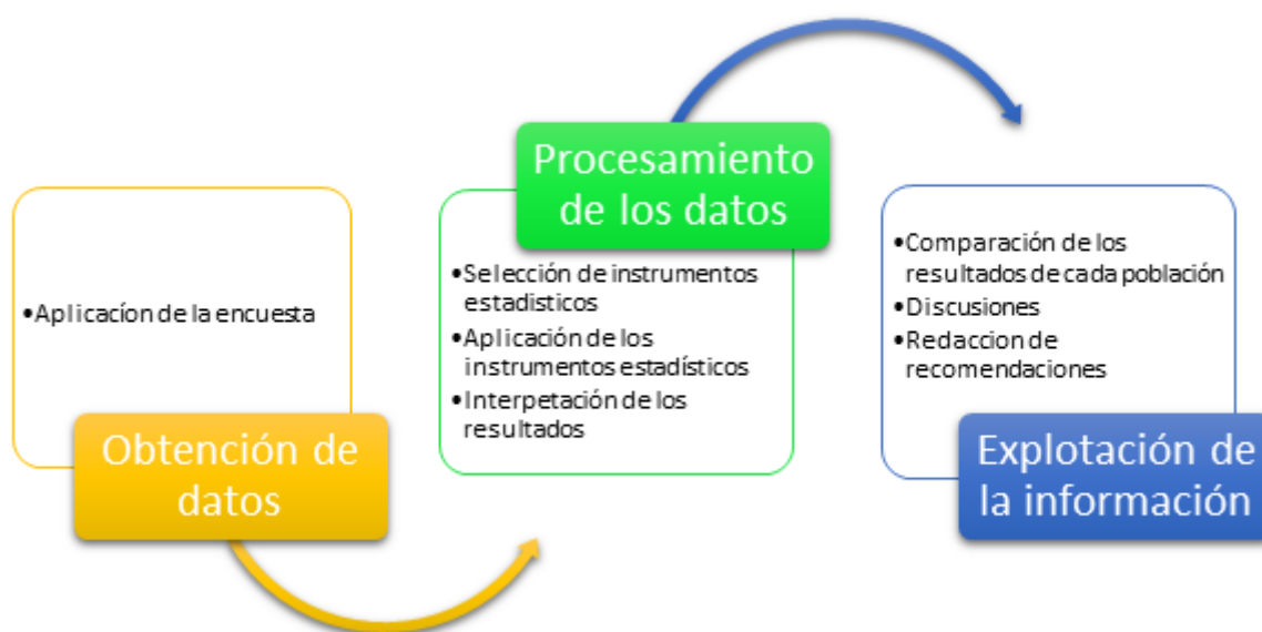
Figura N° 2: Cuadro del proceso de la investigación

Para la obtención de datos se aplicó una encuesta de 19 preguntas, 5 del factor social, 6 del factor económico y 7 del factor cultural. Luego se procesó los datos en Wilcoxon y se determinó las frecuencias de prevalencia para su interpretación. Por último, se realizó la explotación de la información donde se comparó los resultados de cada población, se registró discusiones y la redacción de recomendaciones.