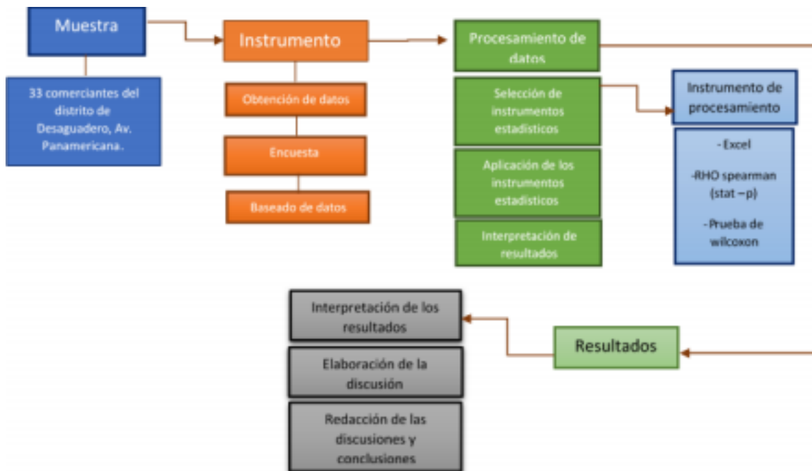
Figura 2. Pasos de la investigación, la presente figura muestra los pasos realizados para realizar la presente investigación.

De acuerdo a la muestra representada por 33 comerciantes del distrito de Desaguadero, Av. Panamericana se utilizó el instrumento para la obtención de datos aplicando la encuesta para el baseado de datos en el programa excel, el procesamiento de los datos obtenidos nos permitió seleccionar el instrumento estadístico para la aplicación del mismo, esto nos permitió interpretar los resultados. El instrumento de procesamiento de los datos fue a través del programa excel donde nos mostró el RHO de spearman y la prueba de wilcoxon que permitió ver de cerca el resultado, con esto pudimos interpretar los resultados relacionando las variables según las preguntas más sobresalientes, la elaboración de la discusión nos permitió manifestar a través de lectura como es que nuestra realidad se ha marcado por el entorno social, una vez aclarada nuestras ideas procedimos a la redacción de las discusiones y conclusiones de la respectiva investigación.