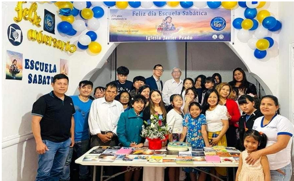
Anexos 1.6: Dios tenía para para nosotros un lugar reservado, entonces tuvimos nuestro primer culto en nuestro templo, después de 8 años de habernos reunido en casa, ahora podíamos hacer santa cena, capacitaciones, seminarios y actividades de camaradería.