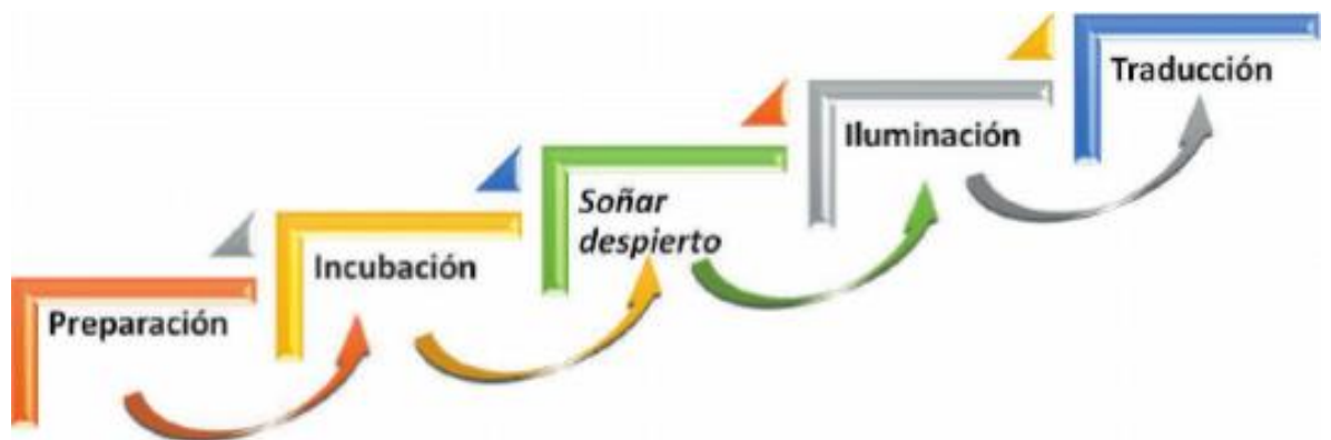
Figura 2. Pasos básicos del proceso creativo tomado de Rosa María Torres Valdez. Universidad de Alicante (2000)